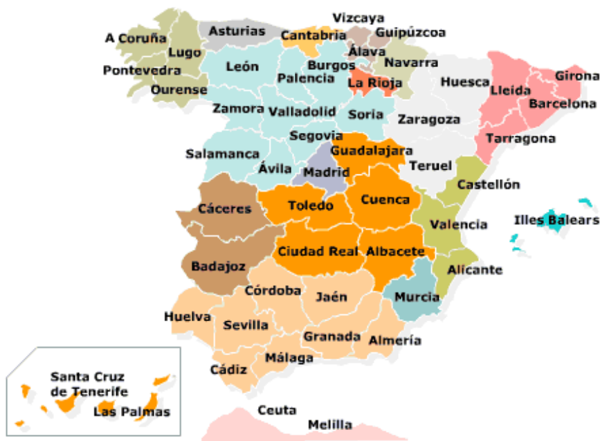
Mapa č.1: Regionální členění Španělska a znázornění volebních obvodů