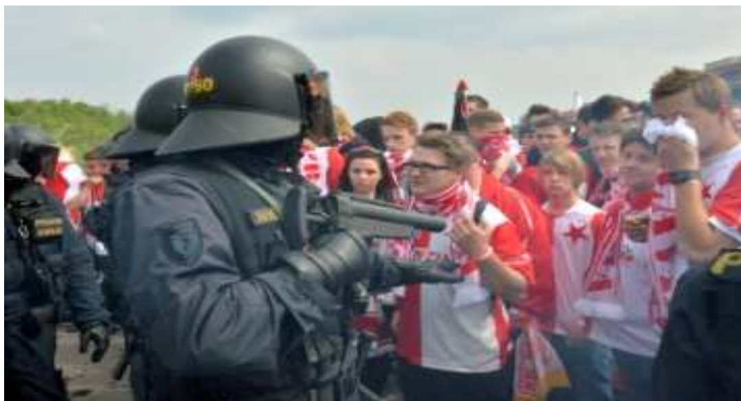
Obrázek 2: Udržení davu pomocí neletální zbraně vrhač H&K vzor 69