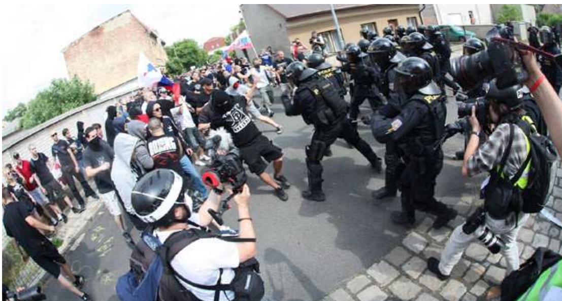
Obrázek 1: Nepokoje Duchcov 2013, napadení družstev pořádkové jednotky