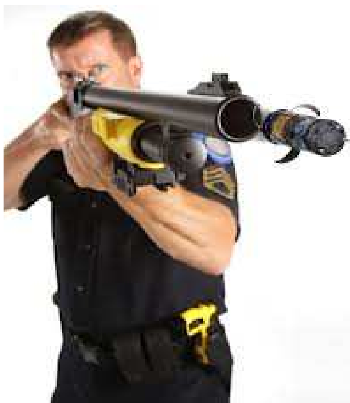
Obrázek 10: Vystřelený projektil Taser XREP z opakovací brokovnice