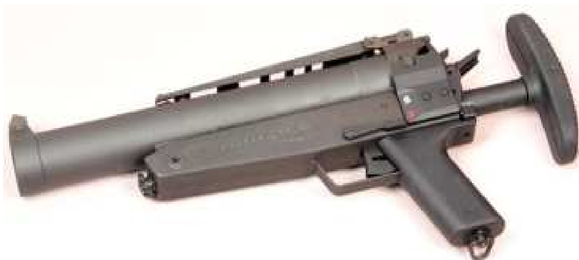
Obrázek 7: Vrhač H&K vzor 69