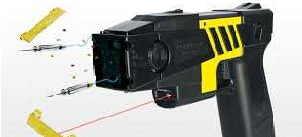
Obrázek 9: Taser x26 při výstřelu sond