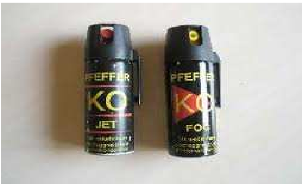
Obrázek 3: Slzotvorné spreje KO JET (tekutá střela) a KO FOG (mlha)