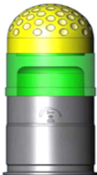
Obrázek 6: Neletální munice do vrhače H&K vzor 69 s inertní střelou