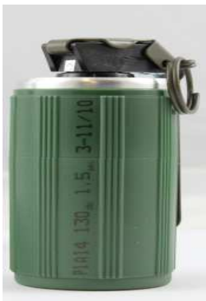
Obrázek 4: Zásahová výbuška P2