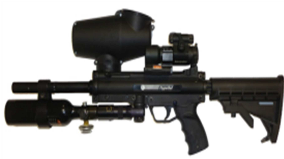
Obrázek 8: Pepperball značky Tippmann