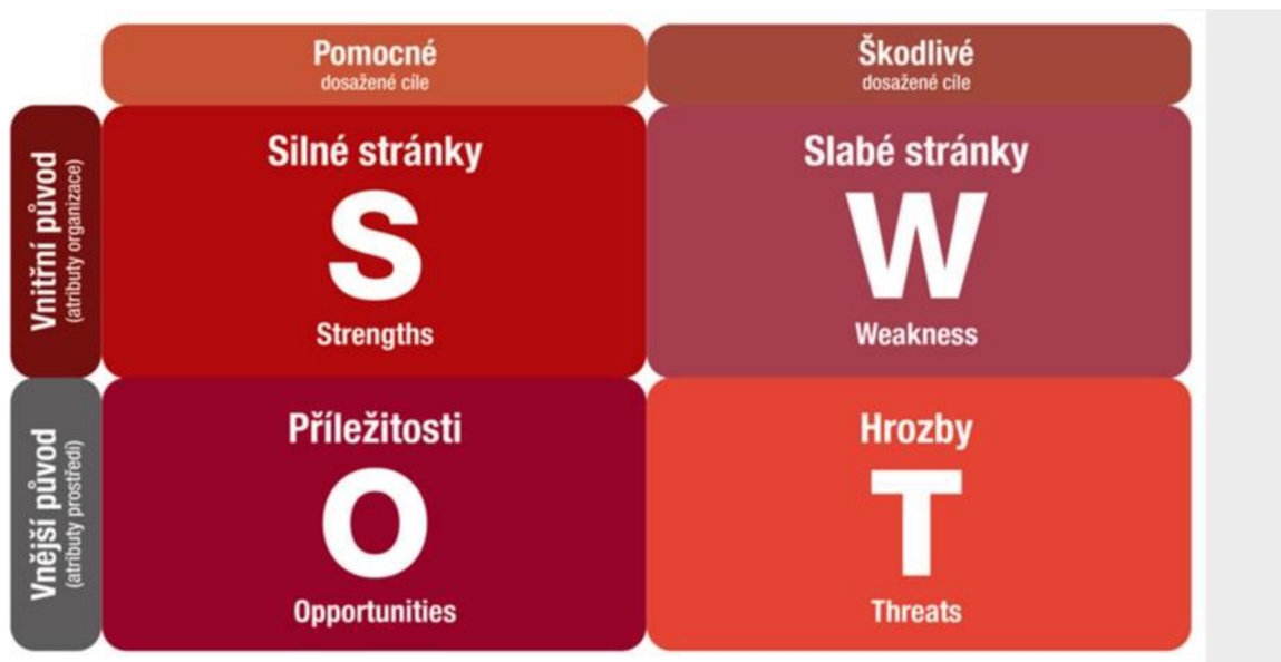
Obrázek 1 - SWOT analýza