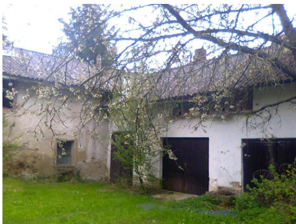
Obr. 5: Dvůr Reynkova domu s kvetoucí jabloní