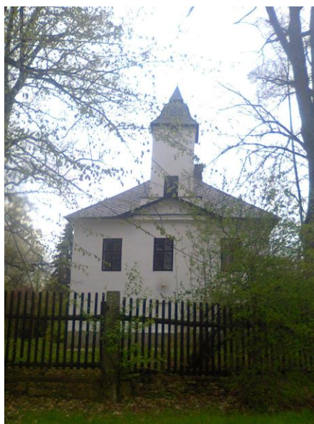
Obr. 1: Reynkův dům v Petrkově

času věnovaného práci pod širým nebem, stýkaly se tu dva Reynkovy světy - venkovní a vnitřní, přičemž navzdory svému kontrastu byly v harmonii: „ Vše, co se venku nashromáždilo přes den při procházkách a lopocení, večer překročí práh, schouleno únavou; veškeré sny a vjemy vstupují do domu, aby se tam zbavily různých nánosů, aby byly zváženy - a zpracovány. “ 22