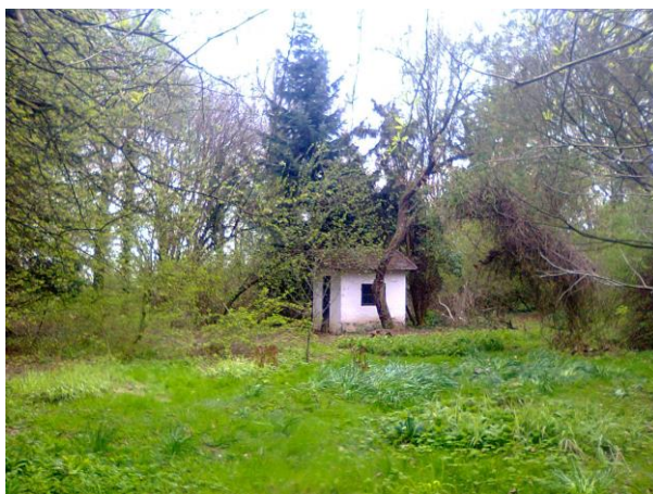
Obr. 2: Zahradní domek

I zahrada je vnímána jako místo kontrastu mezi domovem a přírodou, stejně jako dům může představovat útočiště - a Bohuslav Reynek tuto její funkci naplnil. Nechal si zde postavit malý domek, kam chodil číst, tvořit i naslouchat přírodě (viz obrázek č. 2).