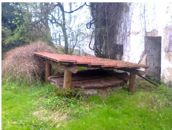
Obr. 4: Studna na petrkovském dvoře

V některých básních se objevuje studna (viz obrázek č. 4), která bývá spojována s pocitem klidu a stává se jedním ze symbolů básníkovy domova i jeho minulosti.