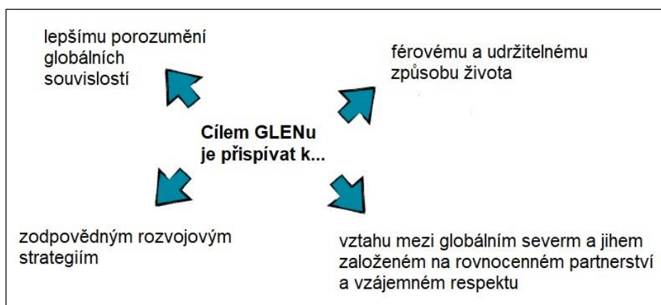
Obrázek 3: Cíle GLENU vycházející z dohody členských organizací (GLEN 2017, GLEN 2011).

Misí GLENU bylo „ vytvářet prostor kučení a rozvíjení potenciálu lidí a organizací v rolích globálních aktérů. Podněcuje je, aby přispívali férovému a udržitelnému rozvoji svých komunit, zemí a celého světa. GLEN zakládá na evropské zkušenosti... “ (GLEN 2014, str. 1).