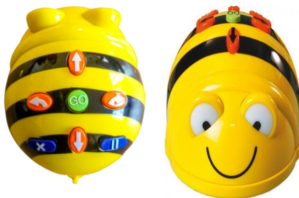
obr. 3: