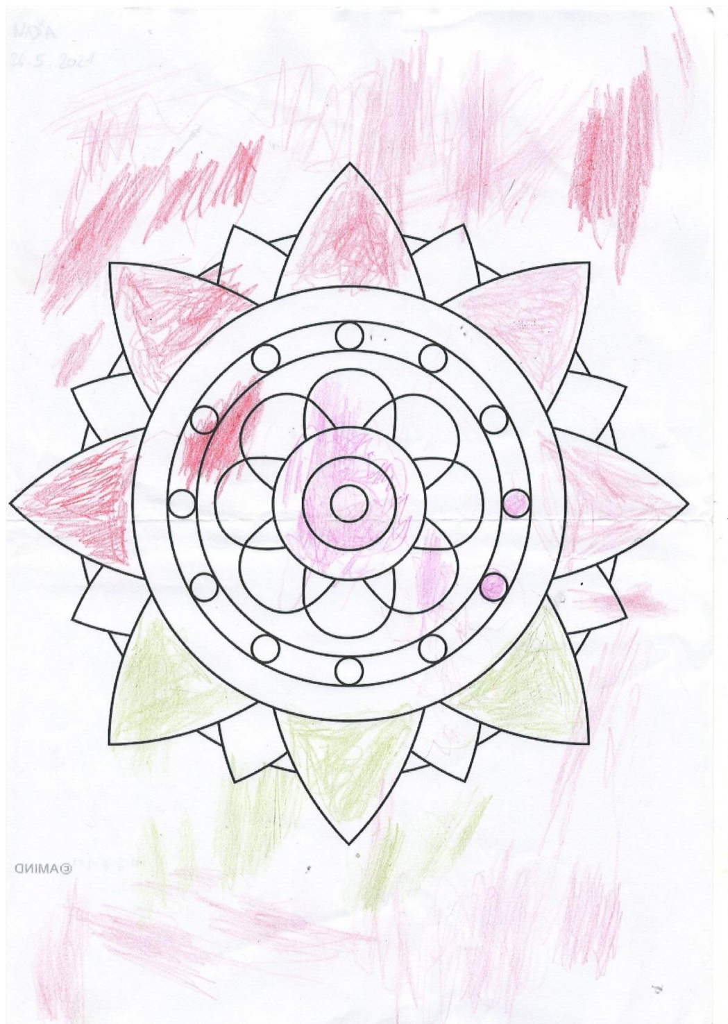
Příloha č. 1 – Mandala paní N.