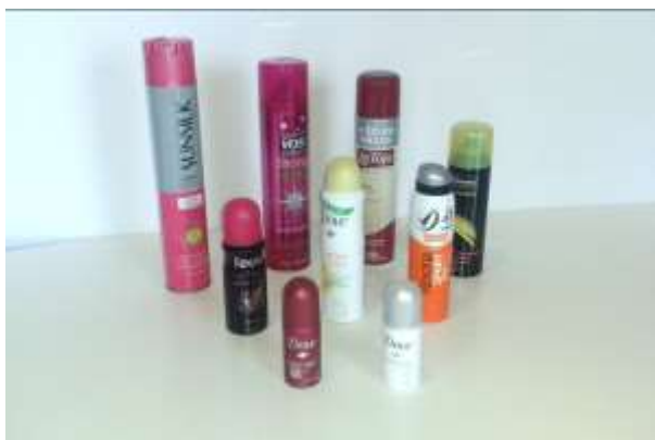
Obr. 3.2. Aerosolné produkty