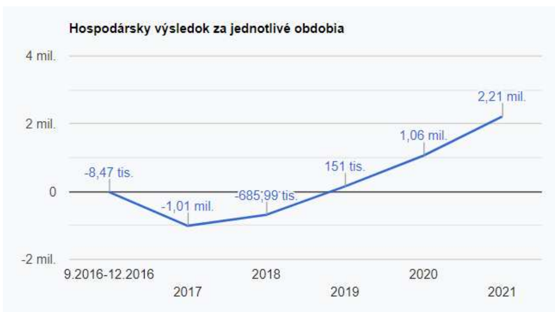
Graf 2 Hospodársky výsledok