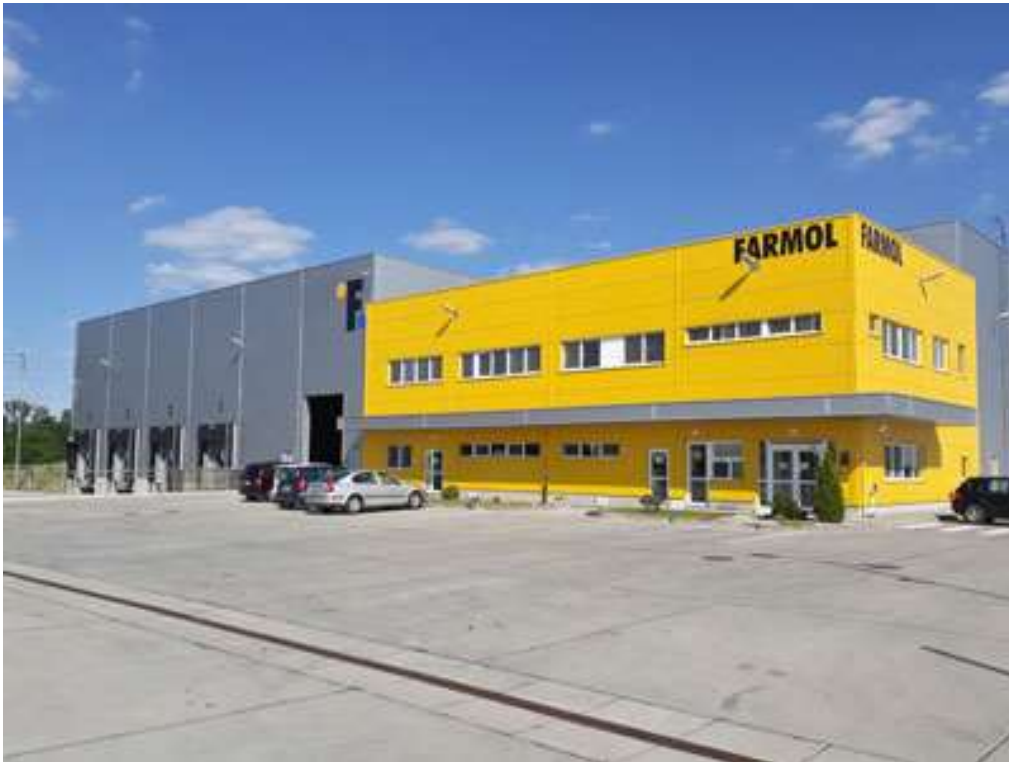
Obr.3.1 Sídlo spoločnosti Farmol v Leviciach

Cieľom spoločnosti je dosiahnuť nulový časový plot, vyslovene zameranie sa na zákazníka a konsolidované partnerstvá s významnými medzinárodnými spoločnosťami.