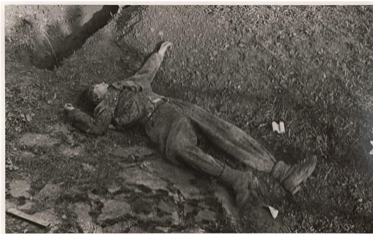
Příloha č. 3: Zabitá německá vojačka SS