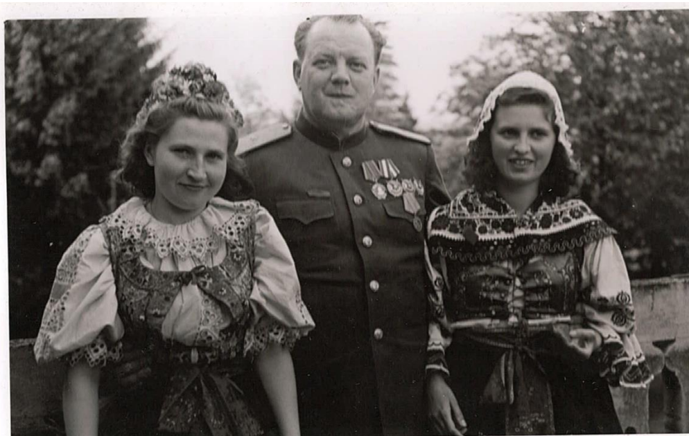
Příloha č. 6: Generál Zajončkovskij v Náchodě