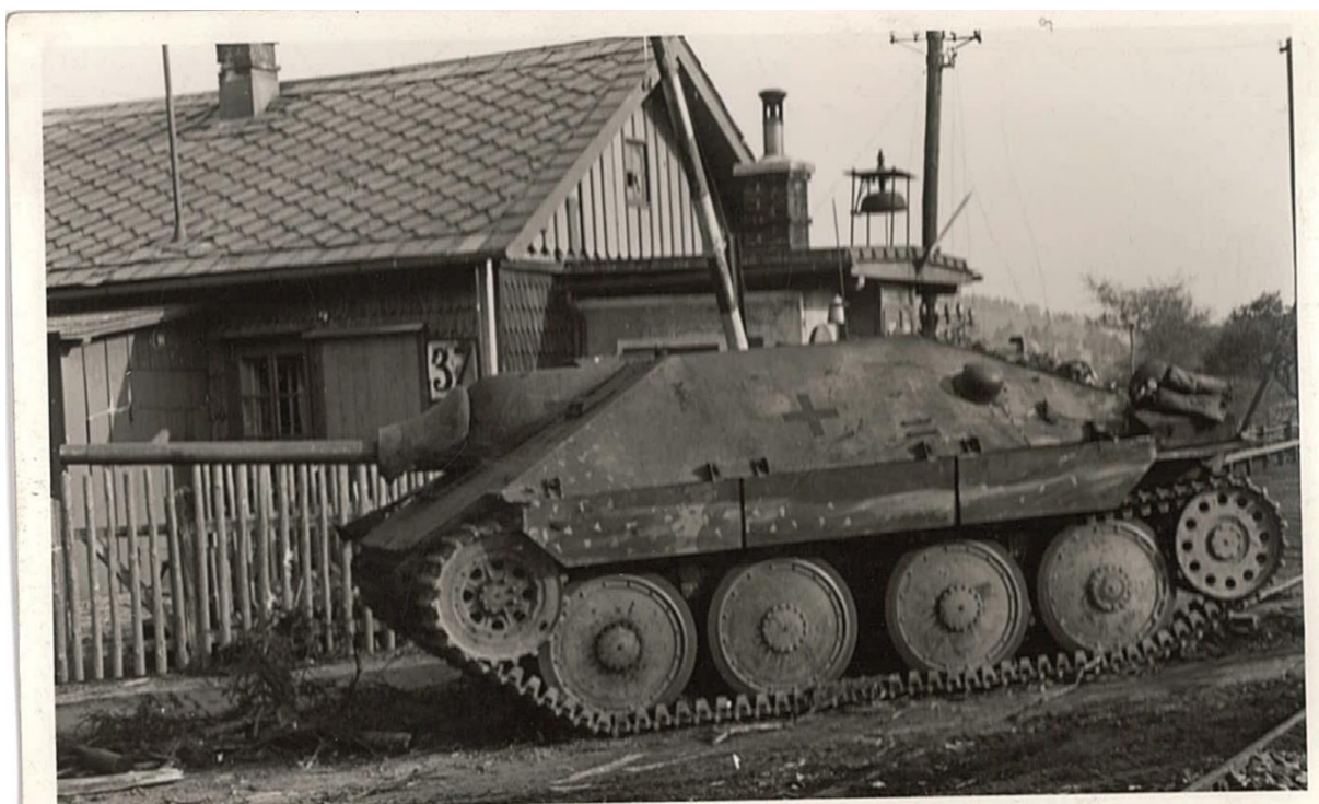
Příloha č. 4: Německý „Hetzer“ po boji u celnice.