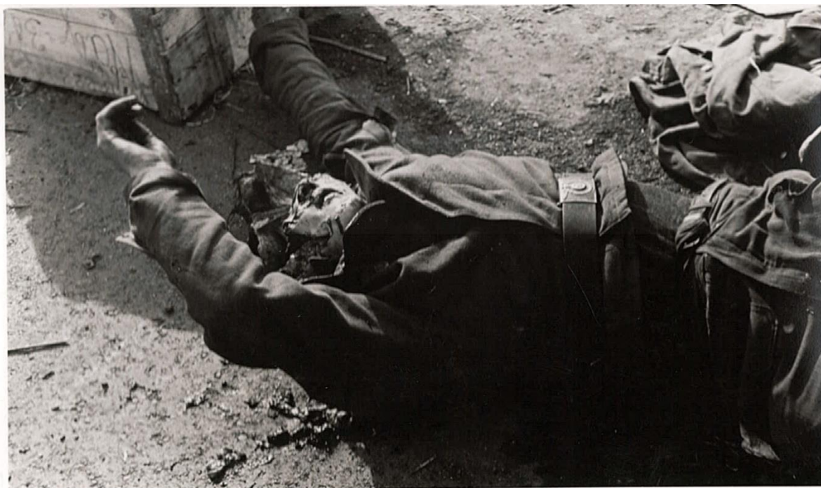
Příloha č.5: Esesman zastřelený při výlezu z jednoho z pancéřů