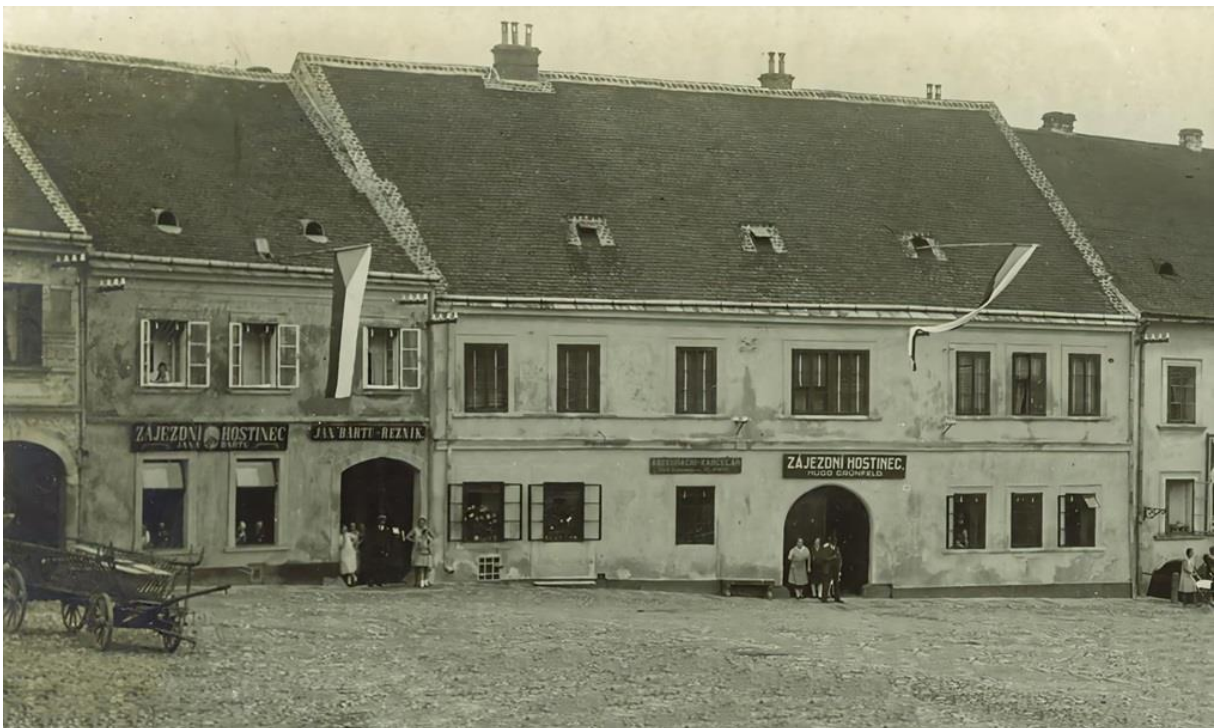
Příloha č. 4: Zájezdní hostinec u Grünfeldů.