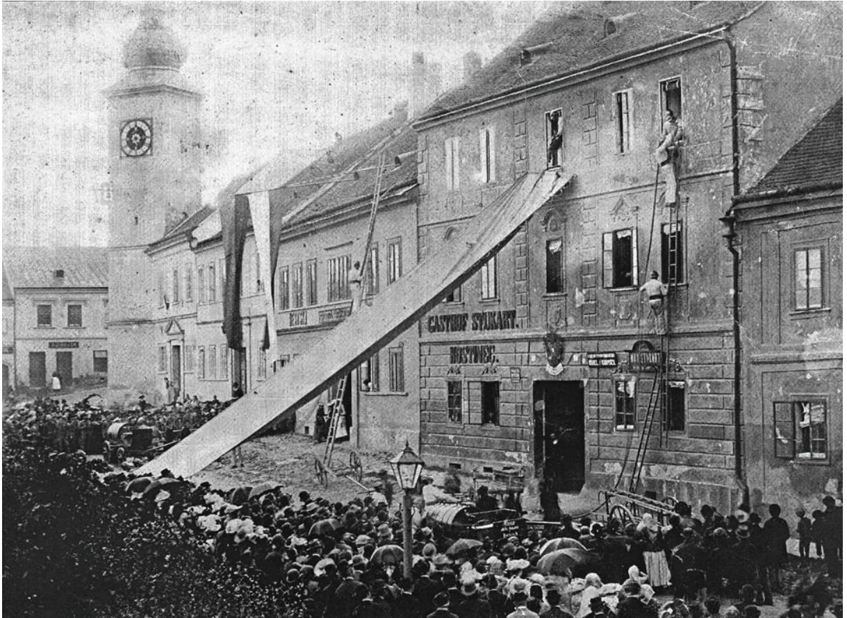
Příloha č. 3: Hostinec u Stukartů.