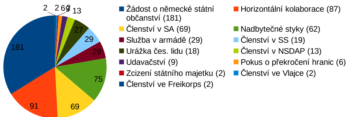
Graf 1: Četnost jednotlivých provinění

Jak lze vyčíst z tabulky, největší zastoupení mělo hlášení se k německé národnosti. Stejný přečin převládá taky u TNK Pardubice 124 , která řešila 273 takových případů; u TNK Jablonec nad Nisou 125 ; u TNK Trutnov 126 , kde komise řešila 127 případů či u TNK v České Lípě 127 .