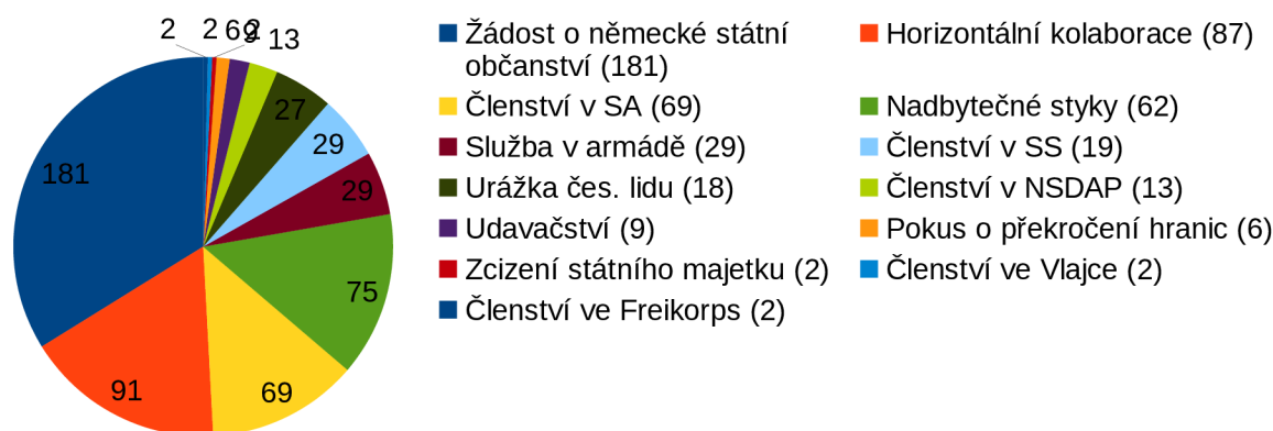
Graf 1: Četnost jednotlivých provinění

Jak lze vyčíst z tabulky, největší zastoupení mělo hlášení se k německé národnosti. Stejný přečin převládá taky u TNK Pardubice 124 , která řešila 273 takových případů; u TNK Jablonec nad Nisou 125 ; u TNK Trutnov 126 , kde komise řešila 127 případů či u TNK v České Lípě 127 .