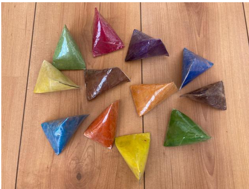
Obrázek 1 - Pomůcka číslo 1