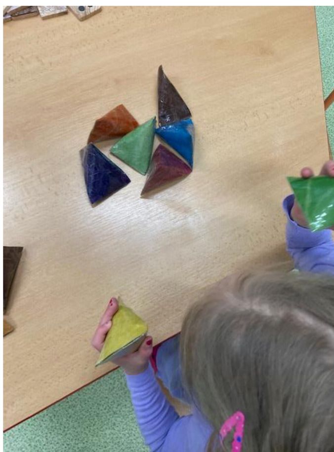
Obrázek 2 - Práce s pomůckou číslo 1

Nedostatkem této pomůcky je především její barevnost. Bystřejší děti si po chvíli zapamatovaly, které barvy k sobě patří, tudíž je svádělo přiřazovat dvojice pouze na základě barev.