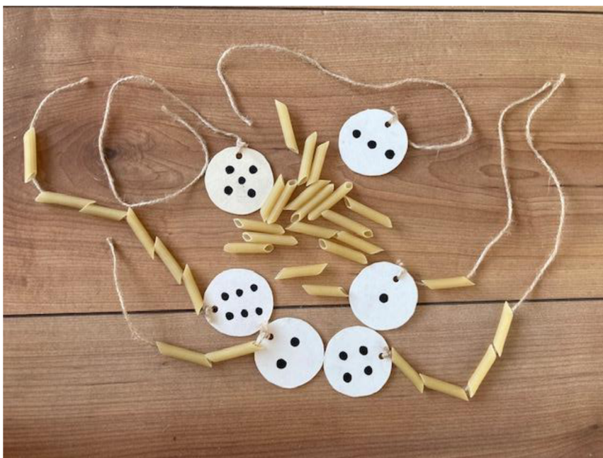
Obrázek 9 - Pomůcka číslo 5