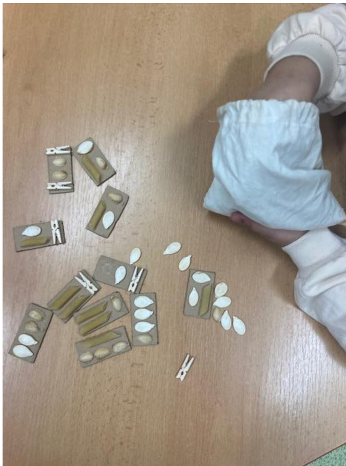
Obrázek 8 - Práce s pomůckou číslo 4

Pomůcka není barevně ani nijak vizuálně zajímavá, a pro děti tak není atraktivní. Kartičky jsou malého formátu, a dětem se tak předměty těžce ohmatávají. Některé předměty jsou si podobné, a tak těžce rozeznatelné. Děti pomůcka nezaujala a práce s ní je nebavila.