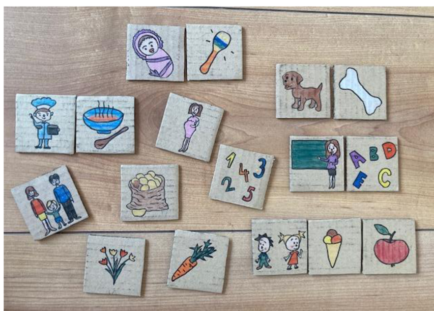
Obrázek 15 - Pomůcka číslo 8