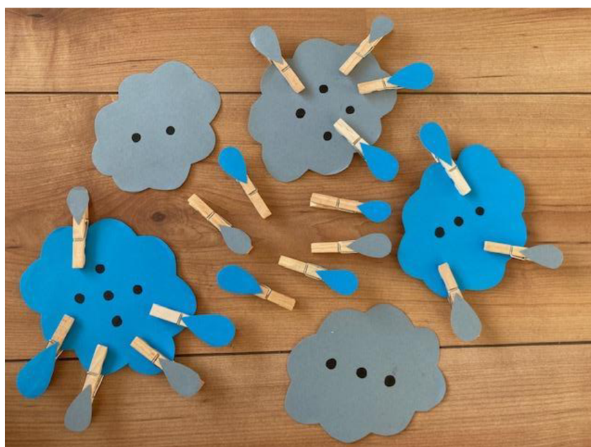
Obrázek 11 - Pomůcka číslo 6