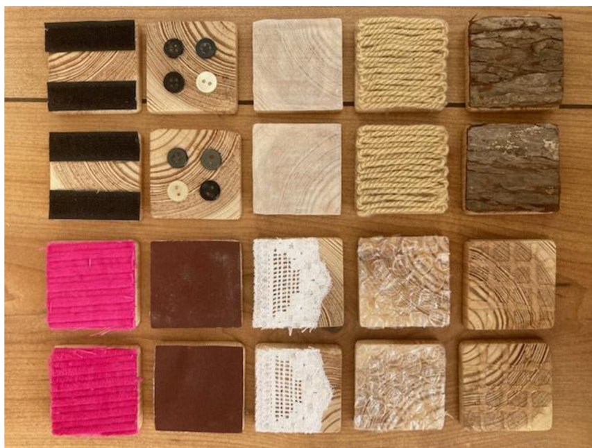
Obrázek 5 - Pomůcka číslo 3