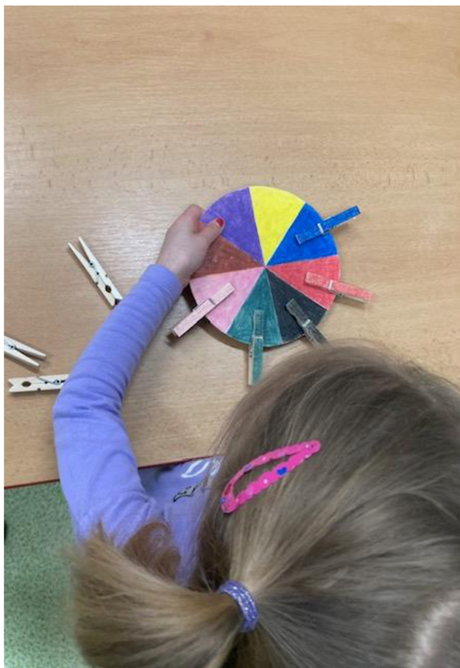
Obrázek 14 - Práce s pomůckou číslo 7

Nedostatkem je nepřiměřenost pro všechny děti. Některé děti měly problém při manipulaci s kolíčkem. Dále bylo nejasné zobrazení barvy pouze na povrchu kolíčku.