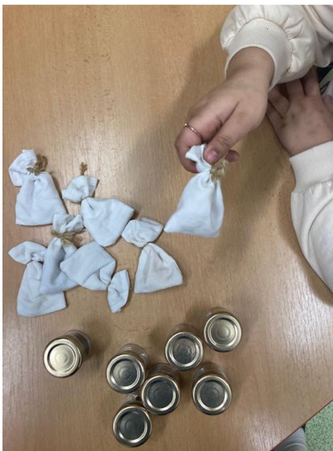
Obrázek 4 - Práce s pomůckou číslo 2

Nedostatkem této pomůcky je možnost hmatového rozlišení. Když děti zjistily, jak předmět ve skleničce vypadá a že předmět v pytlíčku je stejný, snažily se jej poznat hmatem.