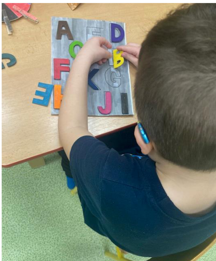
Obrázek 18 - Práce s pomůckou číslo 9

Nedostatkem pomůcky bylo složitější odlepování písmen připevněných suchým zipem. Tím se písmena lehce poničila.