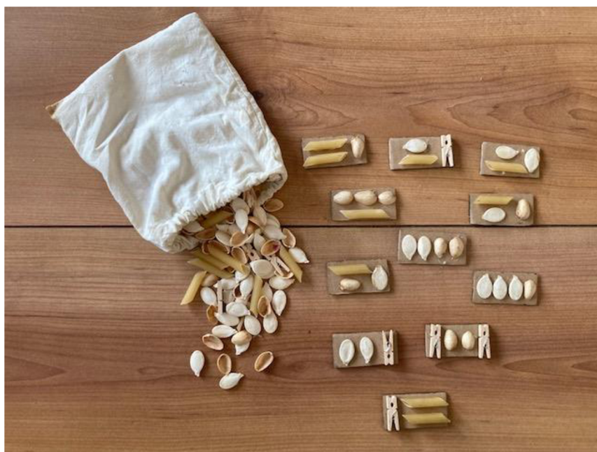
Obrázek 7 - Pomůcka číslo 4