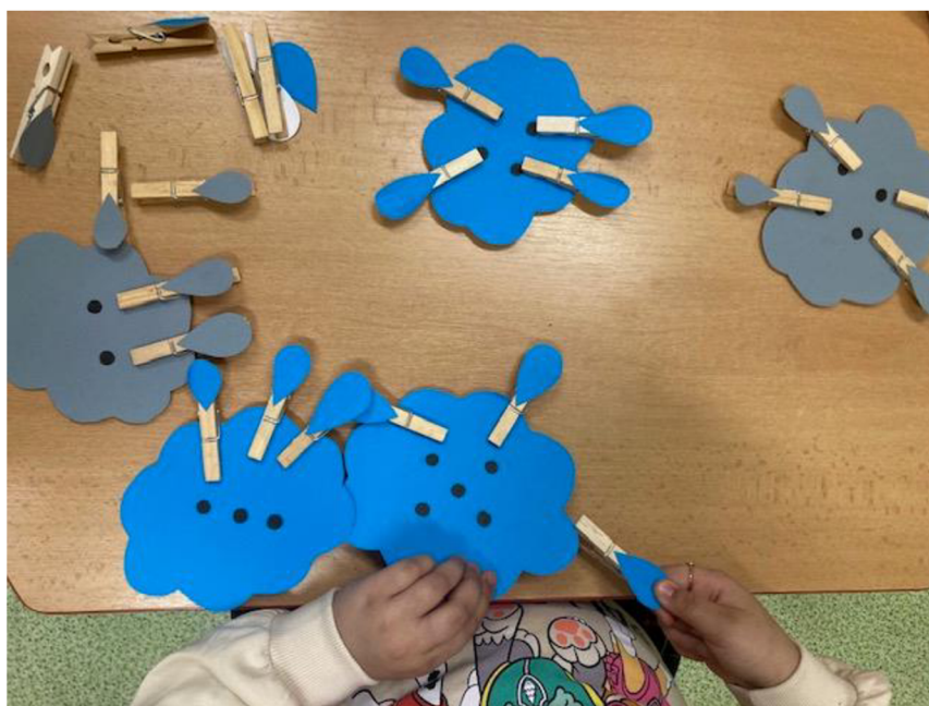
Obrázek 12 - Práce s pomůckou číslo 6

Nedostatkem je nepřiměřenost schopnostem dětí. Pro mladší děti byla problémová manipulace s kolíčky.