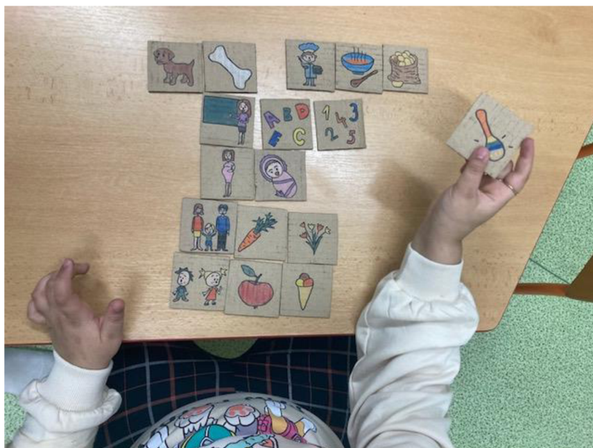
Obrázek 16 - Práce s pomůckou číslo 8