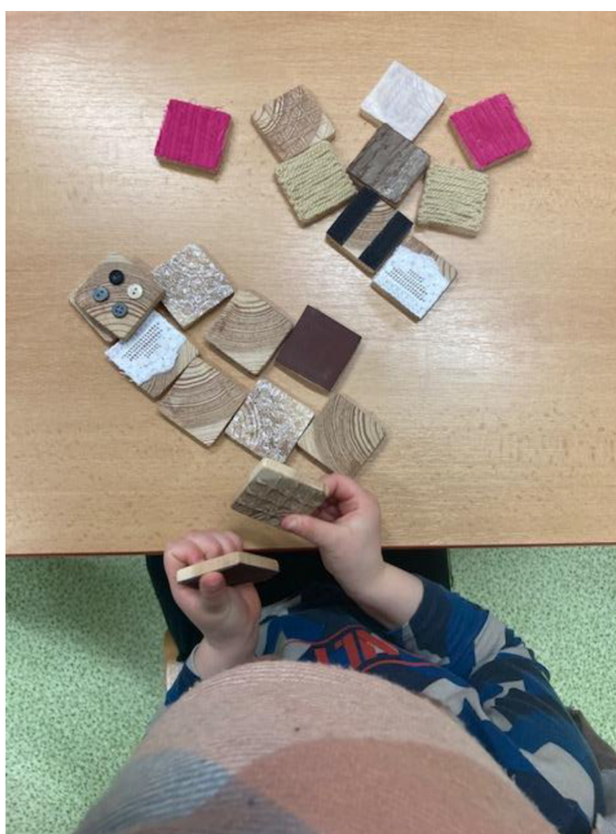
Obrázek 6 - Práce s pomůckou číslo 3

Děti pexeso osahávaly z hladké dřevěné strany. Bylo pro ně těžší se zorientovat, jak je pomůcka správně otočená. Některým dětem dělalo problém mít zavázané oči šátkem. V takovém případě mohly mít oči pouze zavřené.