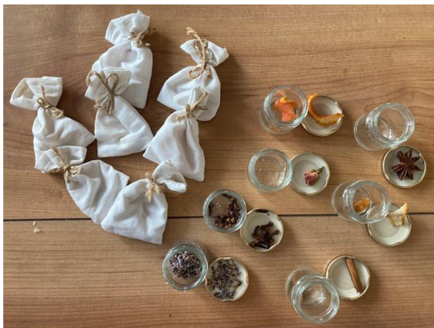
Obrázek 3 - Pomůcka číslo 2