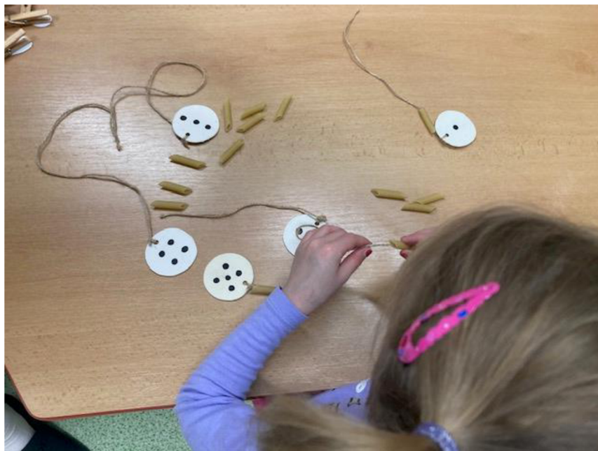
Obrázek 10 - Práce s pomůckou číslo 6

rozvíjely nejen předmatematické představy, ale také jemnou motoriku prostřednictvím navlékání na provázek. Všechny děti zvládly navléct počet od jedné do šesti.