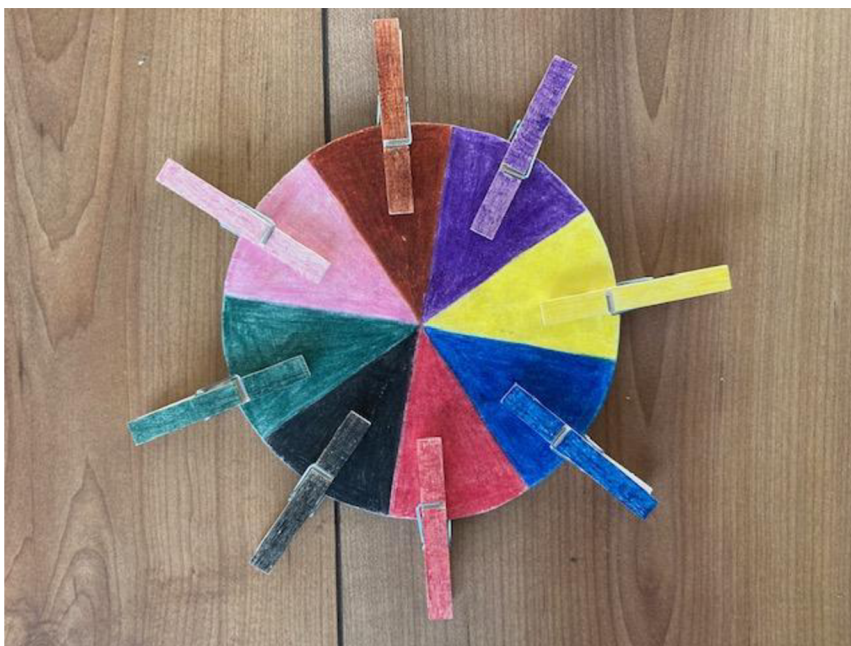
Obrázek 13 - Pomůcka číslo 7