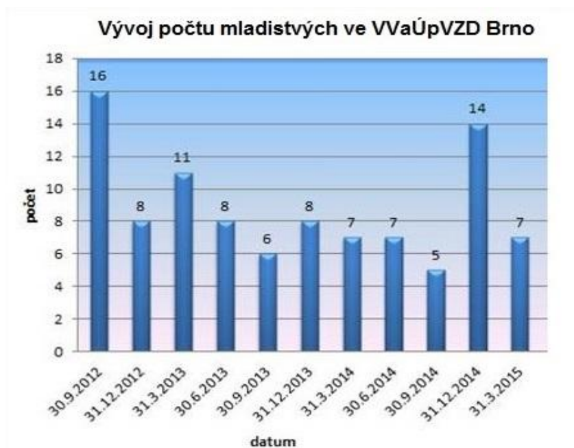
Obr. 2 Vývoj počtu mladistvých ve VVaÚpVZD Brno (VS ČR [online]. Brno: Vazební věznice a ÚVZD Brno, 2016, [cit. 2016-12-11]. Dostupné z: http://www.vscr.cz/veznice-brno-20/informacni-servis-1568/statisticke-udaje-822/ )