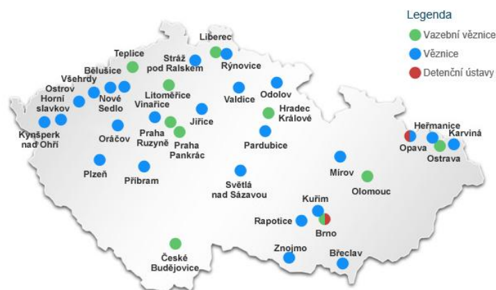
Obr. 1 Přehledná mapa s rozmístěním věznic v ČR (VS ČR [online]. Praha, 2015 [cit. 2016-12-11] Dostupné z: http://www.vscr.cz/oj/ )

Nástupní věznice a vazební věznice jsou určeny jak pro ženy, tak pro muže. Oddělení věznic jsou rozděleny podle pohlaví, povahy trestu nebo věku (ženy, vazba, volná vazba, trest, mladiství). Věznice určené pouze pro ženy se nachází ve Věznici Ruzyně – Velké Přílepy a pro ženy a matky s dětmi se nachází ve Věznici Světlá nad Sázavou. Věznice výhradně pro mladistvé obviněné a odsouzené je ve Věznici Všehrdy. Mladiství dále vykonávají trest odnětí svobody ve Věznici Pardubice a Heřmanice.