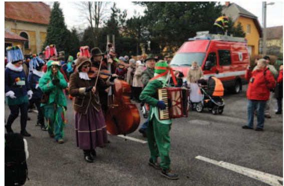
Obrázek 2 – Začátek průvodu s dobovou kapelou