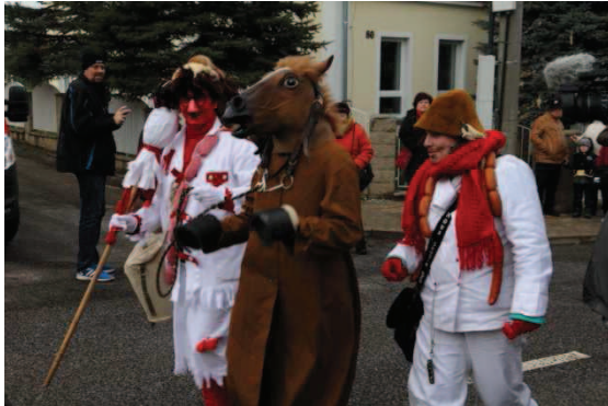
Obrázek 1 – Představování masek – Ras a kobyla