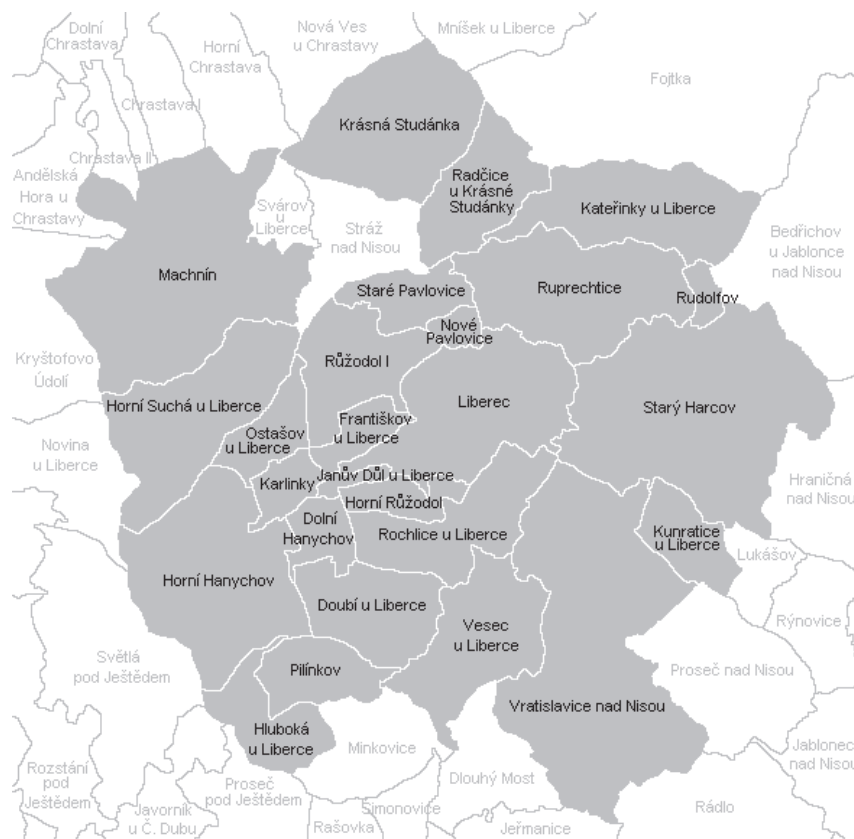
Obrázek 4- územní plán Liberce