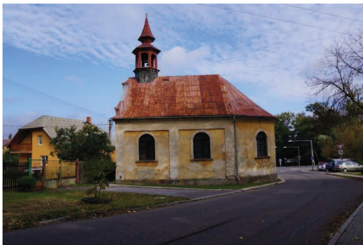
Obrázek 3 - Kostel sv. Vojtěch

Kostel sv. Vojtěcha leží na okraji Liberce v Křižanské ulici. Kostel je majetkem města Liberec, v dnešní době je v péči spolku.