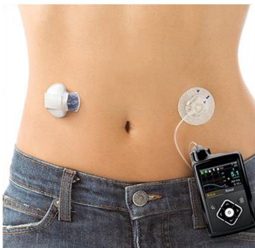
Obr. 3. Systém kontinuálního monitoringu (MEDTRONIC, nedatováno)