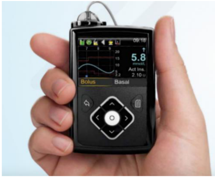
Obr. 4. Displej inzulínové pumpy se zobrazenými základními funkcemi CGM metody