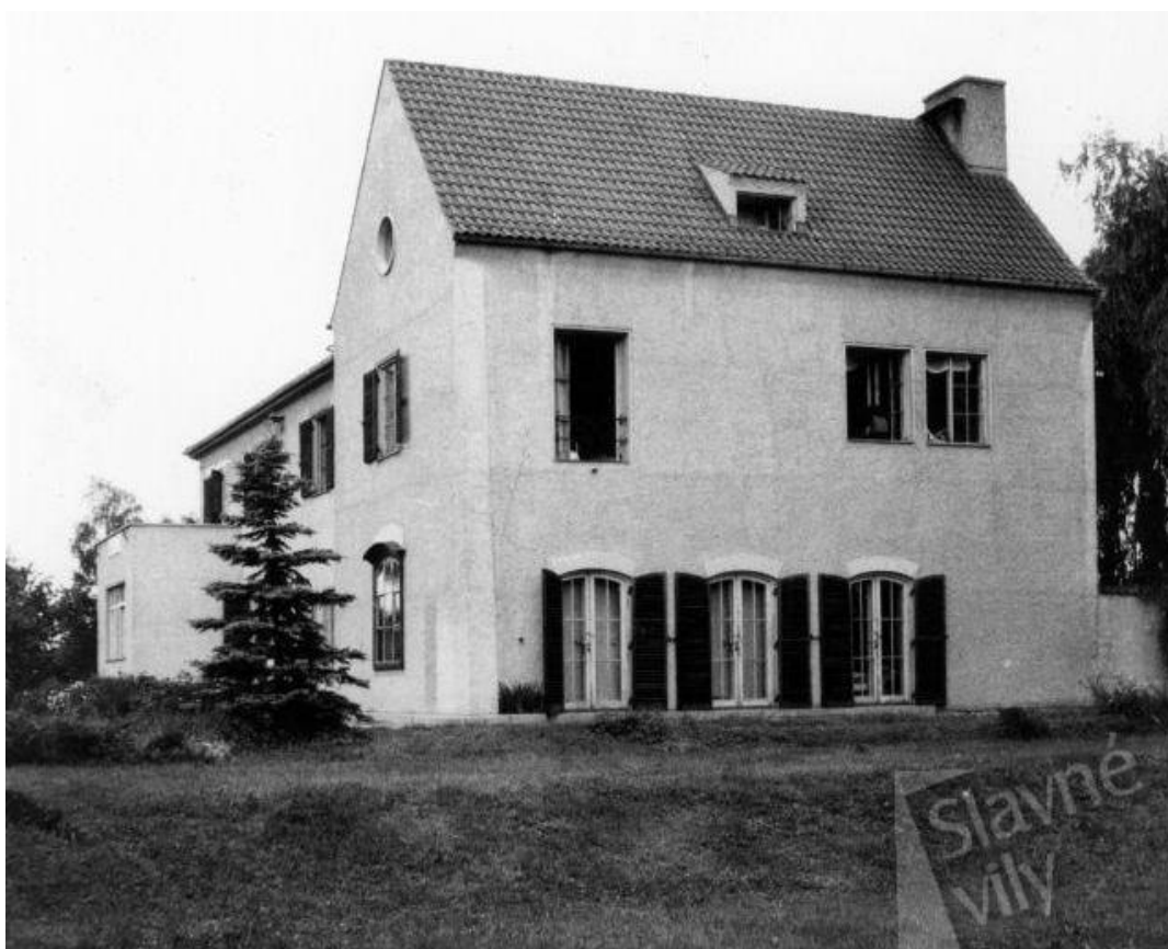
Obr. 23 - Vila Mathilde (Preslova 2, České Budějovice)