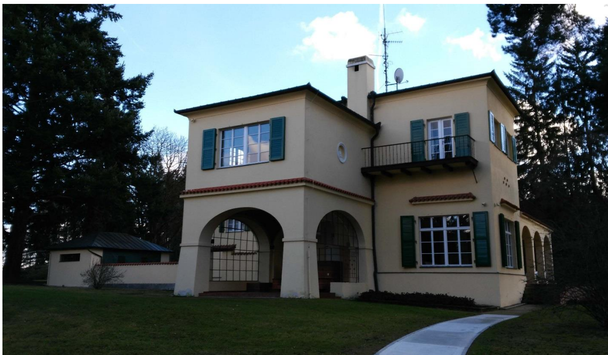
Obr. 13 - Sala terrena na severozápadní straně vily