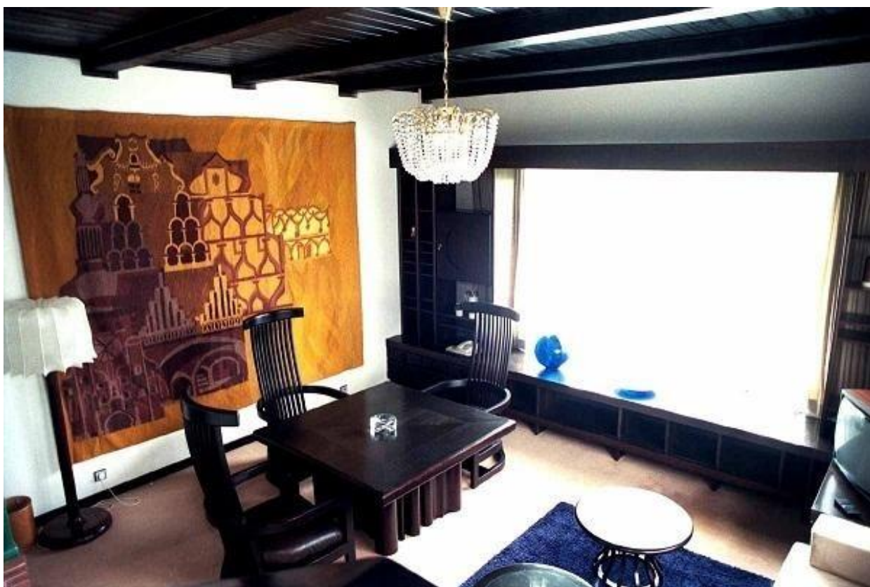
Obr. 19 - Pracovna po přestavbě z roku 1977