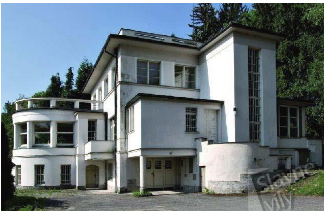
Obr. 25 - Vila Antonína Belady (Ústrašická 12, Planá nad Lužnicí)