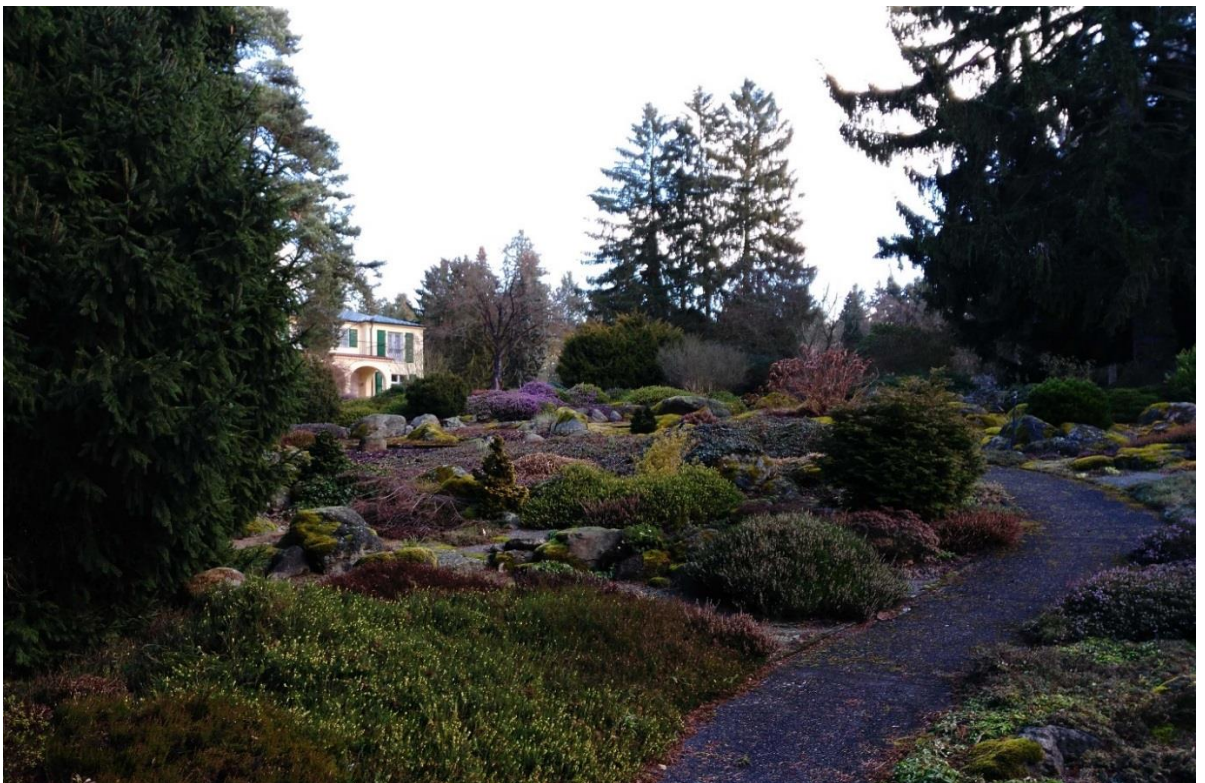
Obr. 6 - Alpinum