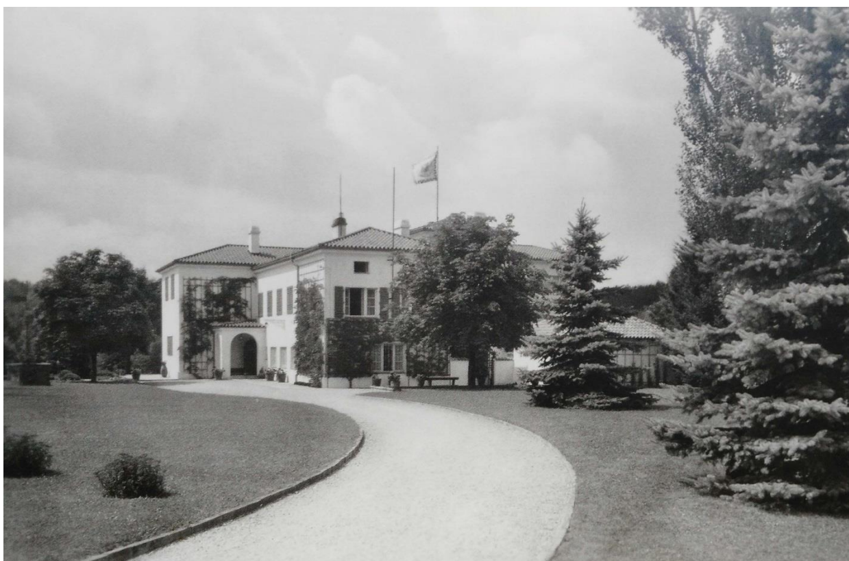
Obr. 10 - Vila v roce 1938