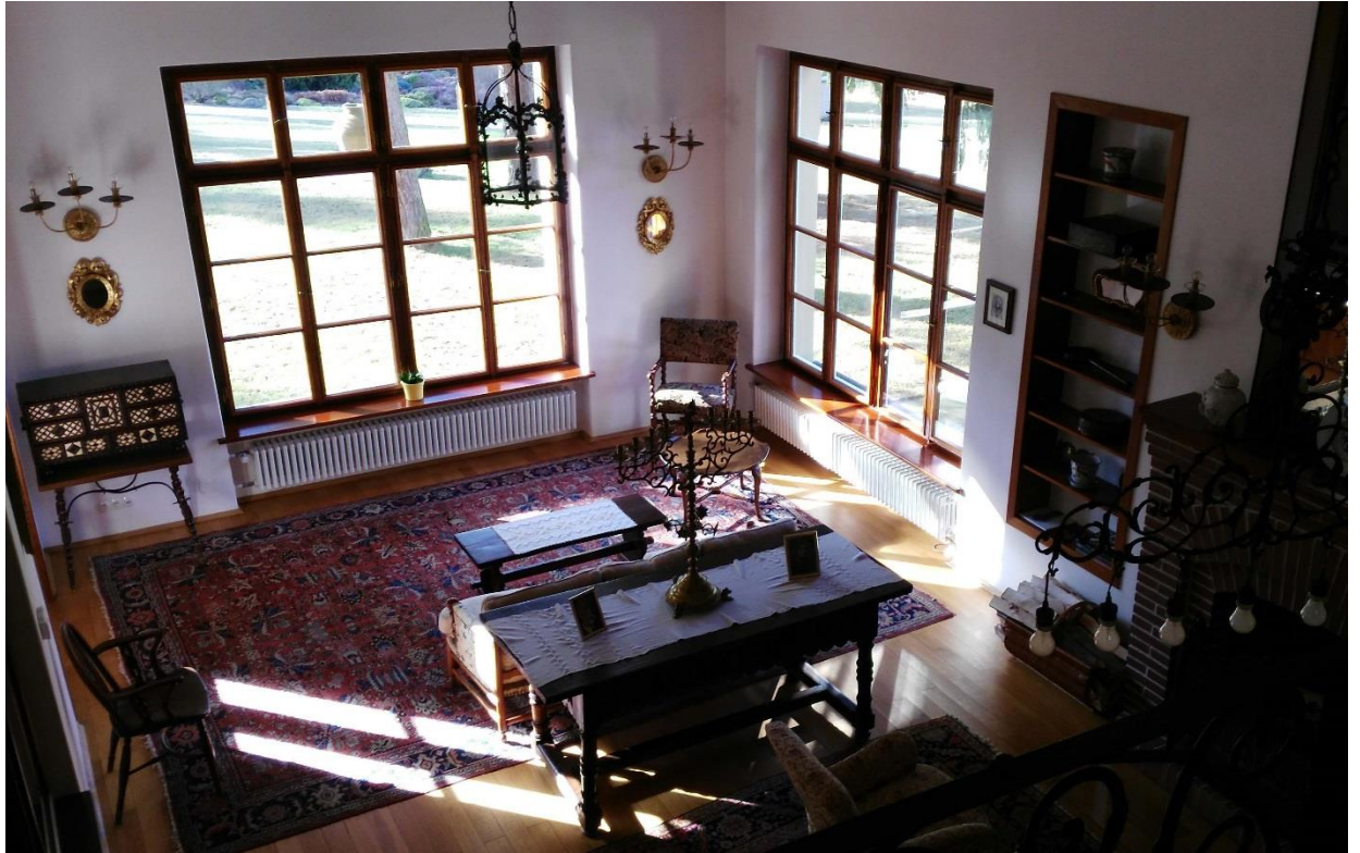
Obr. 15 - Společenská místnost