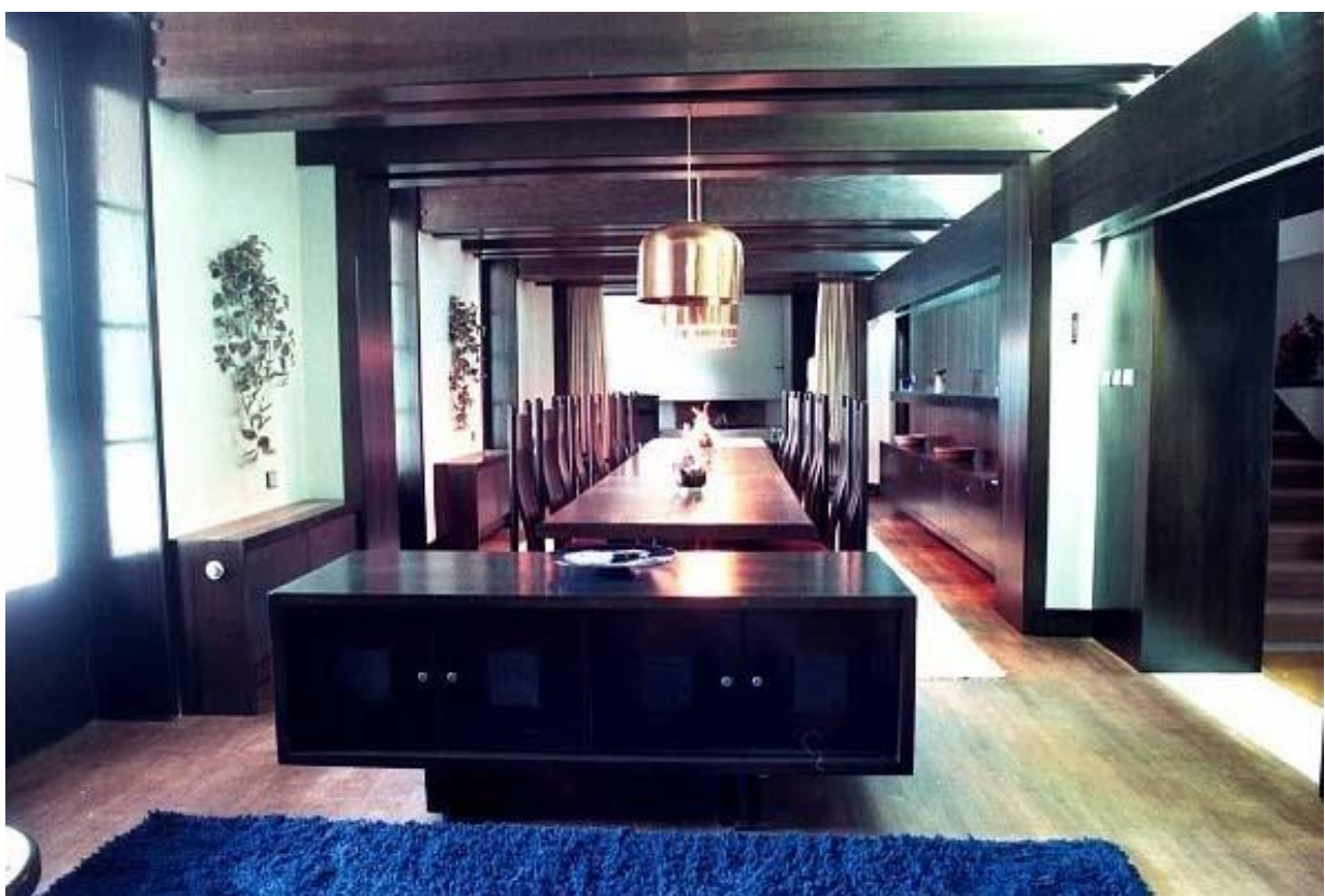
Obr. 17 – Přestavba jídelny Úřadem vlády v roce 1977