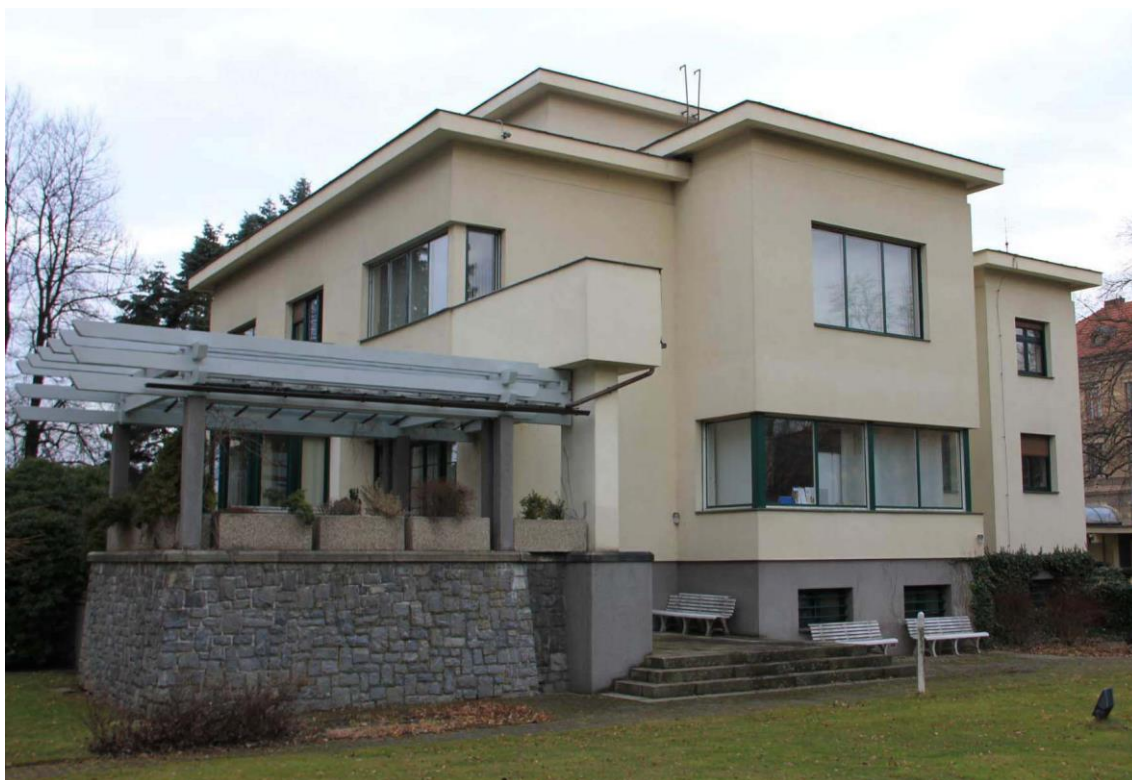
Obr. 24 - Zátkova vila (Husova 11, České Budějovice)