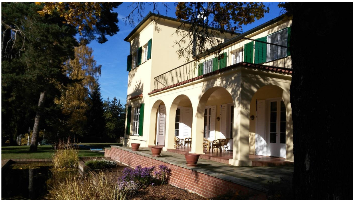
Obr. 14 - Arkádová lodžie vystavěná roku 1937