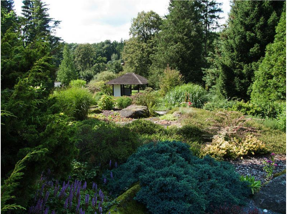
Obr. 5 - Jeden ze zahradních altánů