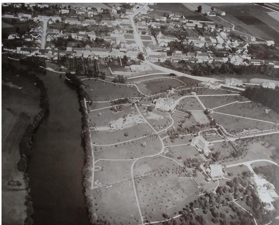
Obr. 2 - Letecký snímek z roku 1937