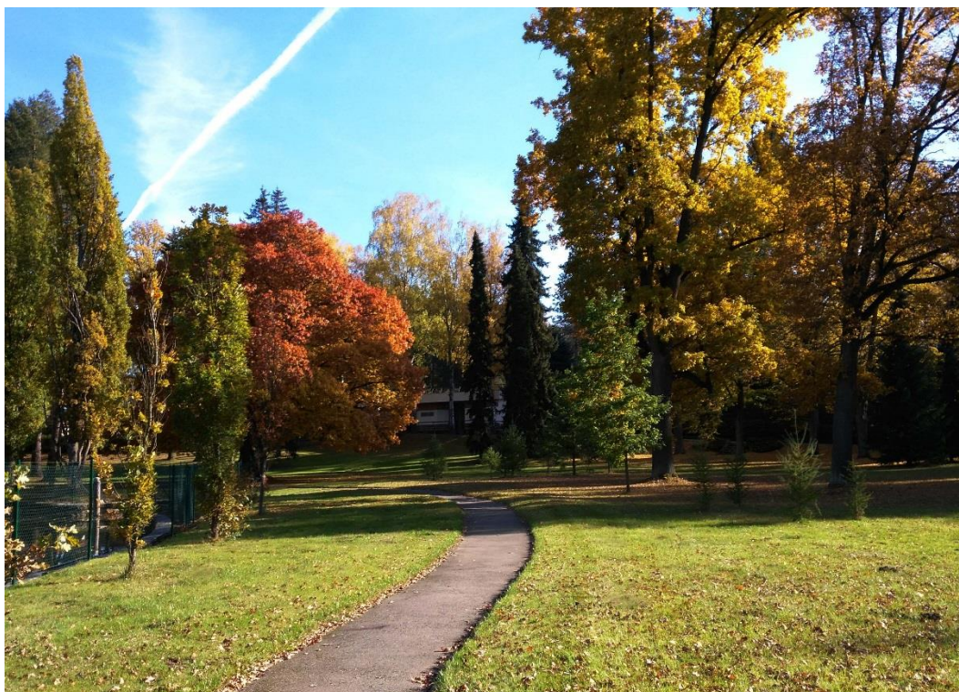
Obr. 3 - Spodní část zahrady u Kozského potoka