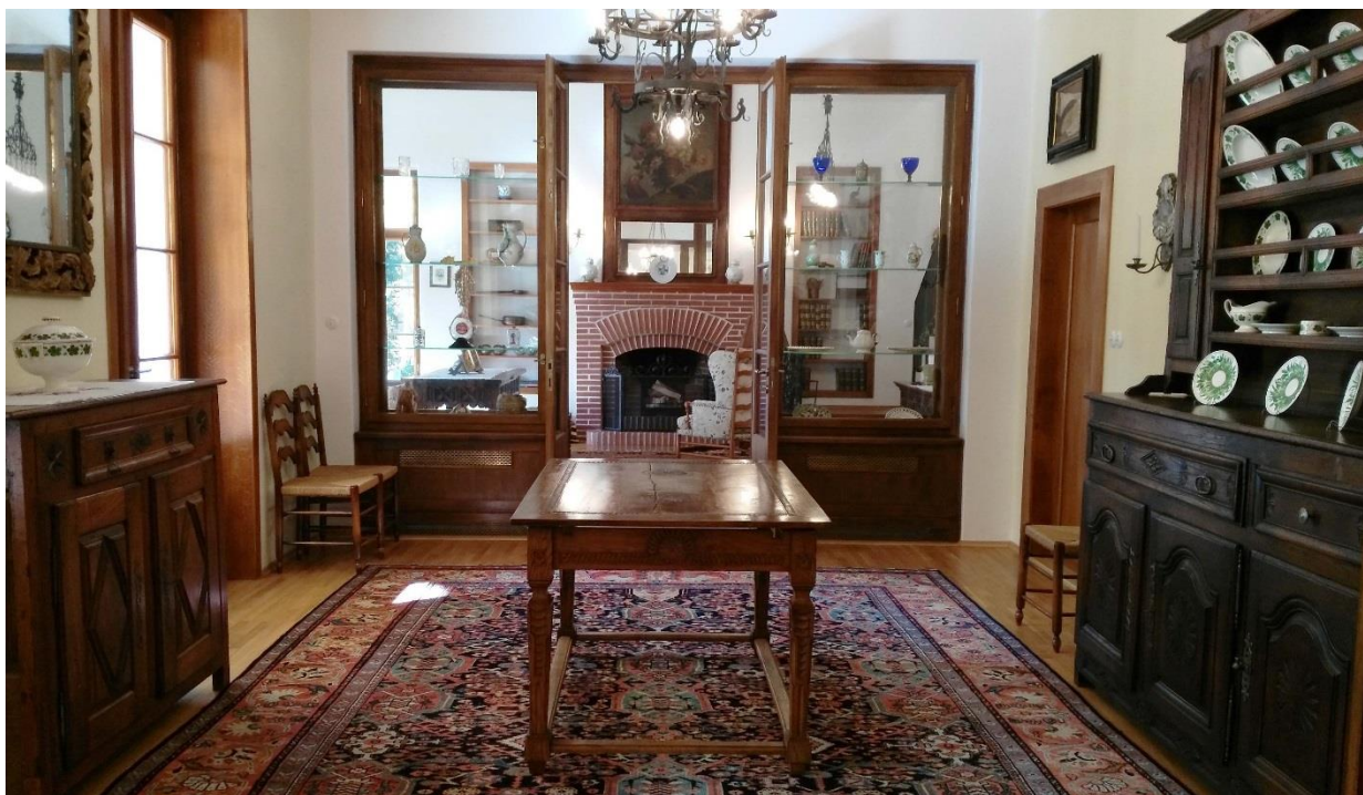
Obr. 16 - Interiér jídelny z roku 1931