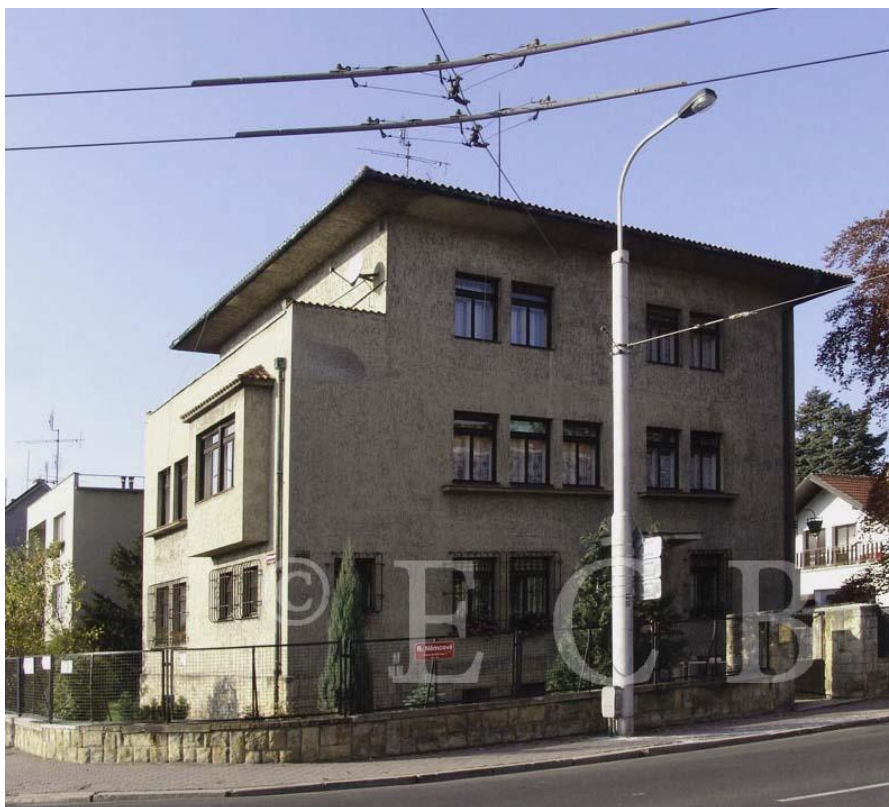
Obr. 26 - Vila Jana Příbrského (Boženy Němcové 52, České Budějovice)