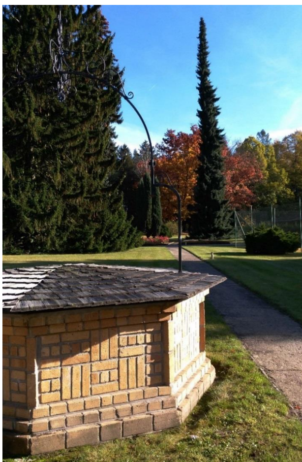
Obr. 4 - Pančičův smrk umístěný u tenisových kurtů