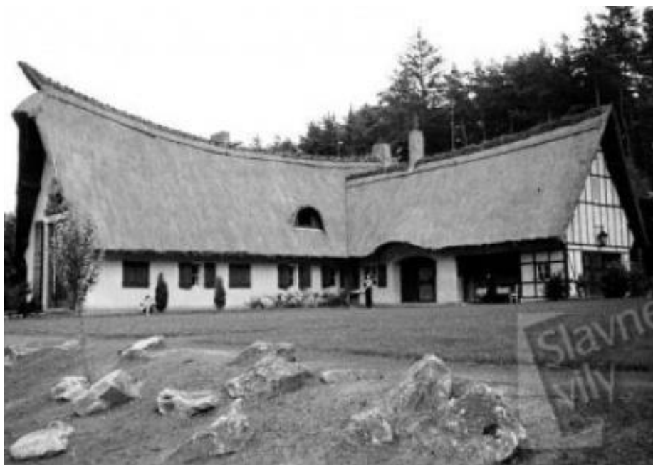
Obr. 22 - Vila Karla Lamače, architekt Jan Loskot