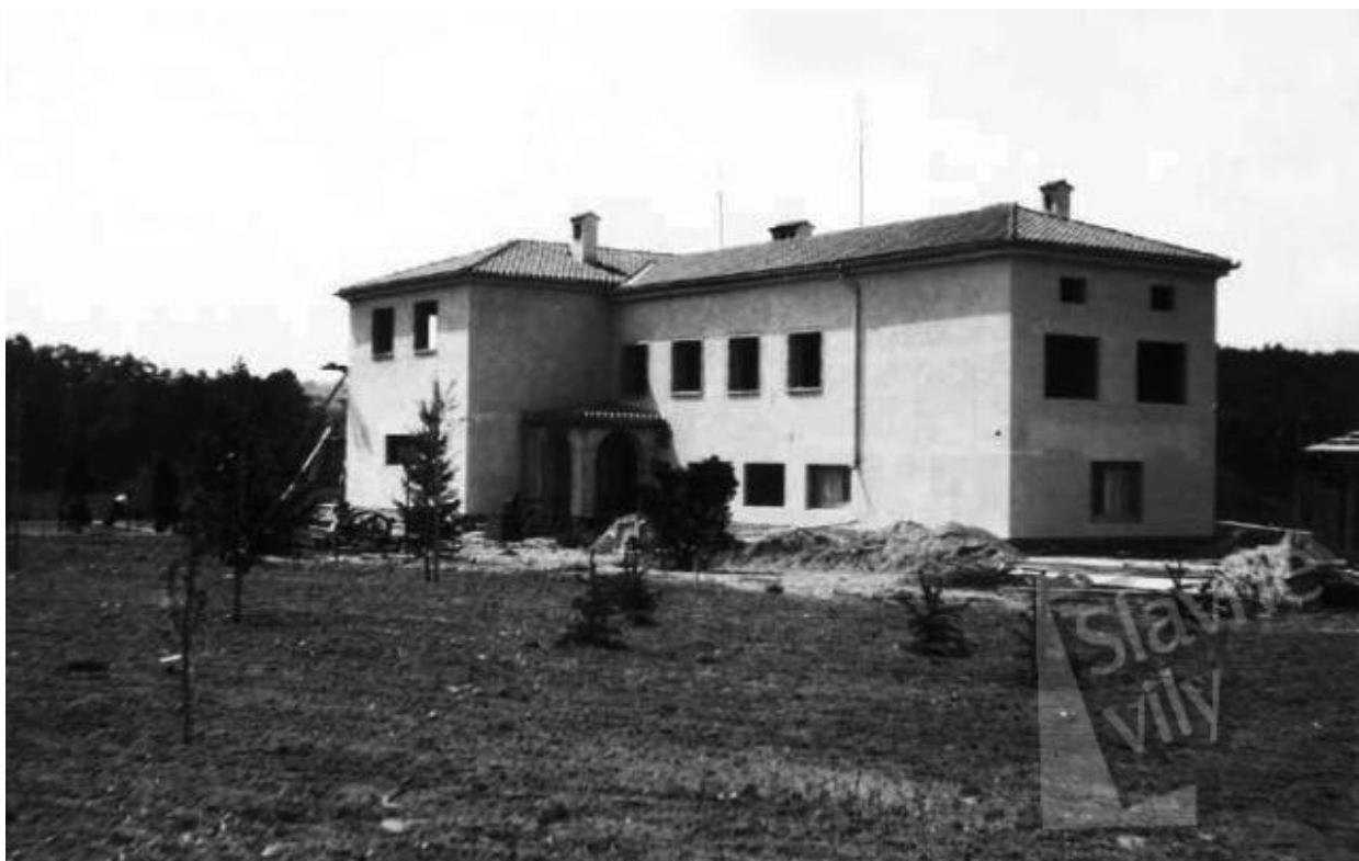
Obr. 9 - Výstavba Benešovy vily v roce 1931