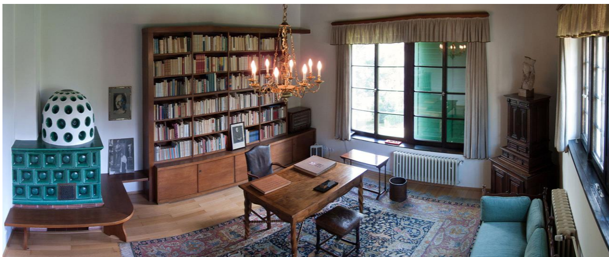
Obr. 18 - Benešova pracovna z roku 1931