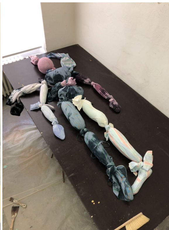
loutka , textil, polystyren, molitan, špendlíky, 190 x 190 cm, 2023