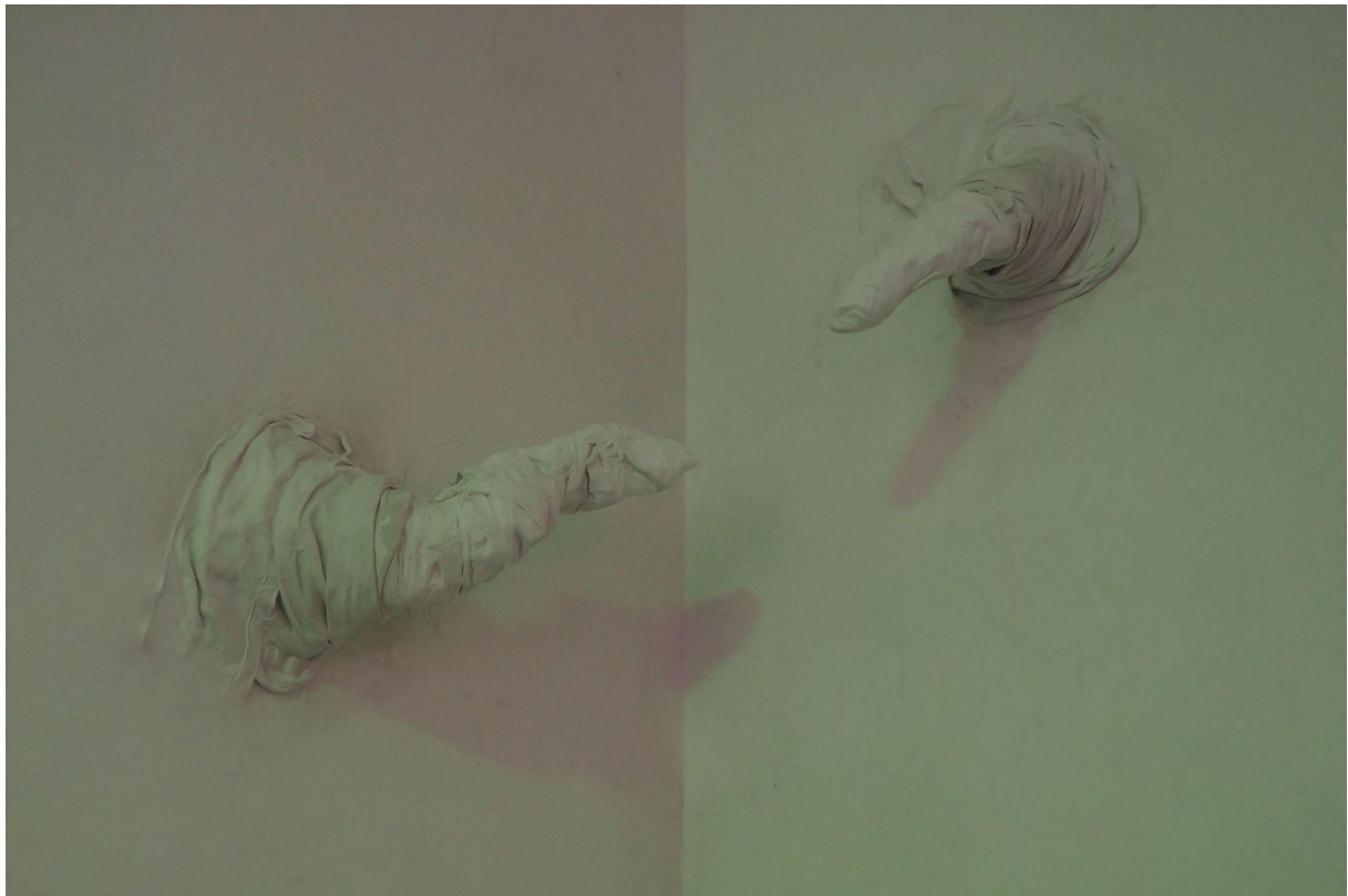
acting out of character, Galerie Průchod, Brno, 2022 textil, sádra, kov, různé velikosti

Při práci se složitým venkovním prostorem galerie Průchod jsem zohlednil specifika tohoto prostoru a zjednodušil formu postav, které byly souběžně vystaveny v galerii Zaazrak|Dornych. Chapadla jsou vytvořena z recyklovaného textilu, sádry a kovové sítě s tím, že poté, co jsem je připevnil podložkami a vruty, jsem je dále dotvořil dalšími kusy textilu se sádrou tak, aby jakoby vycházela ze stěny. Struktura textilu na chapadlech zůstává nezměněna, a já tak přetvářím stěny v galerii na morfující prostor, který dále mutuje a roste.