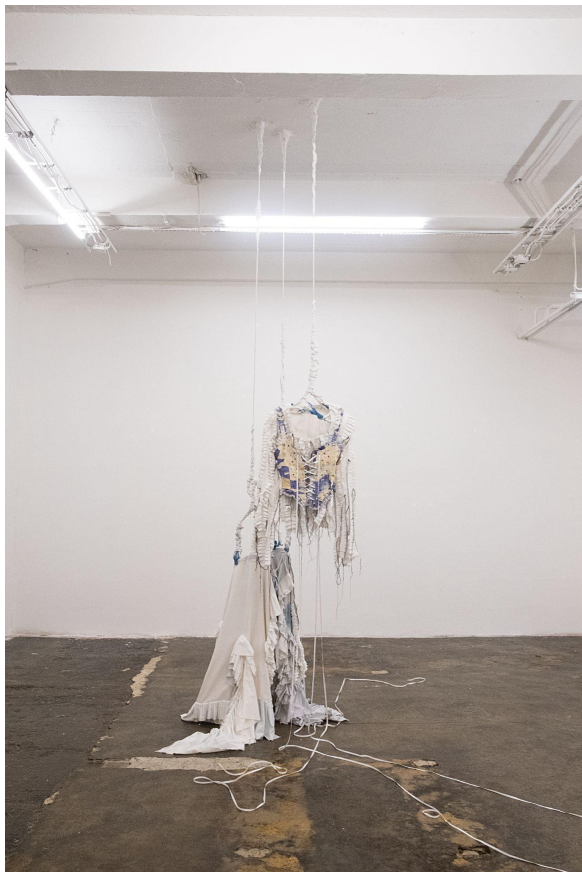
You are the one who steals foam and keeps it in their pocket , 123Gallery, Praha, 2022 textil, sádra, lano, 180 x 75 cm