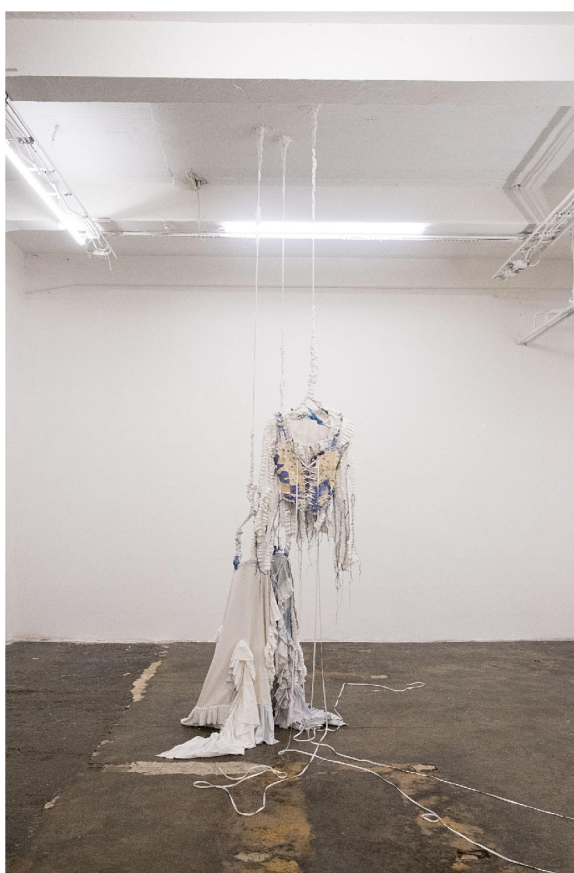
You are the one who steals foam and keeps it in their pocket , 123Gallery, Praha, 2022 textil, sádra, lano, 180 x 75 cm