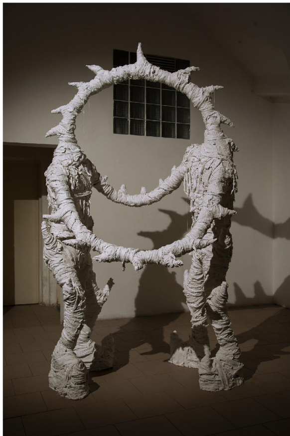
be mine and everything will be fine, Zaazrak|Dornych, Brno, 2022 textil, sádra, dřevo, kov, 195 x 130 cm