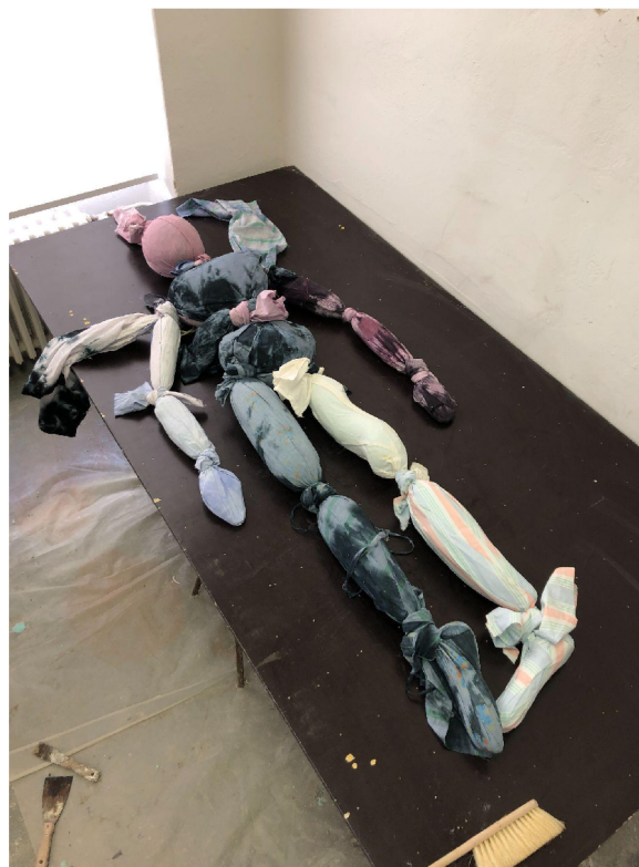
loutka , textil, polystyren, molitan, špendlíky, 190 x 190 cm, 2023