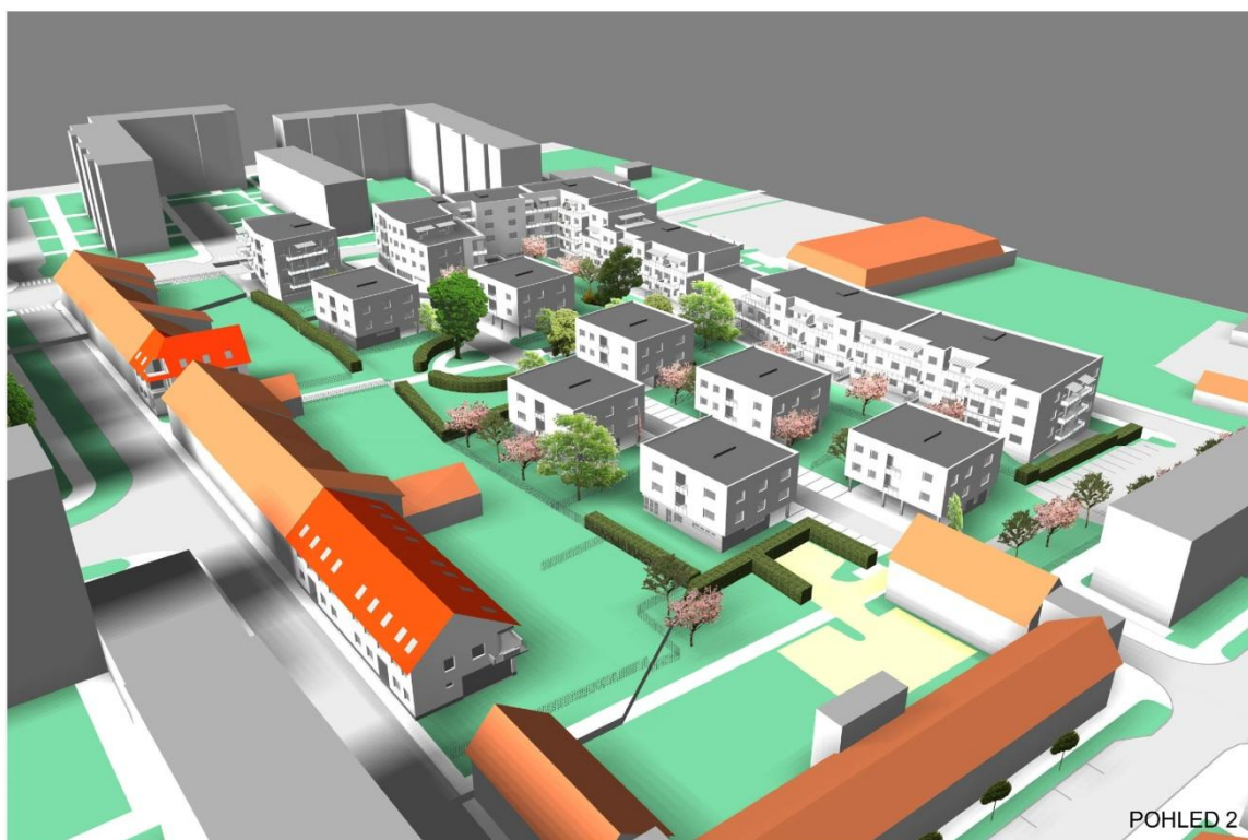
Obr. 11 – grafické znázornění návrhu zástavby sídliště Nové Město – Sever, vnitroblok 11 – 12 (Ateliér Zídka, architektonická kancelář, s.r.o.)

(Město Jičín. Regulační plán Jičín – Nové Město, lokalita Lidické náměstí – východ – právní stav po vydání změny č.1 : B4 – 1,2.jpg. [online], [cit. 2015-05-09], Dostupné z : https://www.mujiicin.cz/vismo/dokumenty2.asp?id_org=5954&id=1281585&n=regulacni-plan-jicin-nove-mesto-lokalita-lidicke-namesti-vychod-pravni-stav-po-vydani-zmeny-c-1&query=nov%C3%A9+m%C4%9Bsto+sever+B4 )