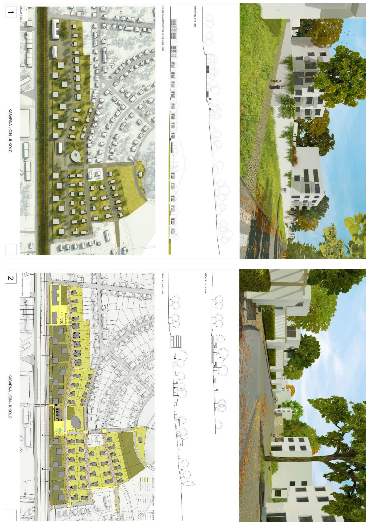
Obr. 10 – Vítězný návrh urbanisticko-architektonické soutěže Kasárna Jičín - CUBOID ARCHITEKTI s.r.o.

(Město Jičín. Soutěž Kasárna Jičín. [online], [cit. 2015-05-09], Dostupné z : https://www.mujiicin.cz/vysledky-souteze-kasarna-jicin/ds-29536/p1=58728