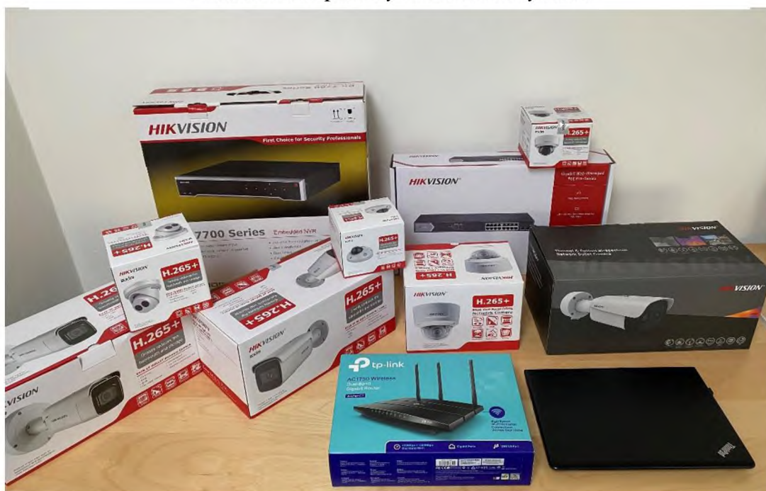
Obrázek 4 Komponenty kamerového systému

Sada testů byla zaměřena na co nejefektivnější využití zobrazování kamerových bodů s co nejmenším dopadem na datový tok a propustnost lokální datové sítě. Úzká souvislost datového toku hraje roli ve využití a množství ukládaných dat. V praktické části bylo testováno několik typů IP kamer s různými vlastnostmi. Dále nahrávací zařízení (NVR) s instalovaným pevným diskem pro uložení kamerových záznamů a zobrazovací zařízení formou počítače se softwarem pro dohled nad kamerovým systémem. V neposlední řadě bylo využito aktivních prvků sítě jako router a PoE switch. Testováním bylo možné zjistit vhodnost provozování a zobrazování kamerových systémů nejen na nově vybudovaných lokálních datových sítích, ale i na stávajících síťových infrastrukturách. Moderní kamery s větším rozlišením přenášejí větší množství dat. Tyto data jsou distribuována pomocí lokální sítě k ostatním zařízením jako nahrávací zařízení nebo počítač s dohledovým SW.