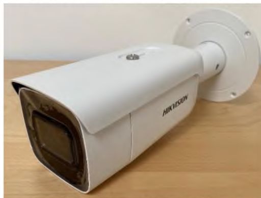
Obrázek 8 IP kamera DS-2CD2685FWD-IZS(2.8-12mm)(B)