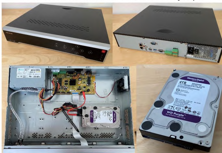
Obrázek 5 Nahrávací zařízení DS-7716NI-K4 s pevným