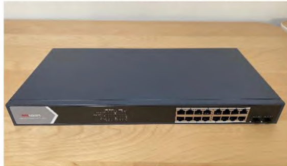
Obrázek 7 PoE Switch DS-3E1518P-E