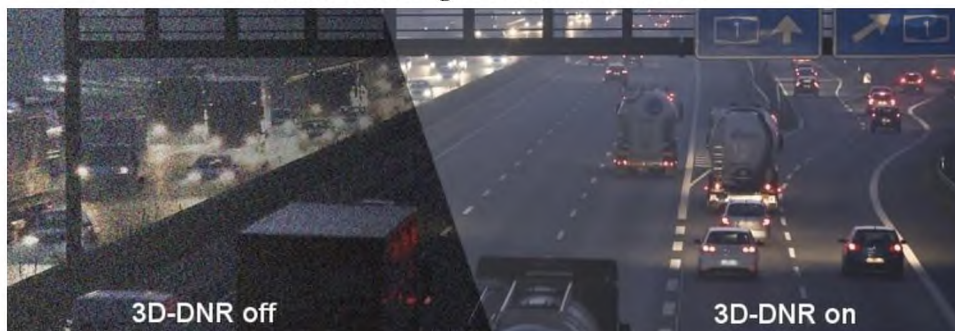
Obrázek 2 Digitální redukce šumu

Digitální redukce šumu – o šumu při monitorování lze mluvit pokaždé, když dochází k náhodně vyskytujícímu se narušení obrazu například – změny jasu, barev, pixelů. K tomuto dochází velmi často v případě špatného osvětlení, neodpovídající citlivosti atd. V současné době se tomuto předchází pomocí 2 D (2D-DNR) či 3D (3D-DNR) technologie redukce šumů viz. obr. 2. (6) (15)