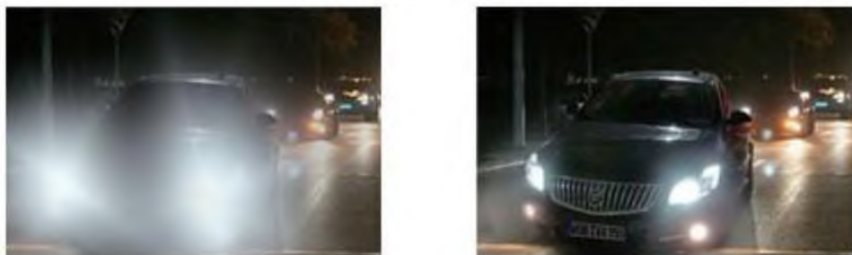
Obrázek 1 Kompenzace protisvětla

Kompenzace protisvětla – tato funkce je vytvořena k detekování zdroje protisvětla (například rozsvícené reflektory) a ty pak eliminovat tak, aby byly viditelné i tmavé aspekty obrazu (RZ automobilu) viz. obr. 1. (13)