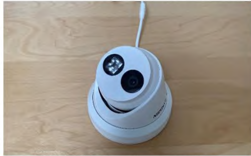
Obrázek 10 IP Kamera DS-2CD2385FWD-I(4mm)