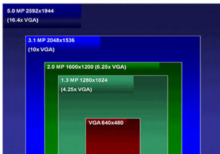
Obrázek 3 Rozlišení

Rozlišení – tento základní parametr udává, jakou rozlišovací schopnost má snímací čip. Analogové kamery využívají obrazový formát PAL (704x576 obrazových bodů) viz. obr. 3. Oproti tomu IP kamery jsou omezeny pouze možnostmi dané technologie. (6)