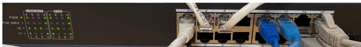
Obrázek 17 Zapojení portů RJ-45 v PoE switchi

Celkové zapojení testovacího polygonu z pohledu sítě proběhlo následovně. Z prvního síťového portu routeru byl veden patch kabel do PoE switche portu 12. Z druhého síťového portu routeru byl veden patch kabel do počítačového klienta. Nahrávací zařízení bylo propojeno patch kabelem z prvního síťového portu do PoE switche portu 10. Kamery 1–7 byly propojeny pomocí síťových portů RJ-45 patch kabelem do PoE switche portů 1, 2, 4, 6, 13, 15 a 16 viz. obrázek č. 17.