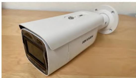
Obrázek 11 IP kamera DS-2CD2643G1-IZ(2.8-12mm)