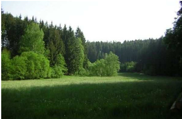
Obr. 11. Balinské údolí

Celkové plánované výdaje projektu byly 580 000 Kč. Pokrytí z 92,5 % dotace a 7,5 % vlastní zdroje. Skutečné výdaje činily 579 694 Kč. Pokrytí z 90,8 % dotace a 9,2 % vlastní zdroje.