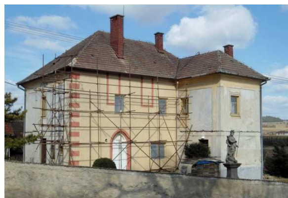
Obr. 15. Fara v Tasově po opravě

http://m.kr-vysocina.cz/vismo5/dokumenty2.asp?id_org=450008&id=4021697&n=tasov-areal-fary&p1=1121