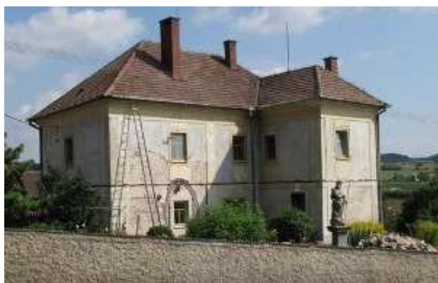
Obr. 14. Fara v Tasově před opravou

Celková výše příspěvků na zachování a obnovu kulturních památek z programu ve správním obvodu ORP Velké Meziříčí v roce 2014 činila 571 000 Kč, z toho 310 000 Kč na obnovu jižní gotické fasády fary v Tasově (obr. 14) a další související práce. 261 000 Kč na obnovu krovu sýpky ve Velkém Meziříčí a další související práce.