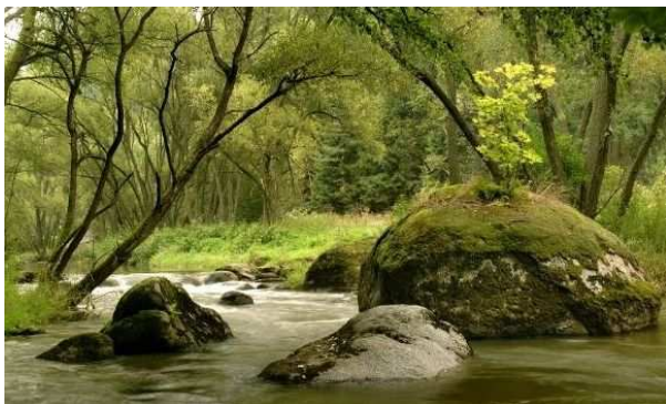
Obr. 16. Nesměřské údolí

http://www.mestovm.cz/cs/fotogalerie?func=viewcategory&catid=110