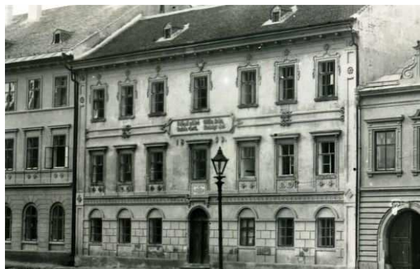
Obr. 4. Obecná škola

http://www.mestovm.cz/cs/fotogalerie?func=viewcategory&catid=97