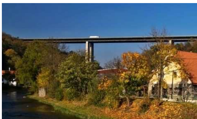
Obr. 1. Dálniční most 2014

Územím kraje procházejí důležité železniční i dopravní spoje. Ty mají převážně celostátní význam, méně je však zajištěno přímé vnitrokrajské spojení důležitých center (s výjimkou Jihlava – Havlíčkův Brod). V poslední době se rozšířilo budování obchvatů na silnicích I. třídy (Jihlava, Havlíčkův Brod, Pelhřimov). Hlavní význam má dálnice D1, s nejdelším mostem na dálnici D1 (obr. 1), která vede přímo u Velkého Meziříčí. Není však zajištěno přímé silniční spojení mezi Jihlavou a druhým největším městem kraje Třebíčí. A Žďár nad Sázavou ani Pelhřimov nemají s Jihlavou přímé spojení.