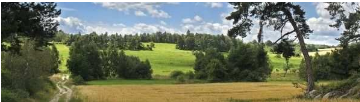
Obr. 10. Pohled na krajinu v okolí Velkého Meziříčí

http://www.mestovm.cz/cs/fotogalerie?func=viewcategory&catid=132