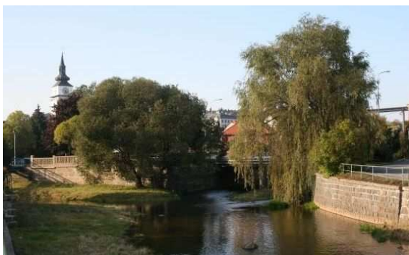
Obr. 5. Soutok řek Balinky a Oslavy

venkova už nepracuje v tradičních ekonomických aktivitách spjatých s přírodními zdroji a mnoho z nich dojíždí do práce do měst.