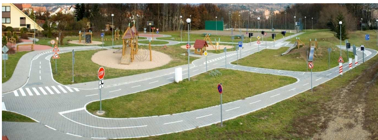
Obr. 13. Dětské dopravní hřiště

Celkové výdaje projektu činily 6 526 321 Kč, z toho činila výše dotace 4 438 876 Kč a vlastní zdroje 2 087 445 Kč.