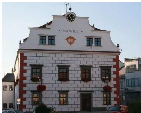
Obr. 7. Radnice 2014