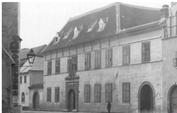
Obr. 3. Pivovar

Trh práce ve venkovských obcích je oproti trhu práce městského prostoru velmi specifický. Venkov, resp. venkovské obce, které v České republice výrazně dominují, bývaly tradičně spojovány se zemědělskou výrobou. Zemědělství však již není dominantním sektorem ve venkovském prostoru. Buchta (2009) uvádí, že životní podmínky obyvatel a udržitelnost hospodářského života ve venkovských oblastech jsou do značné míry ovlivněny přítomností zemědělství a jeho ekonomický výkon. Obecně platí, že budoucnost venkovských oblastí bude záviset na ekonomické restrukturalizaci a na potenciálu pro vytváření pracovních příležitostí ve venkovských oblastech obyvatelstva. Pissarides (1990) uvádí, že hlavní myšlenkou na trhu práce je, že obchod je decentralizovaná ekonomická aktivita, která je nekoordinovaná, časově náročná a drahá. Cestou, jak zvýšit počet a pestrost pracovních míst na venkově, je snaha o diverzifikaci venkovské ekonomiky tak, aby bylo dosaženo vyváženého a stabilního sociálně – ekonomického rozvoje. Před první světovou válkou byla tradičním průmyslovým odvětvím ve Velkém Meziříčí textilní výroba. Vedle podniků bylo ve městě značné množství menších živnostenských provozoven. Na dobové fotografii je vidět bývalý pivovar (obr. 3) a obecná škola (obr. 4).