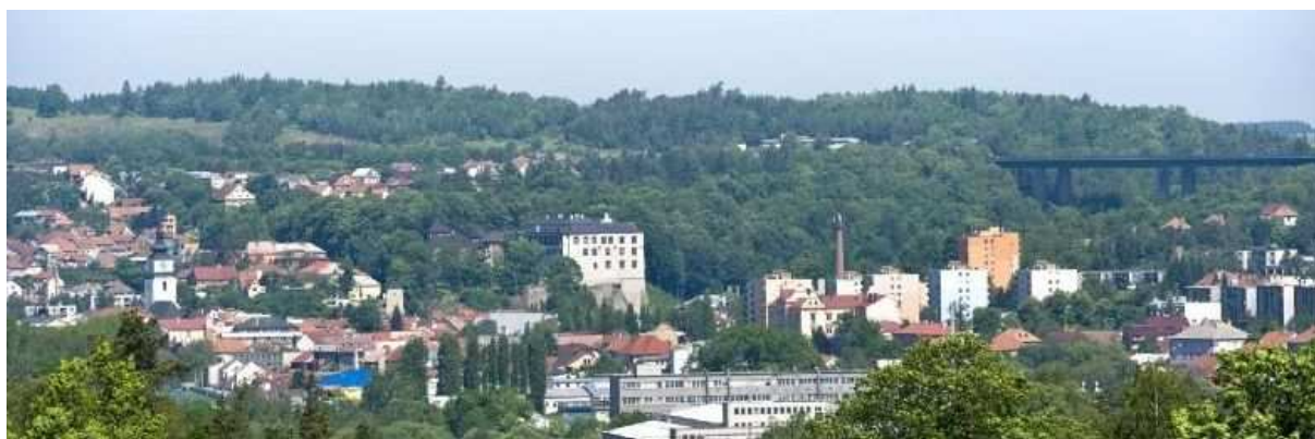
Obr. 9. Pohled na město Velké Meziříčí

Hlavními zaměstnavateli jsou stovky malých živností a živnostníků s jedním či dvěma zaměstnanci. Obchody, obchůdky a služby jsou těžiště zaměstnanosti v každém malém městě. V poslední době trápí Velké Meziříčí (obr. 9) dvě vážné věci. Na okraji města vznikly některé velké podniky i velké nákupní zóny. Zdali to všichni ti, kdo mají své provozovny v centru, ustojí, to je první věc, kterou se zabývá. Druhou věcí je rozvoj centra města za řekou, do areálu bývalého Svitu. Město chce, aby zde vzniklo něco pro příští generace, co bude důvodem k hrdosti, ale zároveň to naváže na historické centrum města právě i s ohledem na zaměstnanost, živnosti a služby (Necid, 2014).