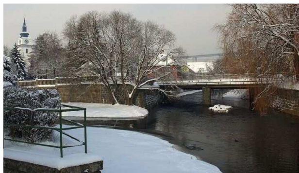
Obr. 6. Soutok řek v zimě

http://www.mestovm.cz/cs/fotogalerie?func=viewcategory&catid=23