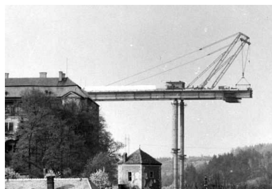
Obr. 2. Dálniční most 1977

http://www.mestovm.cz/cs/fotogalerie?func=viewcategory&catid=23&start=30