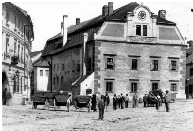
Obr. 8. Radnice 1932