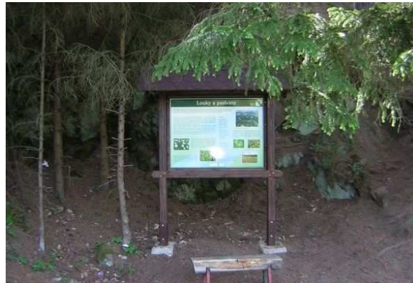
Obr. 12. Naučný panel v Balinském údolí

http://www.mestovm.cz/cs/fotogalerie?func=viewcategory&catid=109