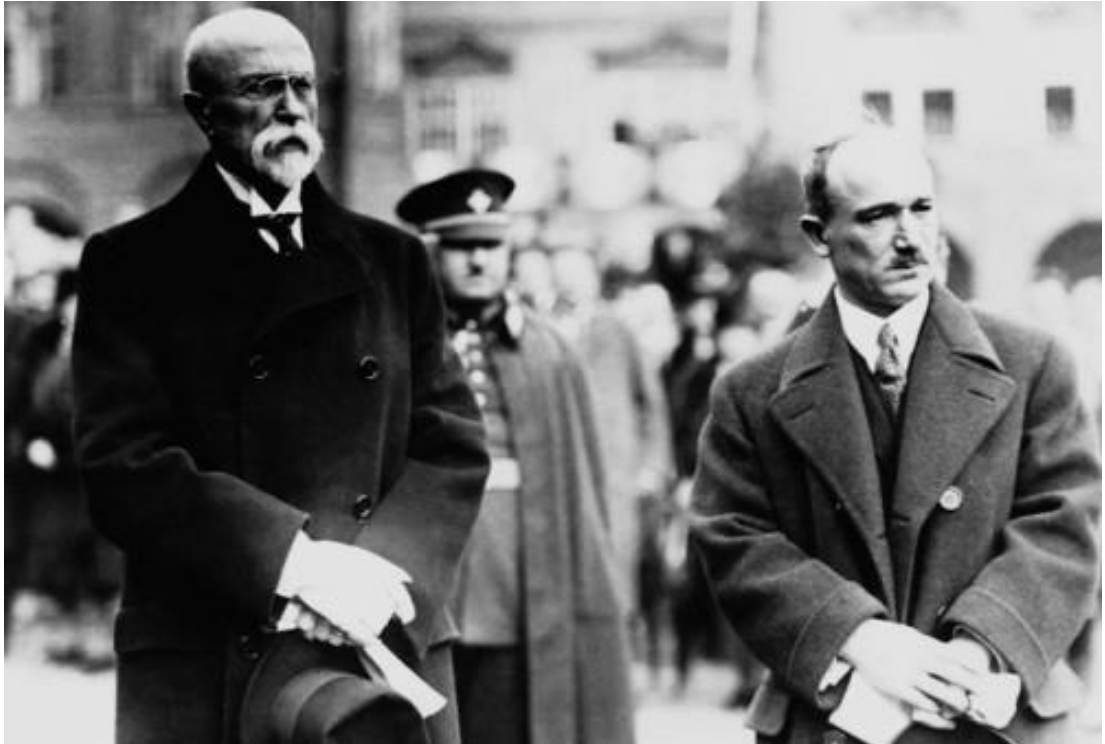
Tomáš Garrigue Masaryk a Edvard Beneš