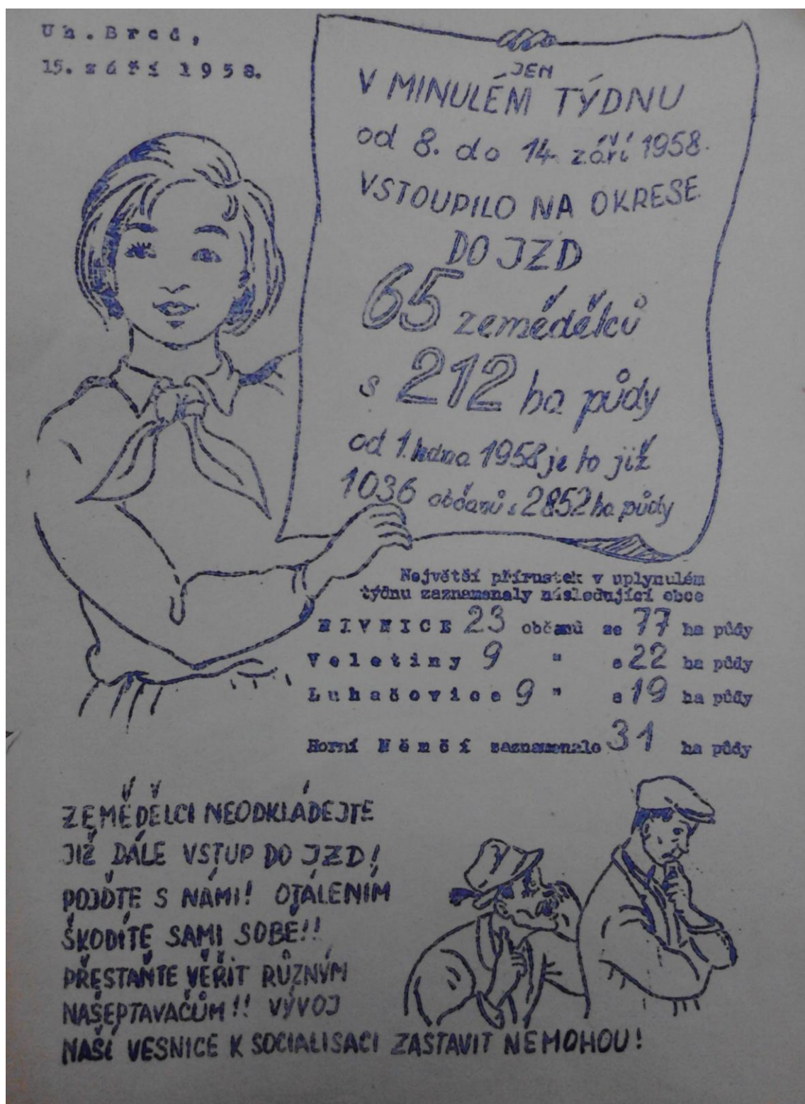
Obr. č. 3 – Propagační leták 67