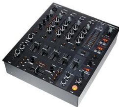
Obr.č.2 – mixer