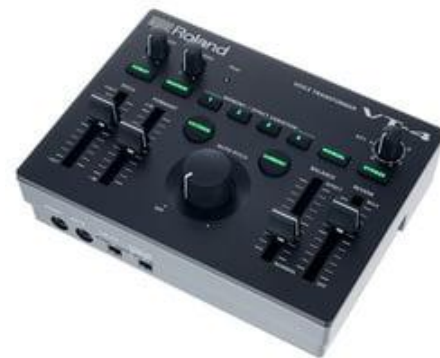
Obr.č.3 – sampler