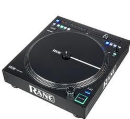
Obr.č.1 – turntable

Djing neboli deejaying je základní formou vytváření hip-hopové hudby. Dj je zkratkou pro člověka, který pracuje s technikou jako jsou dva i více turntables , mixer a sampler .