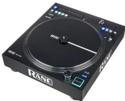
Obr.č.1 – turntable

Djing neboli deejaying je základní formou vytváření hip-hopové hudby. Dj je zkratkou pro člověka, který pracuje s technikou jako jsou dva i více turntables , mixer a sampler .