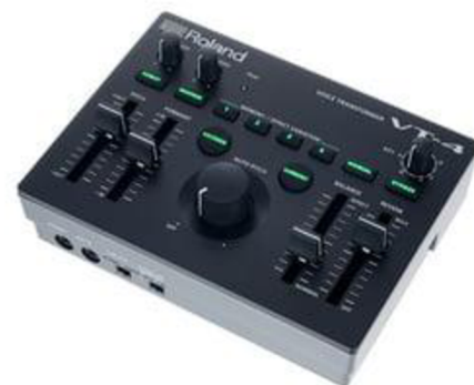
Obr.č.3 – sampler