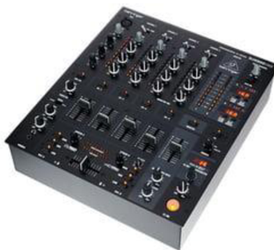
Obr.č.2 – mixer