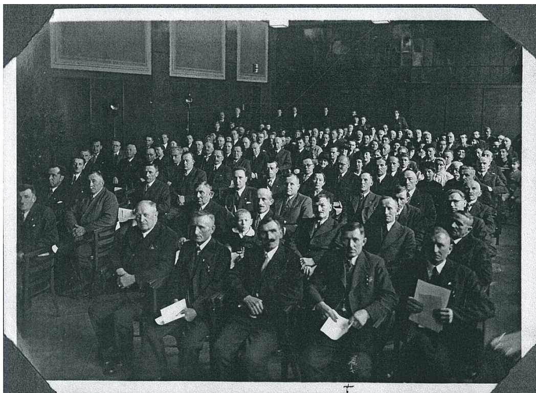
Obr. 2: Ocenění starých selských rodů roku 1940 v Praze.