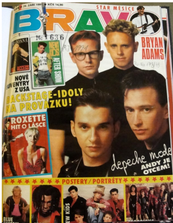
Příloha č. 15