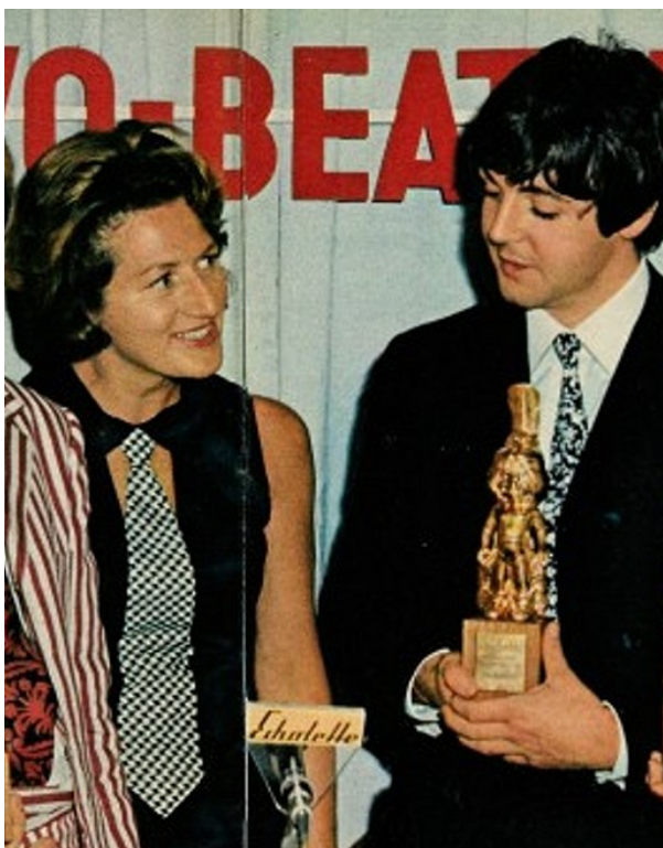
Příloha č. 11