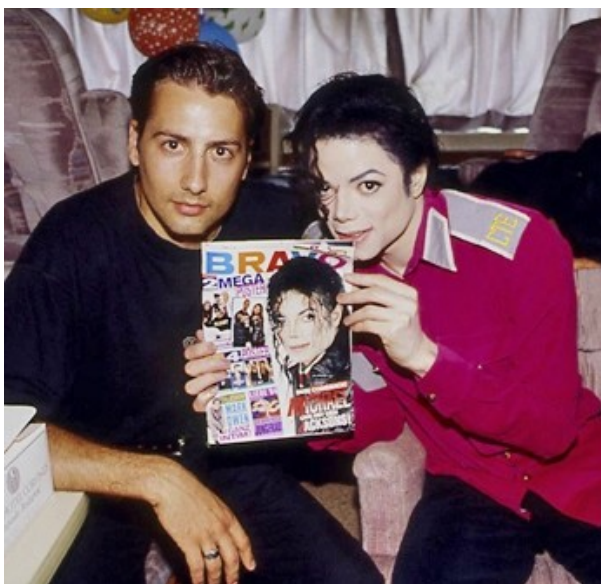
Příloha č. 13