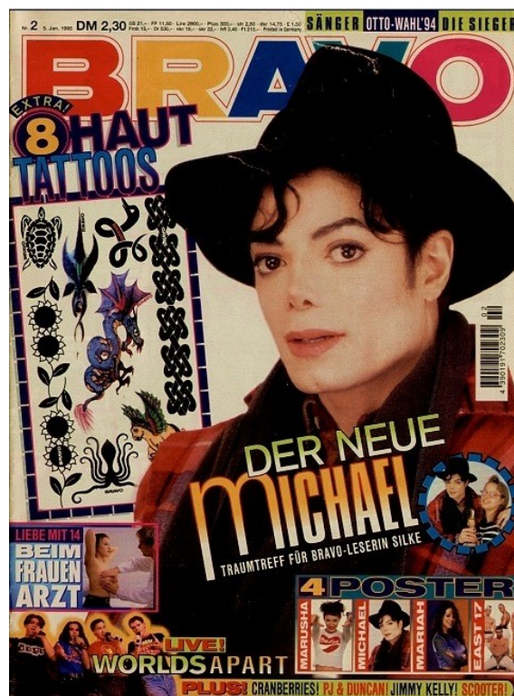
Příloha č. 12