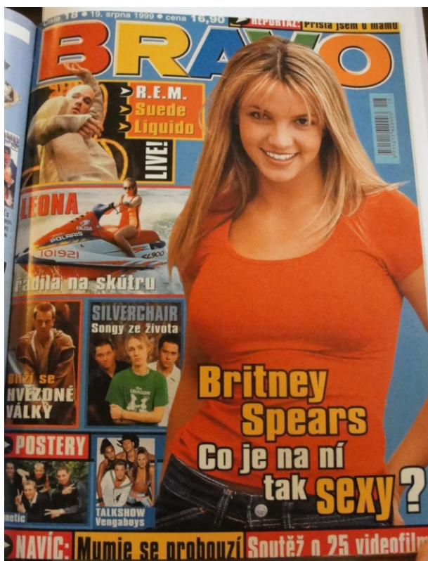
Příloha č. 18