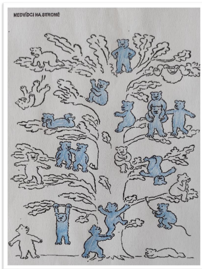
Obrázek 1: Nejčastější vnímání svého místa ve třídě u dětí