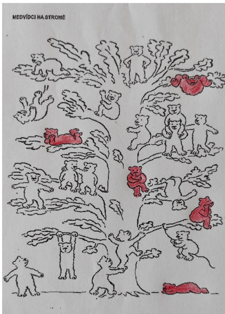
Obrázek 2: Tomášovo postavení ve třídě (nejčastější znázornění)