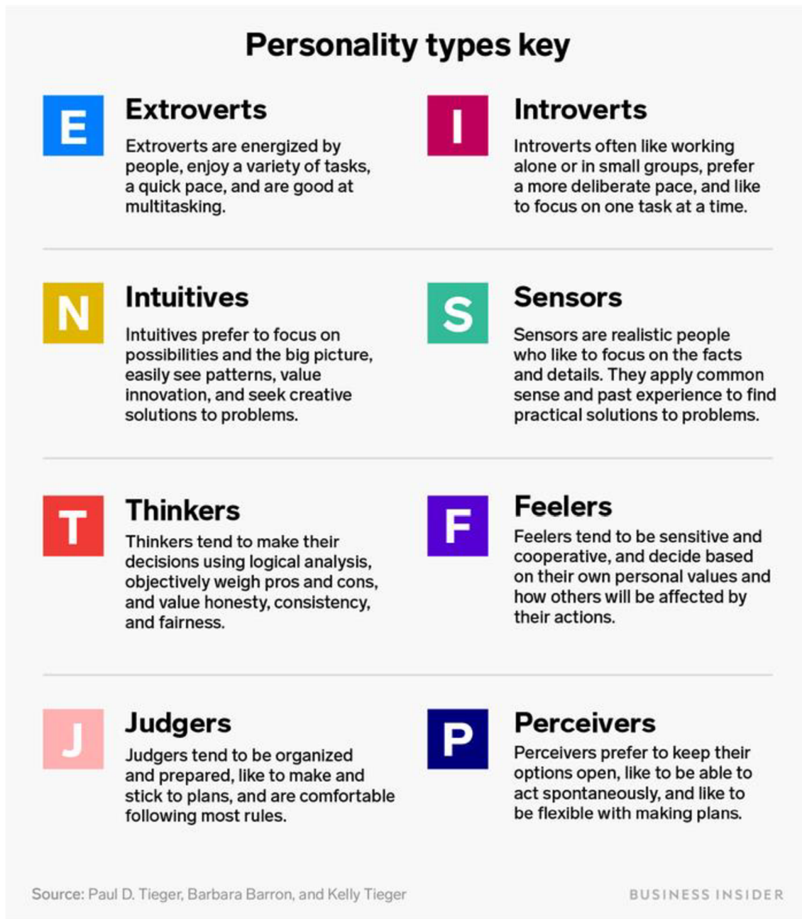
Obrázek 2: Osy typů MBTI (z webové stránky www.businessinsider.com )

faktorů, ale její definicí to není. The Myers-Briggs Company ji na svých webových stránkách označuje za osu popisující, jak se lidé vyrovnávají se světem, „How you deal with world“ 38 .