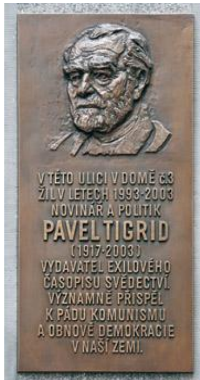
Obrázek 1: Pamětní deska Pavla Tigrida v Praze

Zdroj: Židovské muzeum v Praze, online, cit. 27-01-14 46