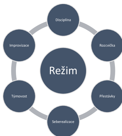
Obrázek č. 3: Zobrazení kategorie a kódů v režimu v zájmovém útvaru

Na základě analýzy rozhovorů s respondenty jsem sestavila kategorii režim v zájmovém útvaru, do které jsem stanovila následující kódy. K obrázku č. 3 se vztahují otázky č. 6 – 8.