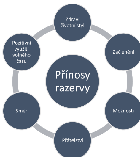
Obrázek č. 6: Zobrazení kategorie a kódů v přínosech a rezervách

Na základě analýzy rozhovorů s respondenty jsem sestavila kategorii přínosy a rezervy, do které jsem stanovila následující kódy. K obrázku č. 6 se vztahují otázky č. 15 – 19.