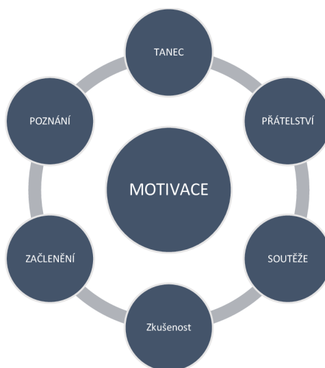
Obrázek č. 2: Zobrazení kategorie a kódů motivace účastníků zájmového útvaru a jejich taneční zkušenosti

Na základě analýzy rozhovorů s respondenty jsem sestavila kategorii motivace, do které jsem stanovila následující kódy. K obrázku č. 2 se vztahují otázky č. 3 – 5.