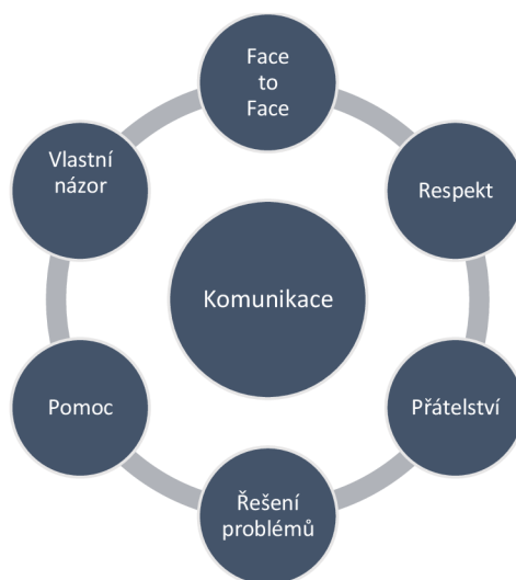
Obrázek č. 4: Zobrazení kategorie a kódů v Komunikaci

Na základě analýzy rozhovorů s respondenty jsem sestavila kategorii komunikace, do které jsem stanovila následující kódy. K obrázku č. 4 se vztahují otázky č. 9 – 12.