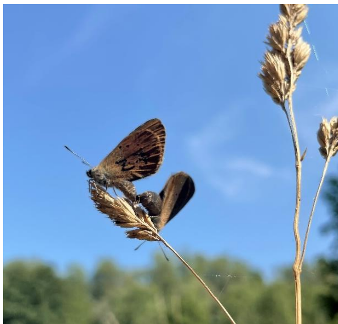
Obrázek č.3: Kopulující jedinci Phengaris nausithous (na snímku označený jedinec)