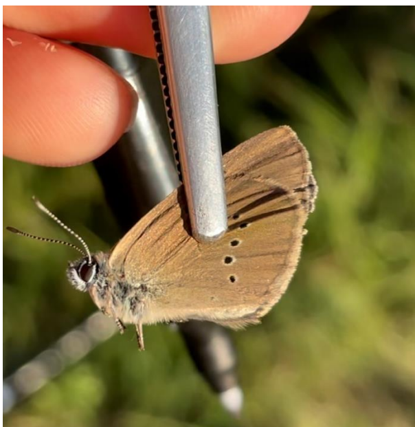
Obrázek č. 5: Jedinec Phengaris nausithous fixovaný v pinzetě