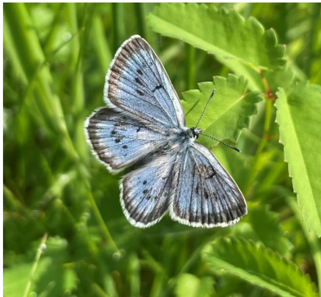
Obrázek č. 1: Samec druhu Phengaris teleius

larvy se vyvíjejí na hořci hořepníku ( Gentiana pneumonanthe ) a druhou formou je taktéž ohrožený, modrásek hořcový Rebelův – Phengaris alcon f. rebelli (Hirschke, 1904), který se vyvíjí na hořci křížatém ( Gentiana cruciata ). Dalším z rodu Phengaris vyskytujícím se na našem území je modrásek černoskvřnný – Phengaris arion (Linnaeus, 1758), jehož živnou rostlinou je mateřídouška časná ( Thymus praecox ). Poslední dva modrásci, oba dva obývající podobné habitaty a to především z důvodu výskytu jediné živné rostliny – krvavce totenu ( Sanguisorba officinalis ), jsou: modrásek očkovaný – Phengaris teleius (Bergsträsser, 1779) označen v IUCN Červeném seznamu ohrožených druhů jako zranitelný (VU) a modrásek bahenní – Phengaris nausithous (Bergsträsser, 1779), který je studovaným druhem v této práci (Hejda et al. 2017).