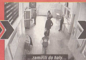
...zamířili do haly...

„Během deseti dnů se dopustili třinácti loupeží, krádeží a vloupání, a to společně, ve dvou i jednotlivě. Oba nezletilí ale nejsou trestně odpovědní, stihání uniknou,“ dodala Střelcová. Násilníci se vrátí do výchovného ústavu. Jana Ulrichová