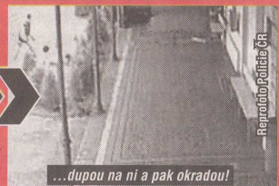
...dupou na ni a pak okradou!