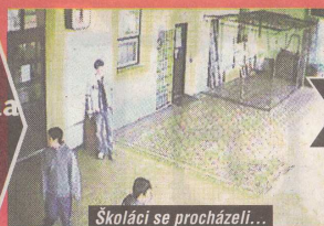
Školáci se procházeli...

Neděle 6. dubna Nádraží Louny 17.10 – 17.15