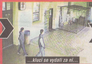
...kluci se vydali za ní...

„Během deseti dnů se dopustili třinácti loupeží, krádeží a vloupání, a to společně, ve dvou i jednotlivě. Oba nezletilí ale nejsou trestně odpovědní, stihání uniknou,“ dodala Střelcová. Násilníci se vrátí do výchovného ústavu. Jana Ulrichová