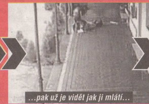
...pak už je vidět jak ji mlátí...