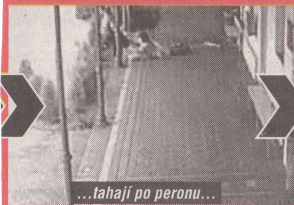
...tahají po peronu...