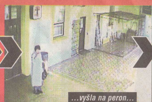
...vyšla na peron...