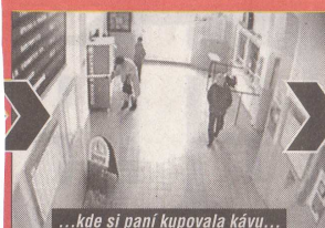
...kde si paní kupovala kávu...