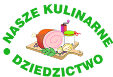
Obrázek 4 Nasze kulinarne dziedzictwo (Ministerstwo Rolnictwa i Rozwoju Wsi, 2013)

V Polsku je také několik organizací, které se zabývají tematikou regionálních produktů, např.: Nasze kulinarne dziedzictwo, (NKD) Polska izba produktu regionalnego i lokalnego, Lista produktów produktów tradycyjnych Ministerstwa Rolnictwa i Rozwoju Wsi.