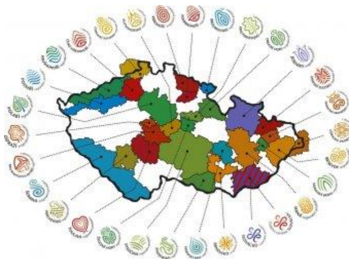
Obrázek 1 Regionální značení v České republice (Asociace regionálních značek, 2024)