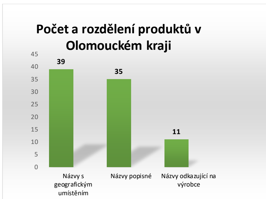
Obrázek 13 Počet a rozdělení produktů v Olomouckém kraji