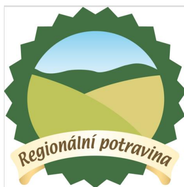
Obrázek 11 Logo – Regionální potravina (Státní zemědělský intervenční fond, 2024)

BIO – Produkt ekologického zemědělství Tento pojem označuje například potraviny, které splňují normy ekologického zemědělství. Bio je certifikovaný způsob hospodaření, podložený národní i evropskou legislativou a kontrolovaný speciálním systémem, za který odpovídá stát. Ekologické zemědělství, známé jako bio, se zakládá na rozmanitém osevním postupu a péči o půdu bez použití pesticidů, chemických postřiků, umělých hnojiv nebo geneticky modifikovaných organismů. Toto označení se vztahuje také chov zvířat, která jsou chovaná šetrným způsobem v přívětivém prostředí. (Státní zemědělský intervenční fond, ministerstvo zemědělství, 2024).