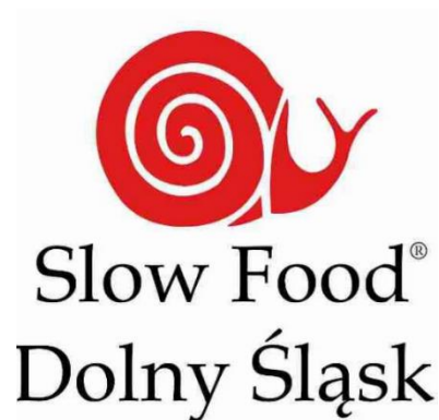
Obrázek 12 Logo Slow Food (Slow Food International, 2024)

Mezi označeními fungující v Polsku patří např. organizace Slow Food Dolny Śląsk , jejímž logem se stal červený hlemýžď, jedná se o mezinárodní síť neziskovou organizací Slow Food International., která se zaměřuje na nekomerční, vzdělávací a prosociální aktivity. Tato organizace existuje již od 1986 roku a byla založena v Itálii s cílem chránit autentické místní chutě, spojovat spotřebitele, propojovat malé regionální výrobce, ale také kuchařská a zemědělská řemesla. Tato organizace je také financována Evropskou unií (Slow Food Dolny Śląsk, 2024).