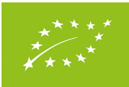
Obrázek 8 Logo EU označující ekologické produkty (Evropská komise, 2024)

Tímto logem jsou opatřeny výrobky pocházející z Evropské unie. Tyto pak musí být také označený biolistem, číselným kódem kontrolní organizace a musí obsahovat původ surovin. Kód by potom vypadal následovně: CZ-BIO-001. Zde se může uvádět ve formátu EU, nebo mimo EU společně s názvem země, ve které byly vyprodukovány všechny použité suroviny (Akademie kvality, 2024).