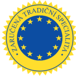
Obrázek 7 Zaručená tradiční specialita (Evropská komise, 2022)

mezi ně patří Český kmín, Pohořelický kapr či Žatecký chmel (Státní zemědělský intervenční fond, 2024).