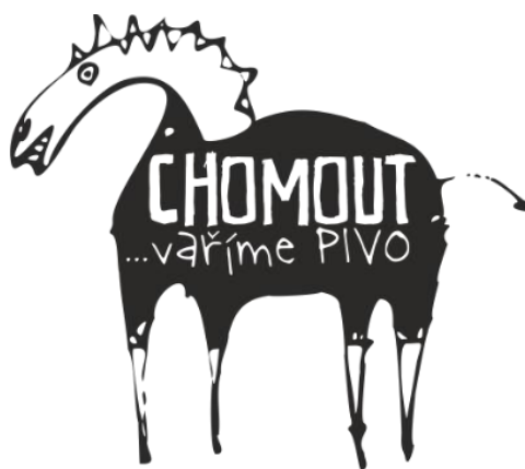
Obrázek 15 Logo vaříme Pivo (Chomout, 2020)

Ještě bych chtěla dodat, že Olomoucké tvarůžky jsou od roku 2010 zařazeny do nadnárodního evropského značení, přesněji chráněné zeměpisné označení. (Pavel Novák, Veronika Sedláčková, Lenka Rafaelová, 2010).