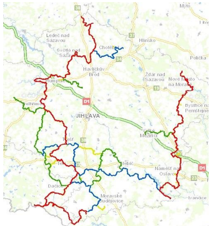
Obr. 9: Mapa jezdeckých stezek v Kraji Vysočina http://geoportal.kr-vysocina.cz/web/Map/Map1/Hipostezky