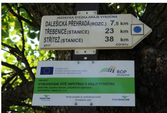
Obr. 5: Směrová tabulka ( http://www.region-vysocina.cz/jezdecka-stezka-dukovany-javorek-cervena-cx1333 )