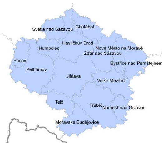
Obr. 8: Administrativní členění Kraje Vysočina http://www.risy.cz/cs/krajske-ris/kraj-vysocina/verejna-sprava/spravni-cleneni/obce-s-rozsir-pusobnosti/