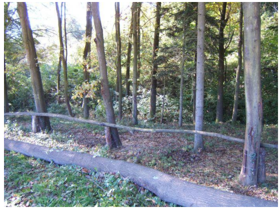
Obr. 7: Možné řešení úvaziště http://www.equichannel.cz/moravske-jezdecke-hipostezky-hipotrasy-beskydy-a-kolem-ranche-nevada