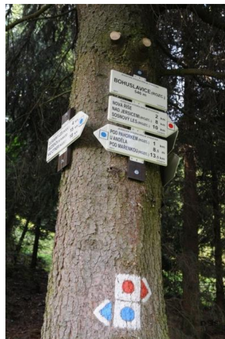
Obr. 4: Umístění značení na stromě ( http://www.region-vysocina.cz/jezdecka-stezka-svetla-pod-javorici-dukovany-modra-cx1337 )