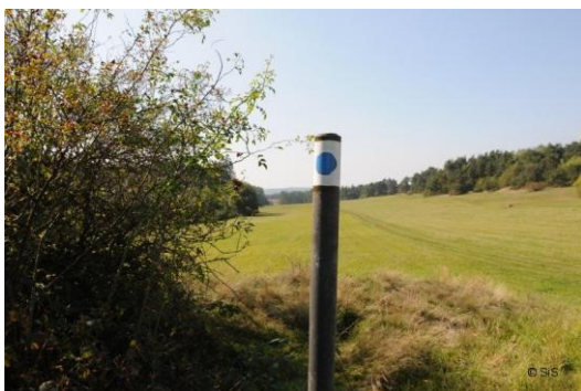
Obr. 3: Značka umístěná na sloupku ( http://www.region-vysocina.cz/jezdecka-stezka-svetla-pod-javorici-dukovany-modra-cx1337 )