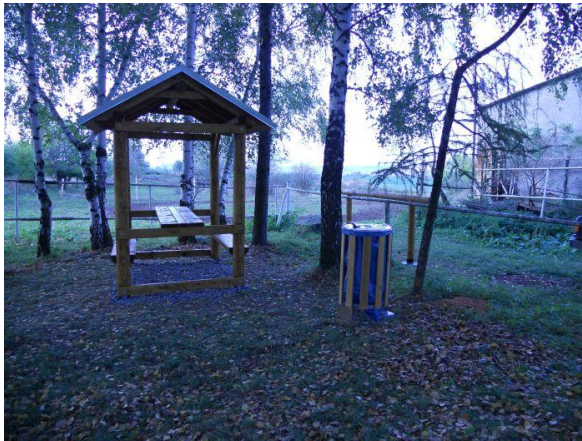
Obr. 6: Odpočívadlo s úvazištěm, krytým posezením a odpadkovým košem http://www.equichannel.cz/moravske-jezdecke-stezky-mostenka