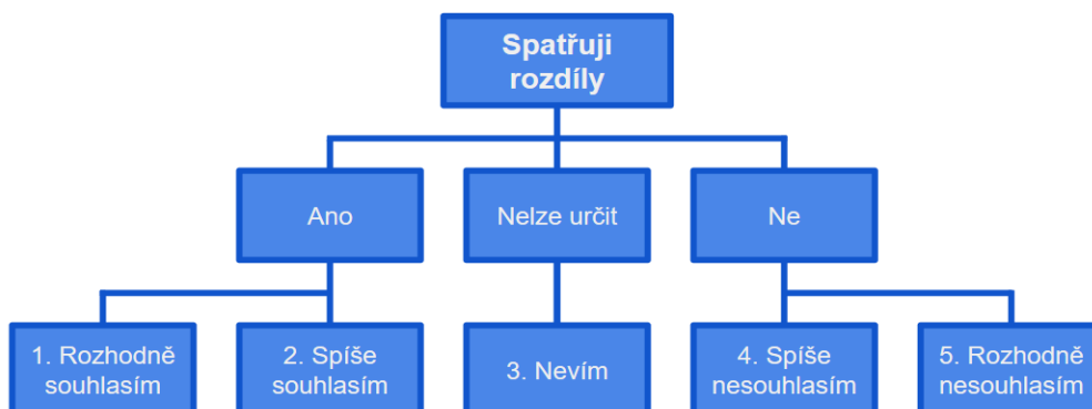
Schéma 2- Hodnocení rozdílnosti

Výrok bude uveden v dotazníku v otázce číslo 2. Respondenti vyjádří míru souhlasu na pětistupňové škále, viz následující schéma.