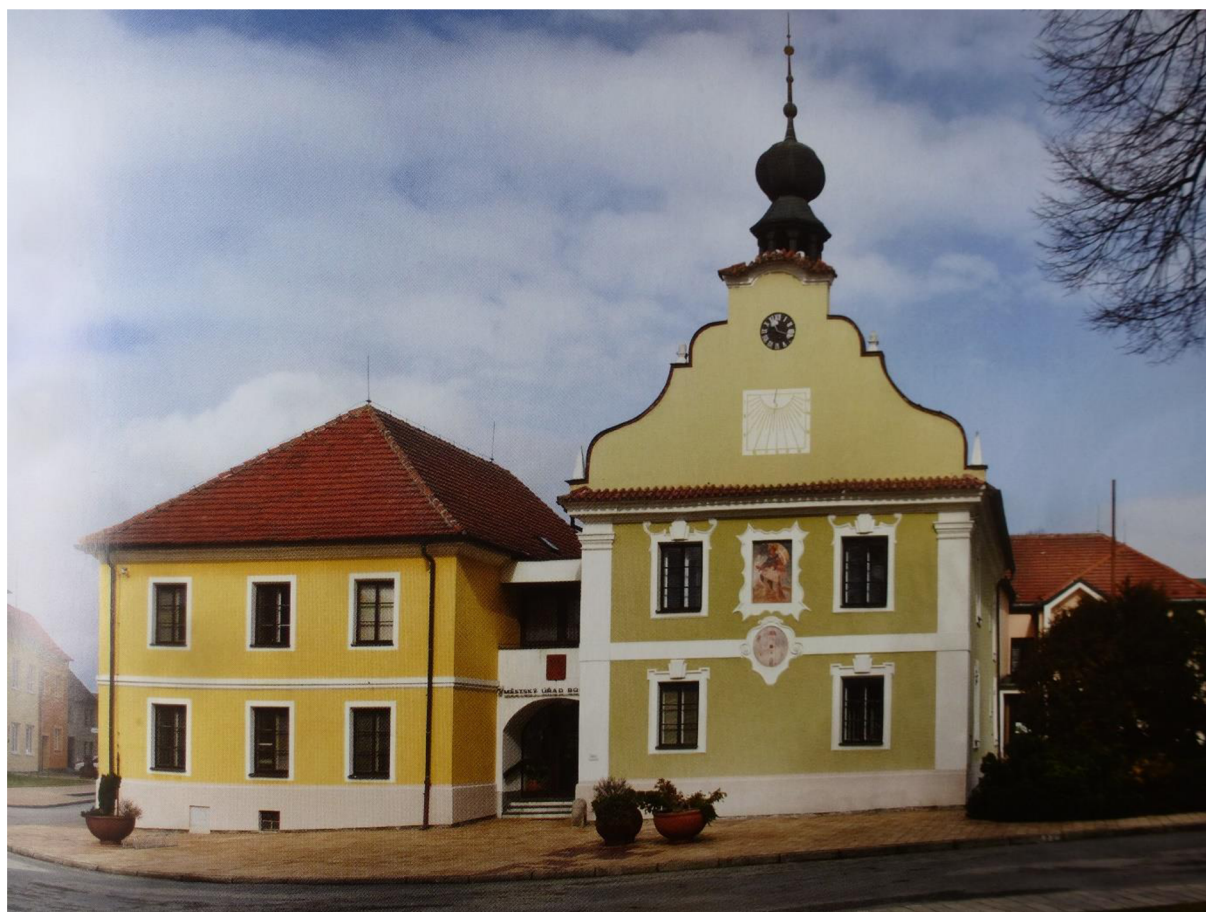
Pohled ze současnosti. Radnice zůstala na stejném místě. V budově, kde byla původně umístěna četnická stanice, je dnes Městský úřad v Borovanech.