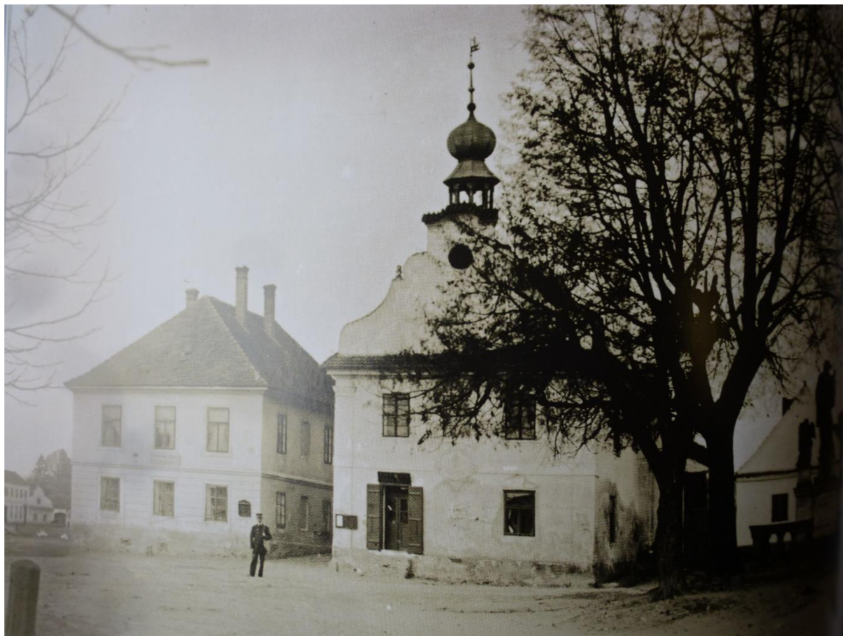
Na obrázku uprostřed lze vidět radnici. Budova stojící vlevo od ní byla Četnická stanice Borovany