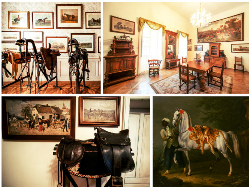
Obrázek č. 4: Hipologické muzeum. Slatiňany [online]. [cit. 2021-4-26]. Dostupné z: https://www.zamek-slatinany.cz/cs/informace-pro-navstevniky/prohlidkove-okruhy/1505-kralovstvi-za-kone-zakladni-okruh