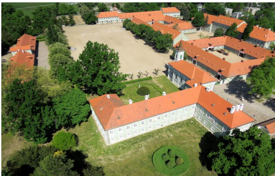
Obrázek č. 2: Národní hřebčín Kladruhy nad Labem. Equichannel [online]. 12. 3. 2020 [cit. 2021-4-26]. Dostupné z: https://www.equichannel.cz/narodni-hrebcin-kladruhy-nad-labem-az-do-odvolani-pro-verejnost-uzavren