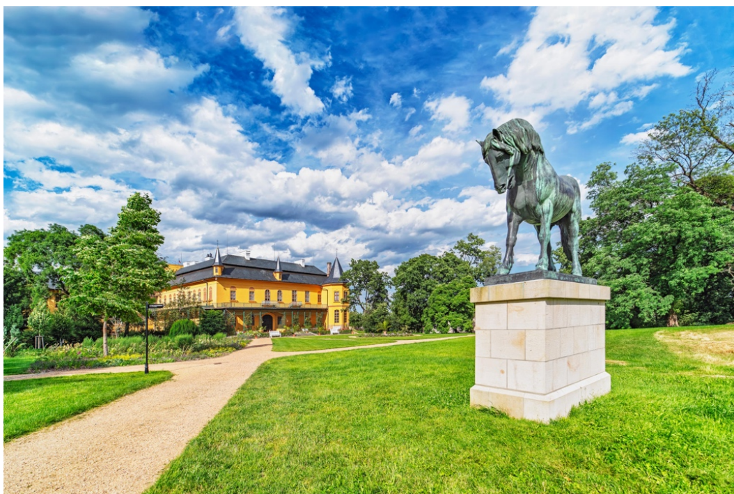
Obrázek č. 3: Zámek Slatiňany. Slatiňany [online]. [cit. 2021-4-26]. Dostupné z: https://www.zamek-slatinany.cz/cs/o-zamku/Rekonstrukce-zamku-a-parku