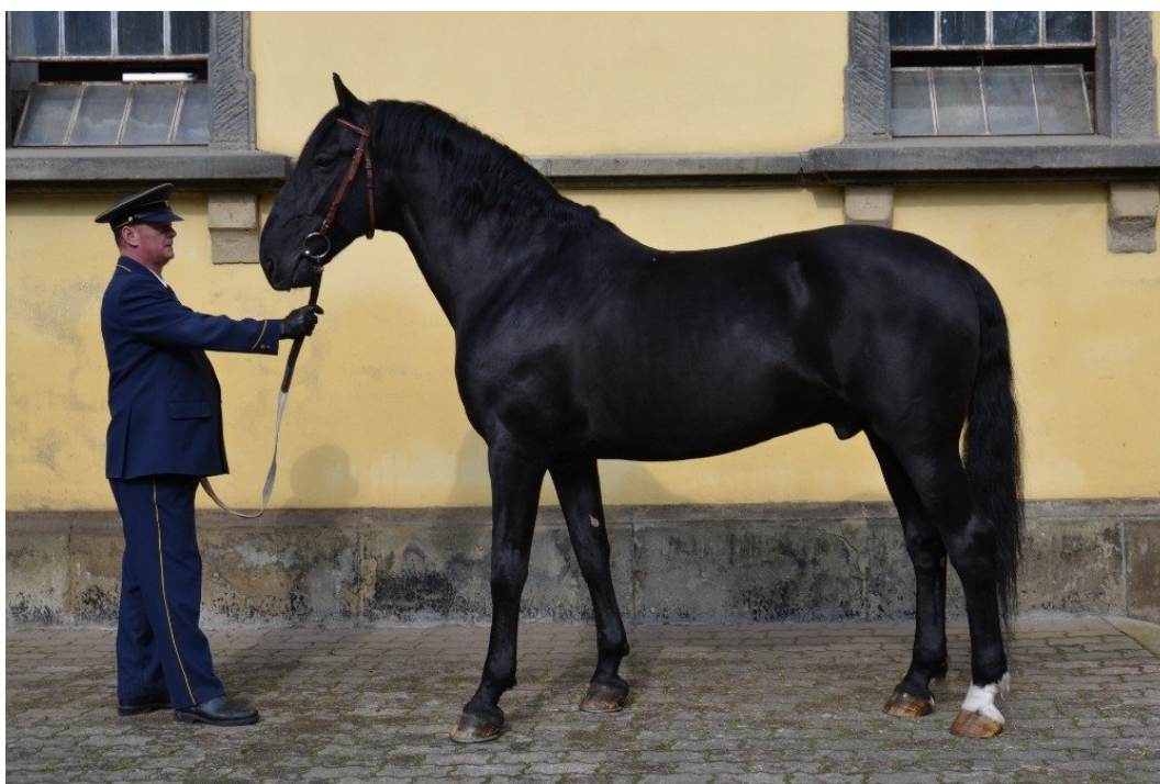
Obrázek č. 1: Starokladrubský vraník.

Starokladrubský kůň má značnou popularitu i za hranicemi našeho státu, kam byli někteří jedinci posláni v rámci rozvoje mezinárodních vztahů.