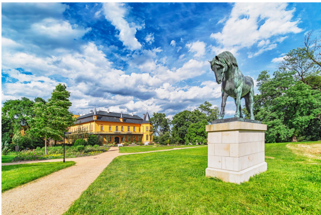
Obrázek č. 3: Zámek Slatiňany. Slatiňany [online]. [cit. 2021-4-26]. Dostupné z: https://www.zamek-slatinany.cz/cs/o-zamku/Rekonstrukce-zamku-a-parku