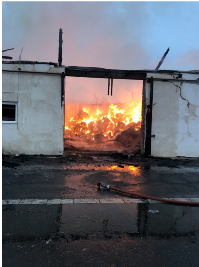
Obrázek č. 6: Požár ve stájích Apolenka (vlastní zpracování)

Stáje se původně skládaly ze dvou na sebe napojených budov, a dalších dvou o pár metrů dále. Díky velkému požáru, který zasáhl stáje v pondělí 26. listopadu 2018 v ranních hodinách byla jedna ze staveb srovnána se zemí. V ní se nenacházel jediný kůň, ale byla to zásobárna sena na několik měsíců dopředu. Několik dní trvalo, než byl požár kompletně uhašen, ale z okolních stájí se dostalo nečekaně přívětivé pomoci ve formě peněžních prostředků či zásob sena pro zvířata (Požár v Apolence, 2018).