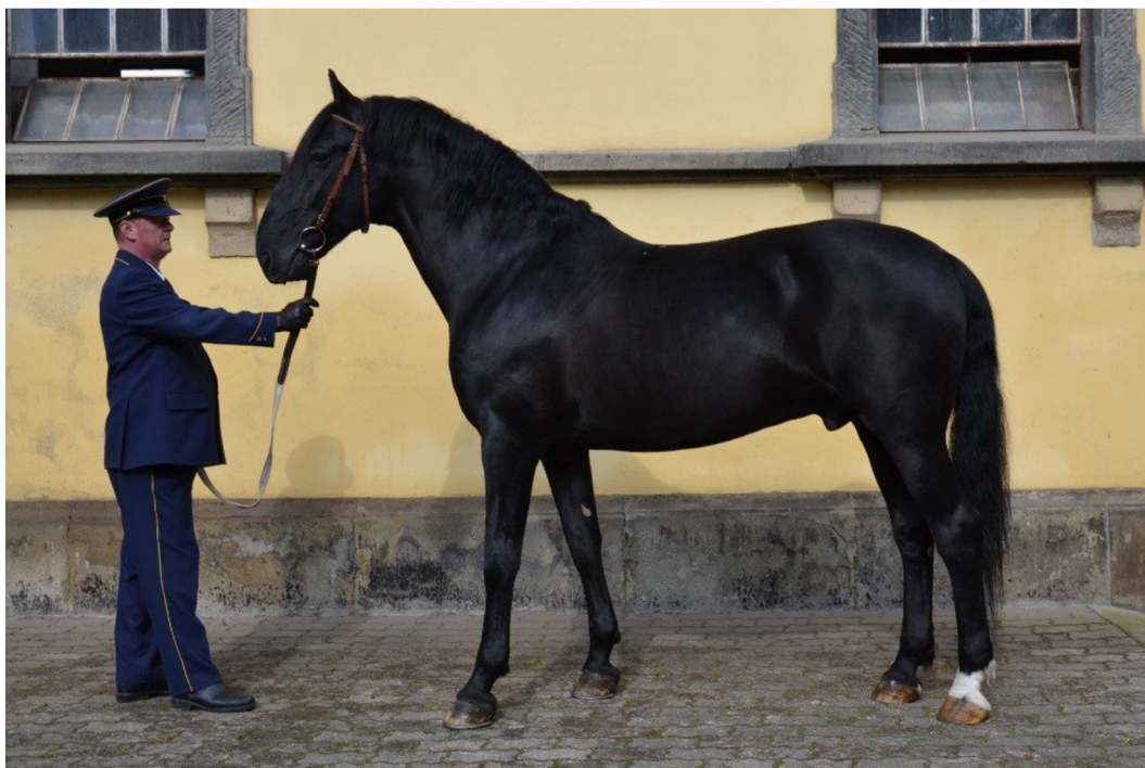
Obrázek č. 1: Starokladrubský vraník. Národní hřebčín Kladruby nad Labem [online]. 2019 [cit. 2021-4-26]. Dostupné z: https://www.nhkladruby.cz/jarni-trideni-starokladrubskych-koni-ve-slatinanech

Starokladrubský kůň má značnou popularitu i za hranicemi našeho státu, kam byli někteří jedinci posláni v rámci rozvoje mezinárodních vztahů.