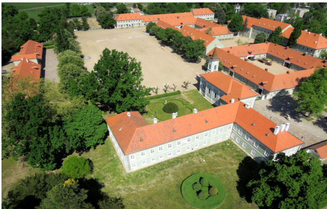
Obrázek č. 2: Národní hřebčín Kladruhy nad Labem. Equichannel [online]. 12. 3. 2020 [cit. 2021-4-26]. Dostupné z: https://www.equichannel.cz/narodni-hrebcin-kladruhy-nad-labem-az-do-odvolani-pro-verejnost-uzavren