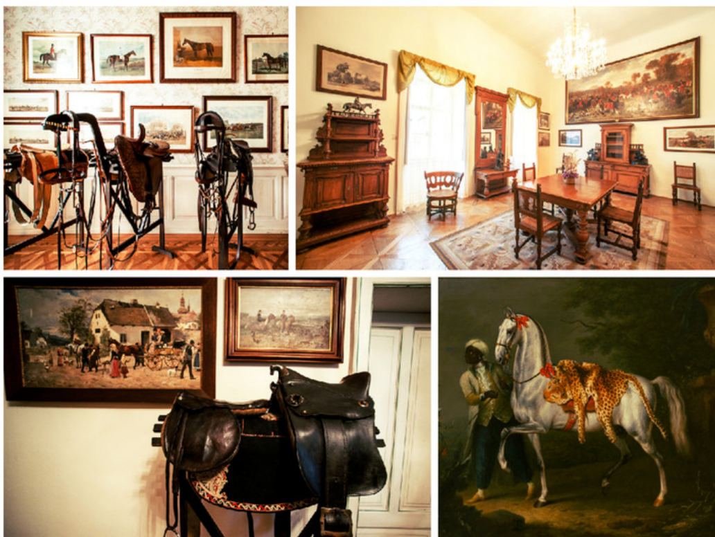
Obrázek č. 4: Hipologické muzeum. Slatiňany [online]. [cit. 2021-4-26]. Dostupné z: https://www.zamek-slatinany.cz/cs/informace-pro-navstevniky/prohlidkove-okruhy/1505-kralovstvi-za-kone-zakladni-okruh