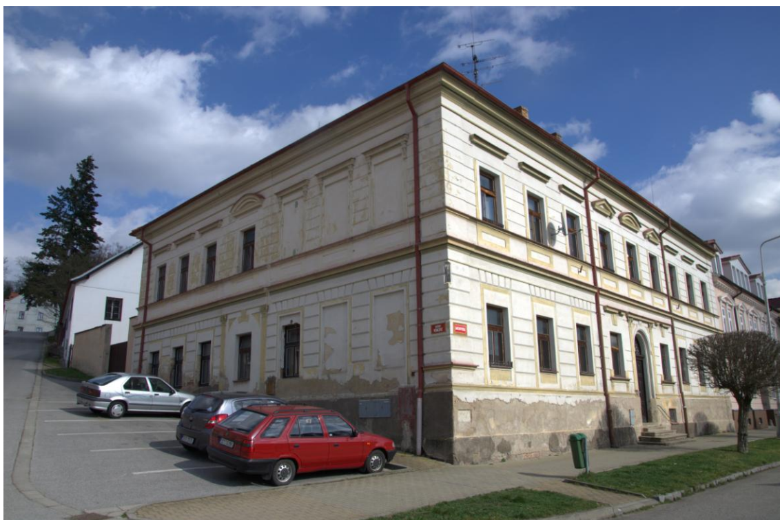
Současná fotografie budovy bývalé dívčí obecné školy