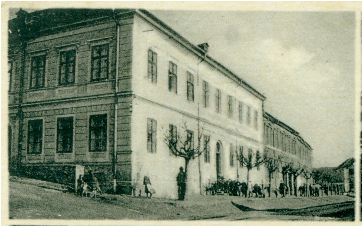
Fotografie dívčí obecné školy z 20. – 30. let 20. století