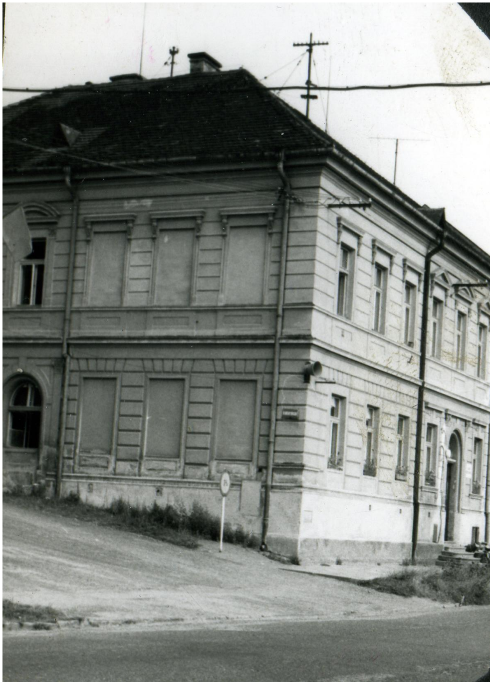
Fotografie dívčí obecné školy z 60. – 70. let 20. století