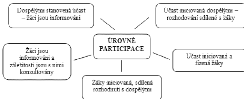
Obr. 3: Úrovně participace žáků podle P. Tresedera (1997)

Vidláková objasňuje příčiny, proč Treseder zvolil pro svůj model kruhové (viz obrázek 3) a ne hierarchické uspořádání jako Hart. Uvádí, že kruhové uspořádání umožňuje diferencovat mezi jednotlivými způsoby účasti a zapojení žáků v souvislosti s aktuálními potřebami, v souladu s možnostmi školy aj. Treseder vychází z Hartova označení jednotlivých úrovní, avšak ve svém modelu využívá pouze úrovně čtyři až osm, tedy pouze ty, jež jsou spojovány se skutečnou participací. Za nejdůležitější pak považuje podporu a vytvoření podmínek ze stran učitelů a vedení školy, jedině tak lze dojít k posilování participace žáků. 62 Tato podmínka, ač se může zdát samozřejmostí ve společnosti, jež je vedena k výchově k občanství, bývá v praxi právě často tím úskalím, které se těžko překonává.