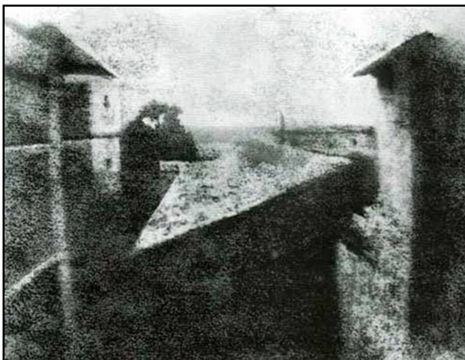
Obrázek 1: Pohled z okna na dvůr, r. 1826, Nicéphore Niépce