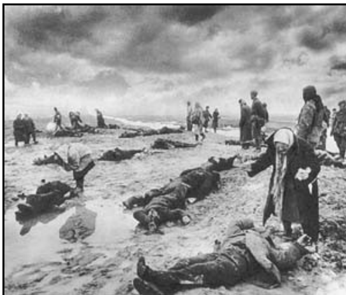
Obrázek 5: Dmitrij Baltermanc, Hoře, Kerč (Sorrow Stricken, 1942)