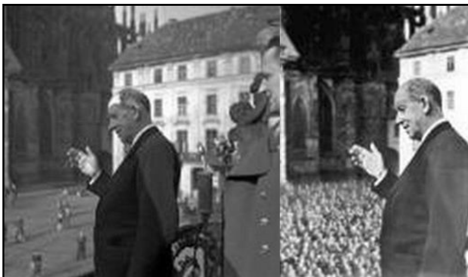
Obrázek 4: Prezident republiky Antonín Zápotocký zdraví z balkonu na III. nádvoří Pražského hradu občany - volba prezidenta 21. 03. 1953

Zdroj: KASÍK, Pavel, Technet.iDnes.cz, 22. Září 2007, [on line] Dostupné na WWW: < http://technet.idnes.cz/jak-z-fotografii-mizeli-nepohodlni-lide-vylet-do-sveta-fotomontaze-1fu-/tec_foto.aspx?c=A070914_103713_tec_foto_pka >.