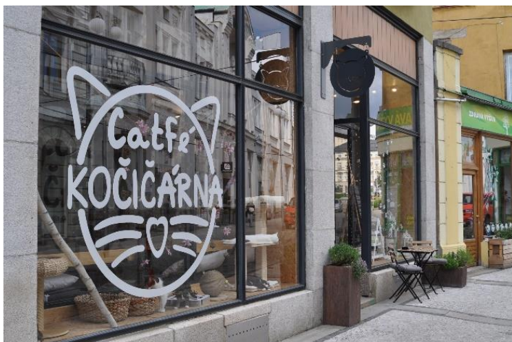
Obrázek 2: Exteriér kavárny