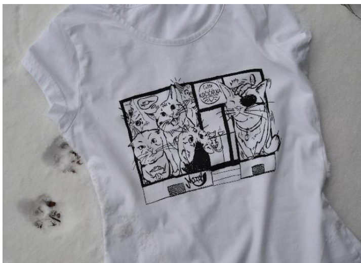
Obrázek 3: Tričko Catfé Kočičárna

Kavárna má i vlastní plátěné tašky a trička, které se dají v provozovně zakoupit. Autorem designu je společnost Mazel gang s. r. o. (Viz Obrázek 3: Tričko Catfé Kočičárna).