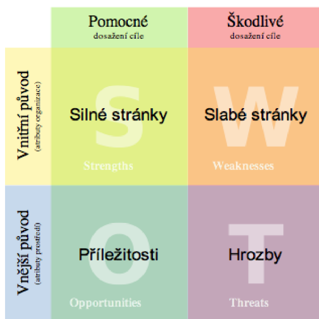
Obrázek 1.1: SWOT analýza (Fotopulos.net, 2011)

Důležité je sledovat dění uvnitř i vně svého podnikání/byznysu a umět na ně reagovat. Je vhodné využít nabídnuté příležitosti při preferenci vlastních předností, je vhodné eliminovat slabiny (Zámek a Lacina, 2011). Také je vhodné se ujistit, zda používáme vizuálně přitažlivý formát, odrážky a vždy mít alespoň dvakrát tolik silných stránek a příležitostí ve srovnání se slabými stránkami a hrozbami (Borosky, 2019).