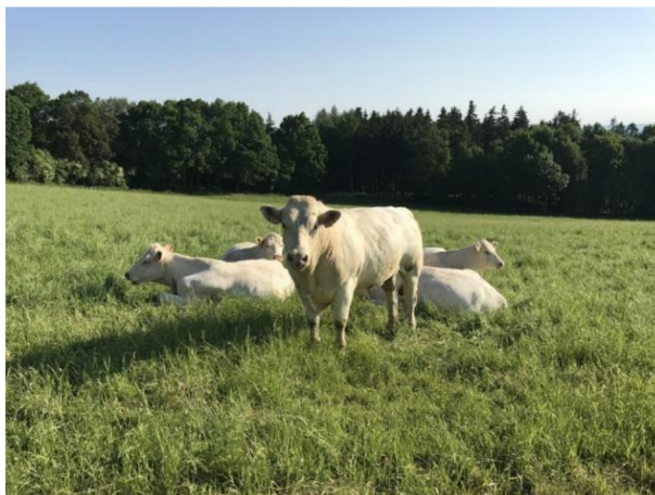
Obrázek 3.1: Skot Charolais