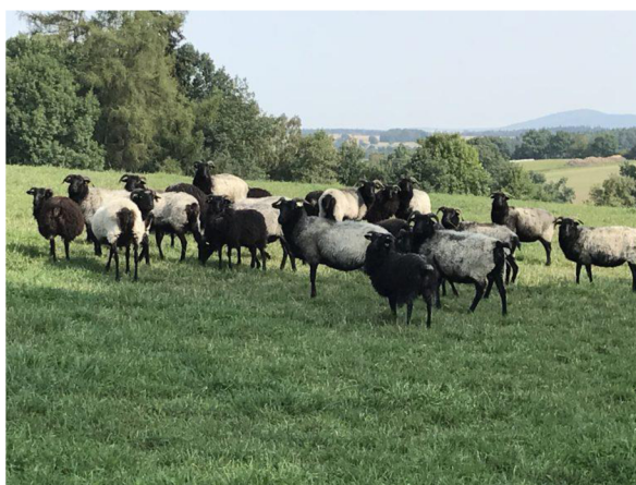
Obrázek 3.2: Ovce Vřesové (Biorasovice.cz)