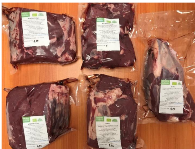
Obrázek 3.3: Biomaso

Jehněčí maso je zabalené a rozporcované celé jehně po 0,5-1 kilových kusech, celá váha balíčku je 10-15 kilo. Cena jehněčího masa je 418 Kč/kg.