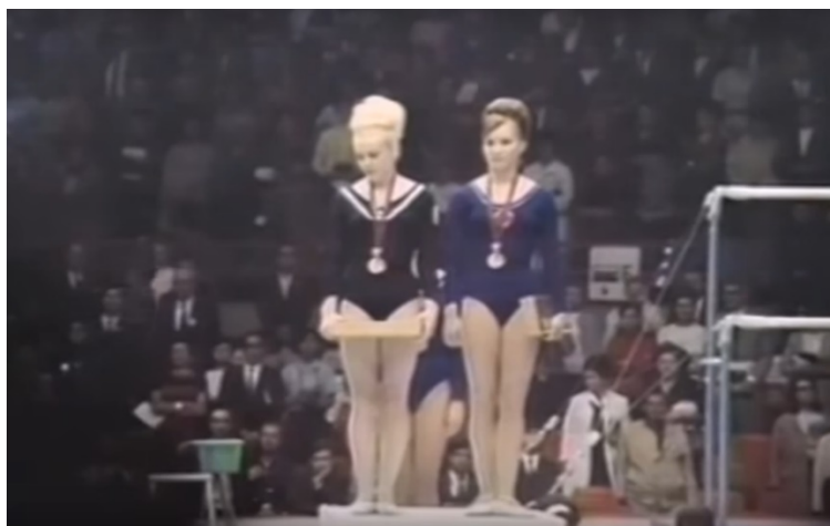
Obrázek č. 6 Věra Čáslavská na stupních vítězů odklání hlavu od ruské vlajky