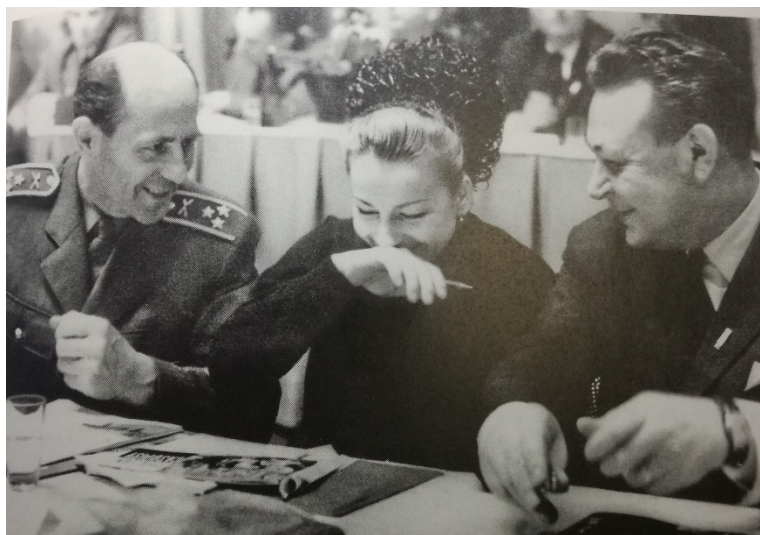
Obrázek č. 9 Po Věřině pravici sedí Emil Zátopek