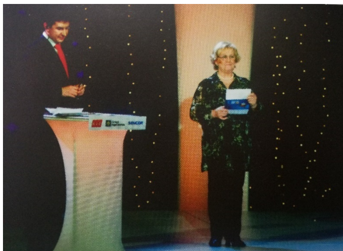
Obrázek č. 12 Vyhlášení sportovce roku 2009