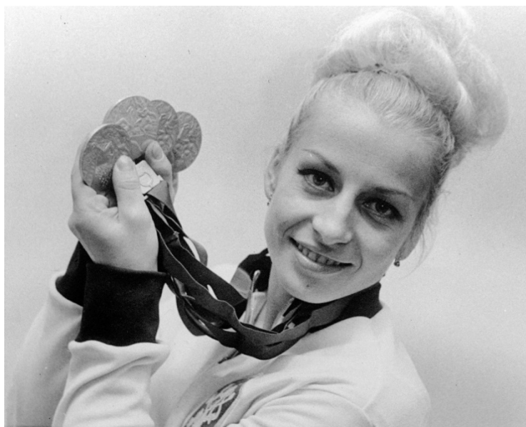
Obrázek č. 7 Celkem čtyři medaile si přivezla Věra Čáslavská z Mexika