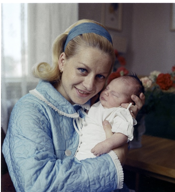
Obrázek č. 8 Věra Čáslavská s dcerou Radkou

Dne 4. srpna 1969 se jí narodila dcera Radka.