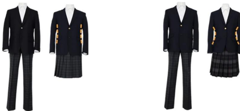
Obrázek 15 Genderless uniformy společnosti Kankó (Kankó 2023)

Společnost Kankó dosažení větší genderové rozmanitosti ve školách a cíle udržitelného rozvoje velmi podporuje, proto za poslední dobu přišla se širokou škálou genderless uniforem, které nabízí různé střihy, barvy a vzory a stále se jejich design snaží inovovat (Kanko 2023). Na obrázku č. 15 lze vidět dvě varianty černých uniforem, přičemž ty na levé straně mají volnější střih a nezvýrazňují postavy, kdežto ty na pravé straně mají střih užší.