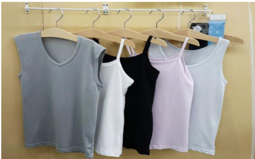
Obrázek 9 Kolekce spodního prádla genderless (IT Media 2023)

Dívky ještě zmínily to, že by si přály, aby trička byla méně průhledná a rozdíly mezi pohlavím nebyly tolik patrné (IT Media 2023). Na základě této zpětné vazby proto přehodnotili svůj dosavadní postoj k navrhování kolekcí a začali se řídit podle názoru dětí.