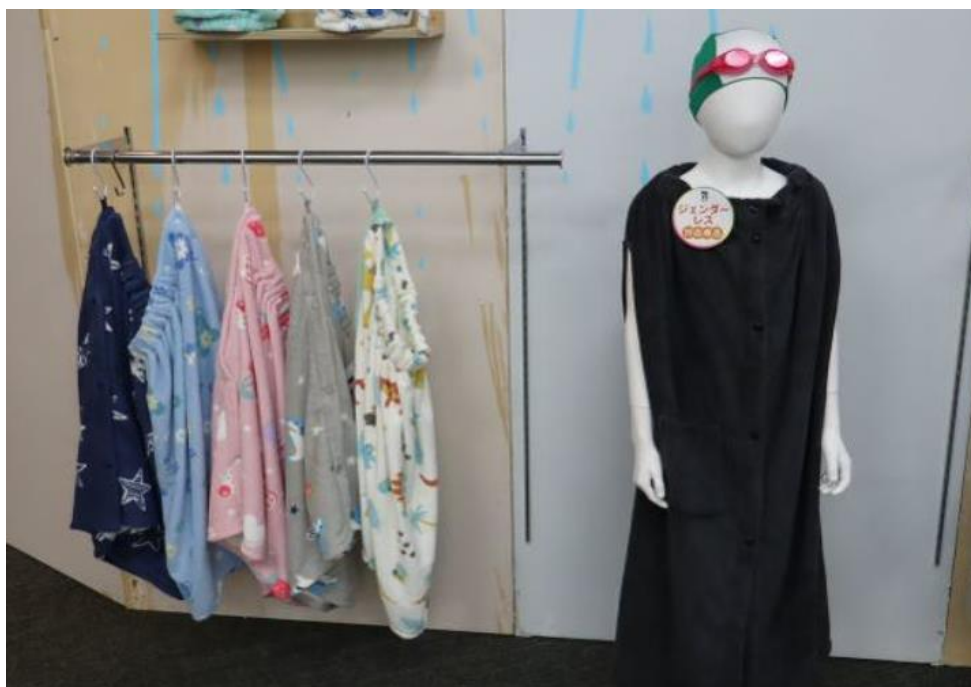
Obrázek 10 Kolekce ručníků a plavek genderless (IT Media 2023)

Na základě zpětné vazby od žáků základních škol navrhla společnost i plavky a ručníky používané při výuce plavání. Vytvořila speciální typ ručníků podobným ponču, takže si je děti mohou na sebe navléct, jak lze vidět na obrázku č. 10. Společnost Seven & I Holdings se zaměřila především na barvy a nabízí ho ve fialové, červené, černé, šedé a dalších barvách, které už na sobě mají i různé vzory. Nejvíce překvapená byla z požadavku na černou barvu, kterou volily zejména dívky (IT Media 2023).