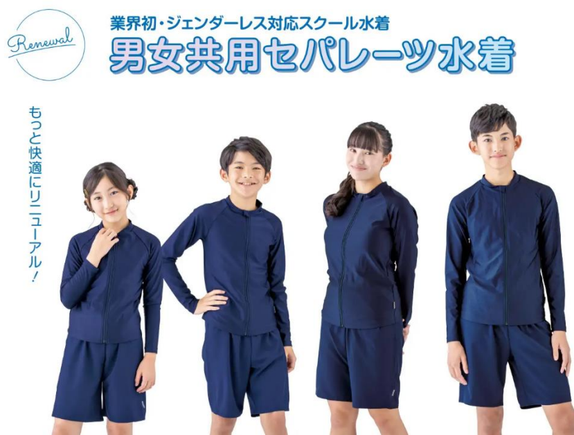
Obrázek 18 Genderless plavky (PR Times 2024)

Na obrázku č. 18 lze vidět, že plavky mají stejný celkový design a volný střih, aby nezvýrazňoval tělesné rysy postav. Plavky jsou vyrobeny z lehkého materiálu, takže i když jsou mokré nelepí se na tělo. Jsou k dispozici ve čtyřech velikostech a dvou barvách, a to tmavě modré a černé, která byla od studentů velmi žádaná.