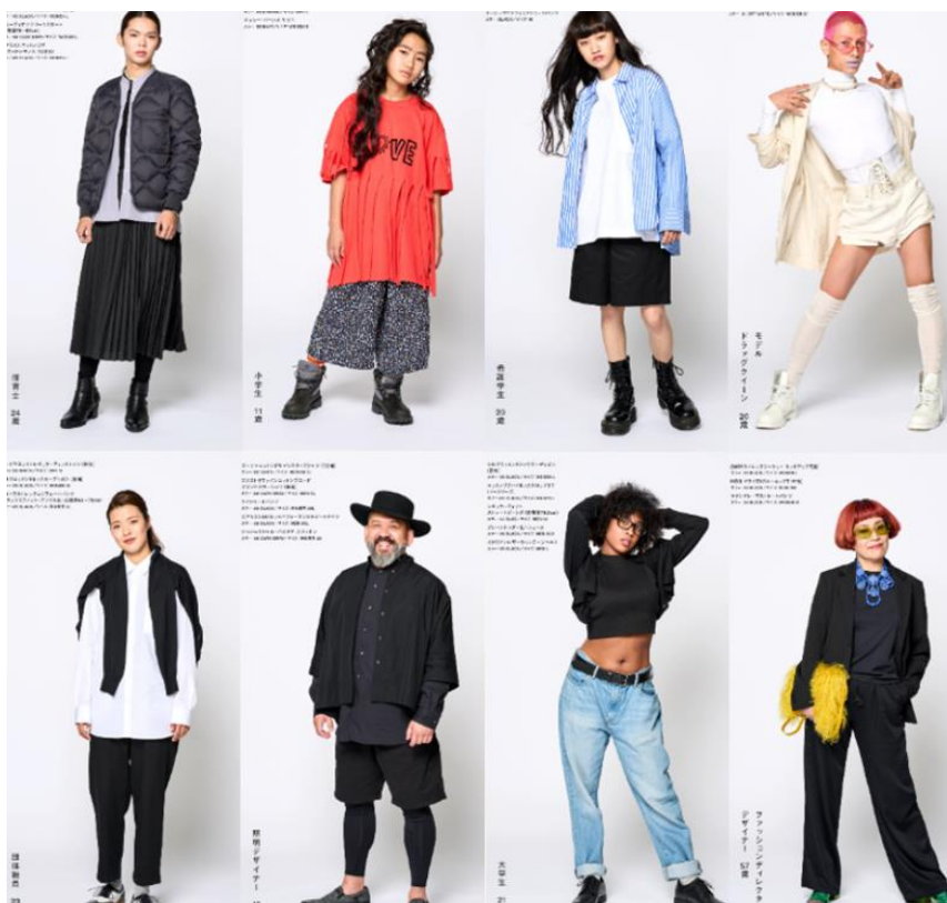
Obrázek 6 Uniqlo kolekce oblečení bez hranic (Cheer SDG 2021)

Společnost Uniqlo se studenty pořádala několik workshopů, na kterých diskutovali o různých stereotypech v oblasti módy a zjistili, že spousta z nich má stále velké obavy ohledně toho, co si mohou obléknout, aniž by se ihned nesetkávali s kritikou nebo šikanou (Cheer SDGs 2021). To se dá aplikovat na většinu lidí, kteří se s těmito problémy setkávají neustále, což je následně ve výběru oblečení omezuje, protože se kvůli zažitým stereotypům bojí vybírat to oblečení, které se jim skutečně líbí. Na základě toho uskutečnila společnost Uniqlo společný projekt, prostřednictvím něž chtěla poukázat na to, že mnoho lidí se podle těchto stereotypů neustále řídí, a to i nevědomky, což je brzdí ve vyjádření vlastní individuality (PrTimes 2021). Chtěla tak přispět k vytvoření společnosti, ve které by se od těchto tradičních stereotypů v módě upustilo a zároveň chtěla ukázat, že si lidé mohou užívat módu bez ohledu na jejich pohlaví, gender, věk nebo národnost (PrTimes 2021).