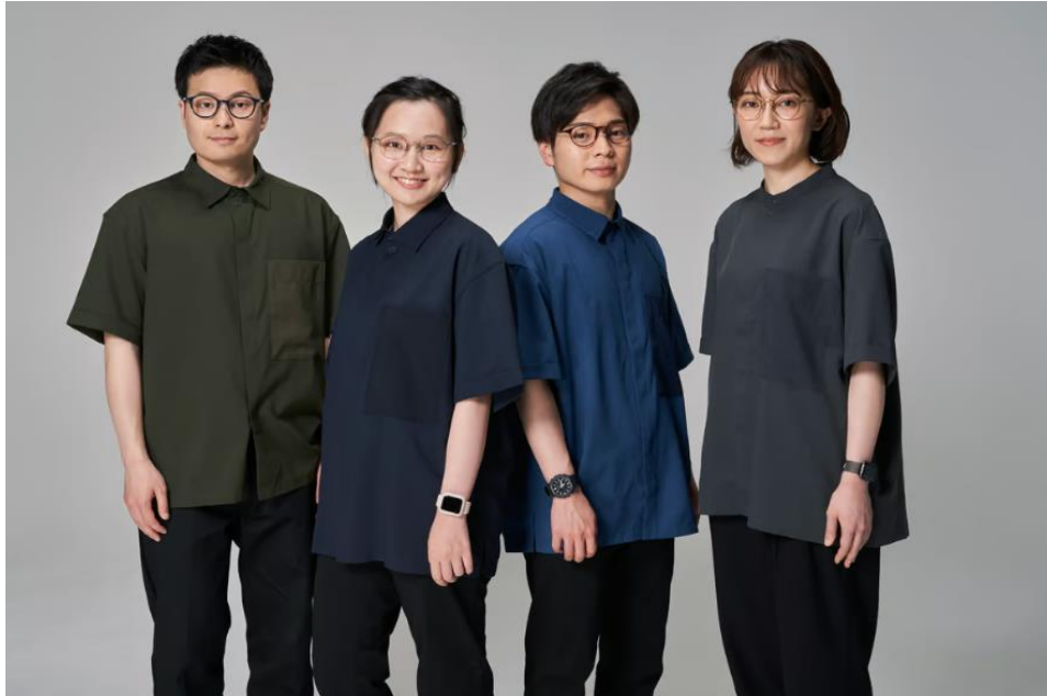
Obrázek 24 Uniformy společnosti JINS (Fashion snap 2022)

Plynárenská společnost Saibu Gas zcela změnila dosavadní dress codu zaměstnanců na svých pracovištích (RKB 2023). Zaměstnanci zpočátku nosili klasický formální oblek, avšak sami zkusili navrhnout, zda by tento dress code nemohl být poupraven, načež byl následně po dobu 3 let zaveden tzv. „neformální pátek“, kdy si mohli zaměstnanci sami podle sebe zvolit dané oblečení (RKB 2023). Jeden ze zaměstnanců se vyjádřil tak, že „V podstatě jsem nosil jenom oblek. Teď se cítím uvolněnější a odhodlanější do práce“.