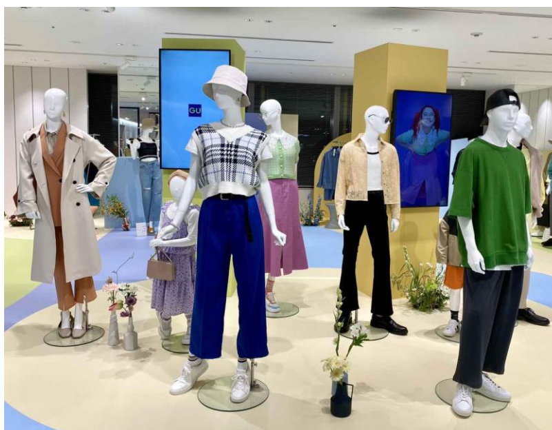
Obrázek 7 Kolekce barevných kalhot GU (Fashion Trend News 2022)

Společnost GU pro podzimní sezónu 2021 přišla se speciální kolekcí barevných kalhot na které se zaměřila proto, že se domnívá, že lidé mají při jejich výběru větší potíže z důvodu příliš odlišných střihů a velikostí, které nejsou univerzální pro jeden konkrétní typ postavy (Fashion Trend News 2022). Jejich střihy a velikosti tedy navrhla tak, aby vyhovovaly jak ženské, tak i mužské postavě bez toho, aniž by zvýrazňovaly křivky a tvary jejich postavy (Fashion Trend News 2022).