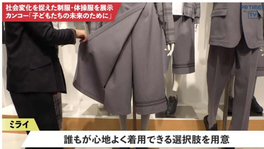
Obrázek 17 Kalhoty a sukně v jednom (PR Times 2022)

Pro větší zviditelnění této kolekce zveřejnila zpravodajská společnost PR Times na svém youtubovém kanále video reportáž, ve které ji lépe představila (PR Times 2022). Podle screenshotu z reportáže, který je na obrázku č 8 lze vidět, že společnost Kankó také představila krátké kalhoty, přes které je přidělaná látka tak, že na první pohled vypadají jako sukně (PR Times 2022).