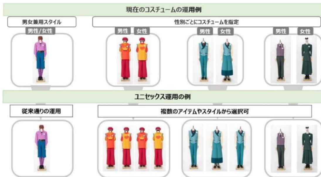
Obrázek 20 Uniformy v zábavním parku Disney Land (IT Media 2023)

Počátkem roku 2023 změnila pravidla uniforem a předpisy týkající se vzhledu svých zaměstnanců 7 . Na obrázku č 2 na prvním řádku lze vidět původní uniformy, které byly buď pro muže nebo ženy a ti si mezi nimi nemohli vybírat. Na druhém řádku lze vidět nový systém uniforem, který je sice označován termínem unisex, avšak společnost Oriental Land je zároveň označuje i termínem genderless (Oriental Land 2023). U nového systému uniforem kompletně zrušila označování podle pohlaví a zaměstnanci si z různých variant mohou vybírat sami. Na obrázku č. 20 lze také vidět pouze částečnou úpravu uniforem, například u oranžových byly přidány různé barevné kombinace a střihy, zatímco u modrých byla přidána 3 varianta užšího střihu, avšak typů uniforem je mnohem více. Společnost Oriental Land těmito změnami chce přinést větší genderovou rozmanitost, respektovat své zaměstnance a vytvořit tak příjemnější pracovní prostředí. Dané změny sice označuje termíny unisex i genderless , avšak používá je ve stejném slova smyslu.