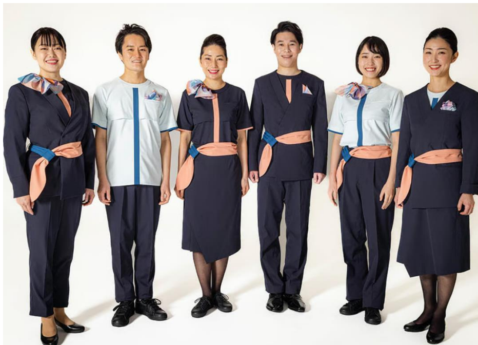
Obrázek 22 Genderless uniformy letecké společnosti Air Japan (Fashion snap, 2023)

Dále mají možnost na výběr z lodiček s nízkým podpatkem nebo kožených bot v černé barvě, což je také obrovská změna u leteckých společností, protože ženy musely tradičně nosit lodičky s vysokými podpatky a nemohly si zvolit kožené boty (Storyweb 2023). Společnost Air Japan chtěla novým designem uniforem přispět k větší genderové rozmanitosti, avšak stále chtěla zachovat tradiční japonské prvky, proto se rozhodla pro vrstvení jednotlivých látek a látku kolem pasu, která má částečně znázorňovat pásek obi (帯), který reprezentuje spojení se zákazníkem a ohleduplnost (Fashion snap 2023).