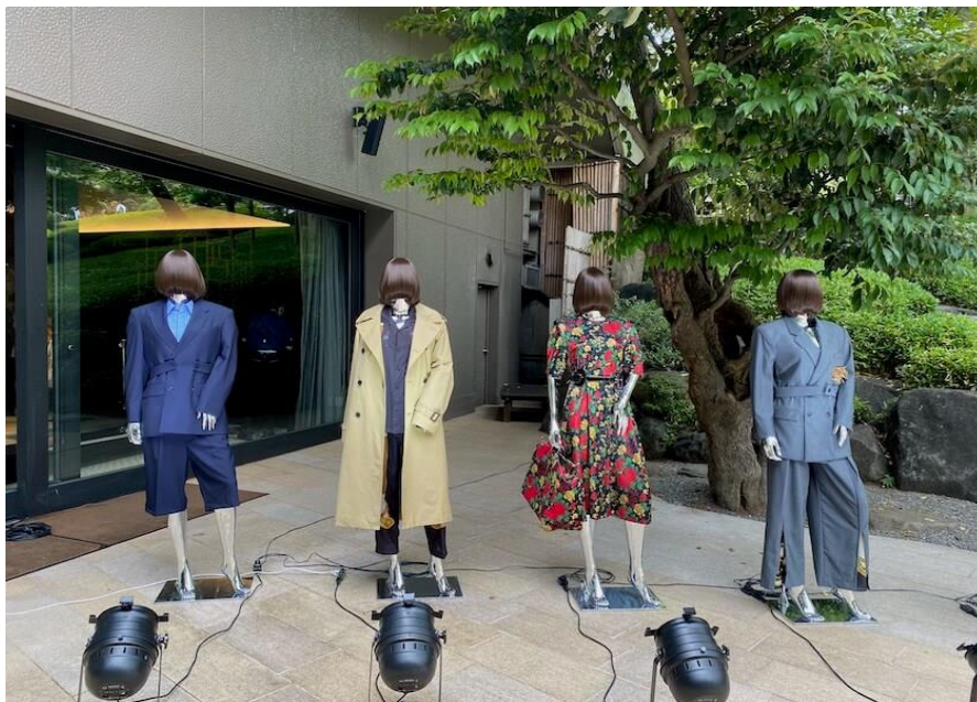
Obrázek 3 Toga Archives x H&M (Miura 2021)