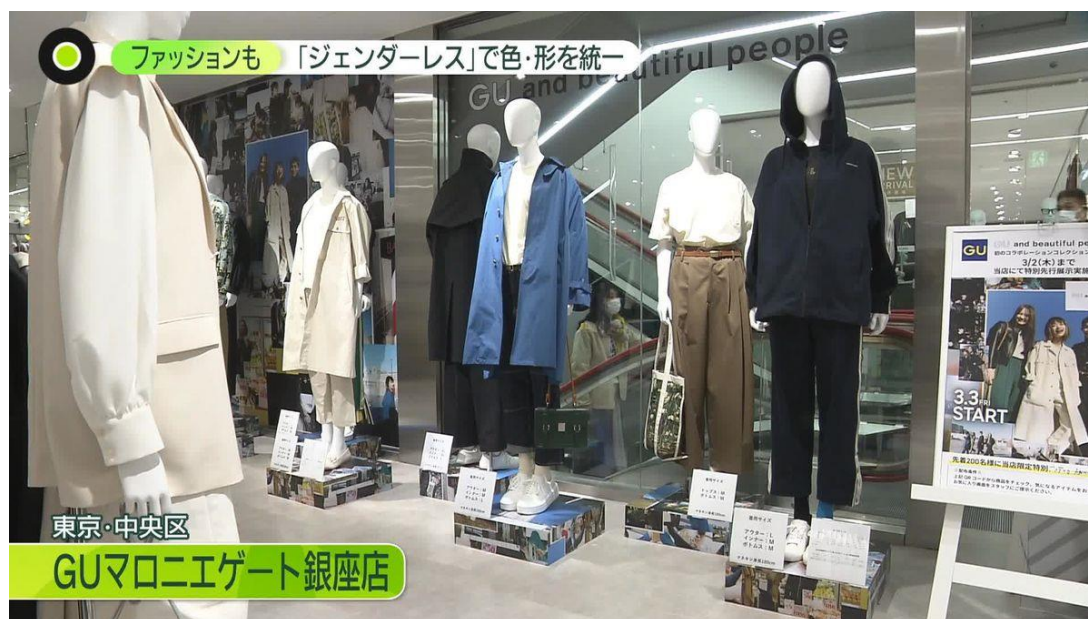
Obrázek 8 Genderless kolekce na prodejně GU (NNN News 2023)

Společnost GU dokonce i změnila rozvržení svých kamenných prodejen, do kterých přidala speciální sekci, ve které prezentuje nové kolekce oblečení vhodné pro každého (NNN News 2023). Tu pojmenovala termínem genderless a stejně tak nazývá nové kolekce oblečení.