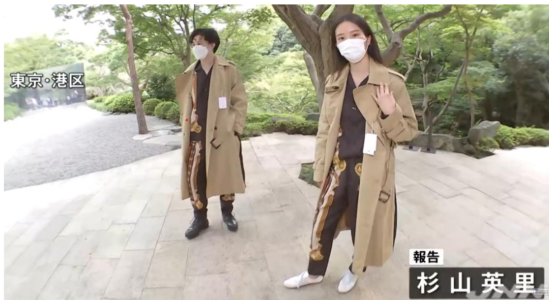
Obrázek 4 Reportáž deníku TBS News Dig (TBS News Dig 2021)

V kolekci je představeno 55 kousků oblečení v různých barvách, střížích a velikostech, ale všechny jsou uzpůsobeny tak, aby vyhovovaly jak mužské, tak i ženské postavě. Na obrázku č. 3 lze vidět čtyři různé outfity z kolekce, které mohou zpočátku působit tak, že mají spíše femininní prvky, jak je tomu například u šatů s květinami, anebo volným kalhotám se sakem a květinou, a tudíž jsou navrženy pro ženy, avšak jsou prezentovány tak, že je může nosit každý, bez ohledu na své pohlaví. V Japonsku měla tato kolekce obrovský úspěch a po uvedení na trh byla během týdne vyprodána (Jamada 2021).