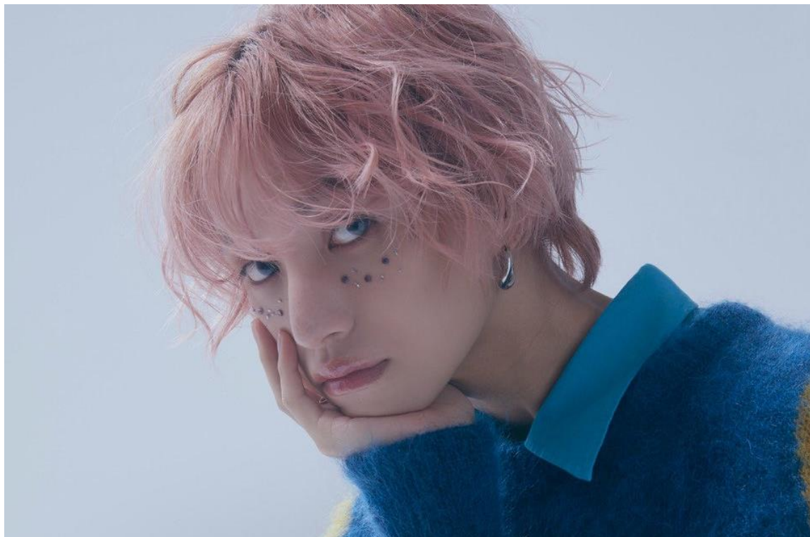
Obrázek 2 Toman Sasaki (X 2021)

Mediálně známý herec a model, který patří k této subkultuře je Toman Sasaki kterého lze vidět na obrázku č. 2. Upoutal na sebe pozornost především díky svému vzhledu, který se odlišuje od stereotypních norem a bývá označován jako genderless danši , protože velmi často nosí make-up, lakuje si nehty a obléká se do stylů, které vykazují prvky feminity a maskulinity (Oricon News 2023).