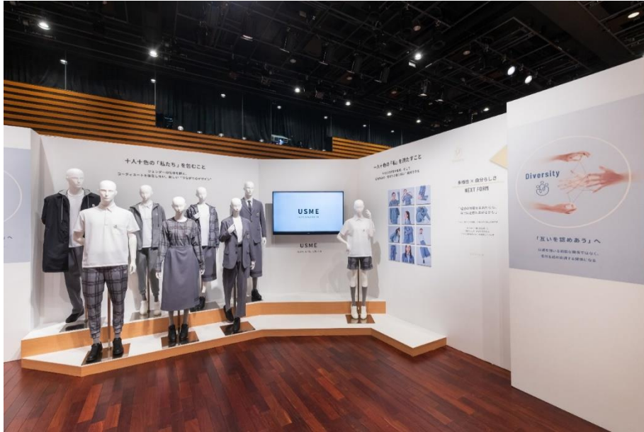
Obrázek 16 Genderless kolekce uniforem společnosti Kankó (Kankó 2022)

Pro větší zviditelnění této kolekce zveřejnila zpravodajská společnost PR Times na svém youtubovém kanále video reportáž, ve které ji lépe představila (PR Times 2022). Podle screenshotu z reportáže, který je na obrázku č 8 lze vidět, že společnost Kankó také představila krátké kalhoty, přes které je přidělaná látka tak, že na první pohled vypadají jako sukně (PR Times 2022).