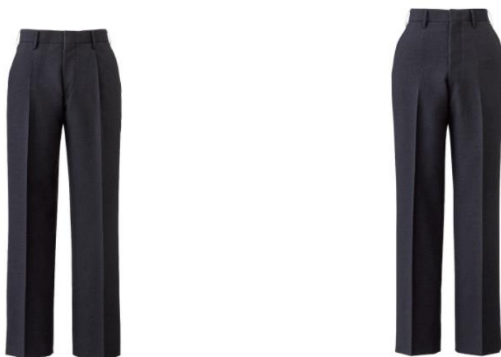
Obrázek 13 Dívčí kalhoty (スラックス) (Asahi 2021)

Jako příklad dívčích kalhot lze uvést ty na obrázku č. 13 od společnosti Tombo, která nabízí dvě varianty, přičemž ta na levé straně má volnější střih a nezvýrazňuje postavu, kdežto ta na straně pravé má střih úzký (Kobajaši 2021).