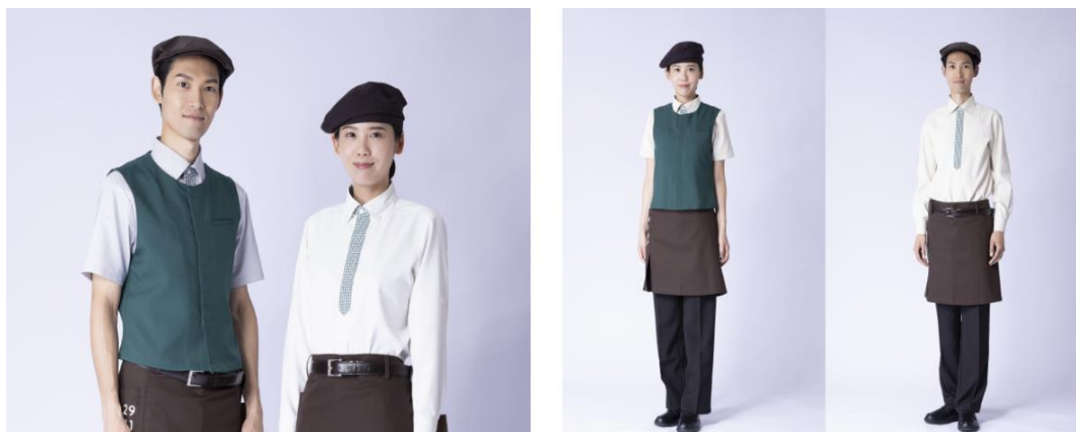
Obrázek 19 Genderless uniformy společnosti Bikkuri Donkey (Aleph 2022)

Společnost Bikkuri Donkey, která vlastní řetězec restaurací specializujících se na hamburgerové steaky, koncem roku 2022 zavedla zcela nový design genderově neutrálních uniforem na všech pobočkách pro své zaměstnance (IT Media 2023). Ty se skládají ze 3 typů klobouků, 6 typů košil s krátkým nebo dlouhým rukávem v bílé, šedé a béžové barvě a jednoho typu vesty a veškeré části jsou vyrobeny v několika střízích, aby si zaměstnanci vybrali ty, které jim vyhovují. Jak je vidět na obrázku č. 19, nové uniformy jsou navrženy tak, aby vyhovovaly potřebám každého zaměstnance.