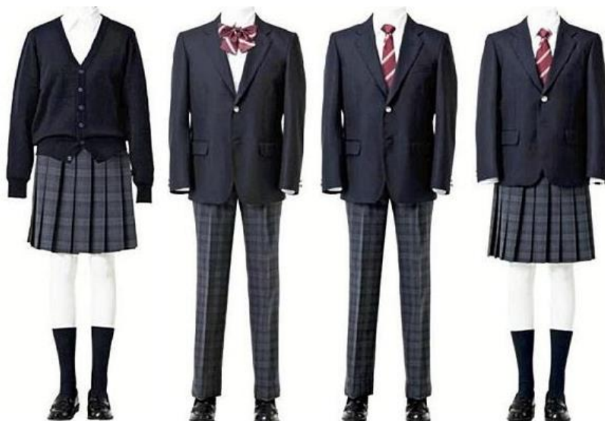
Obrázek 11 Klasické školní uniformy (Zenpop 2023)

Každá škola má svůj specifický design uniforem, na jejímž návrhu se podílí s konkrétní výrobní společností, se kterou spolupracuje (ZenPop 2023). Mezi ty největší patří například Tombo gakuseifuku (トンボ学生服), která je do škol dodává již od roku 1930 (Tombow n.d.). Další z nich je Kankó gakuseifuku (トンボ学生服), která svou výrobu zaměřila na uniformy kolem roku 1953 (Kanko n.d.). Na obrázku č. 11 lze vidět moderní školní uniformy.