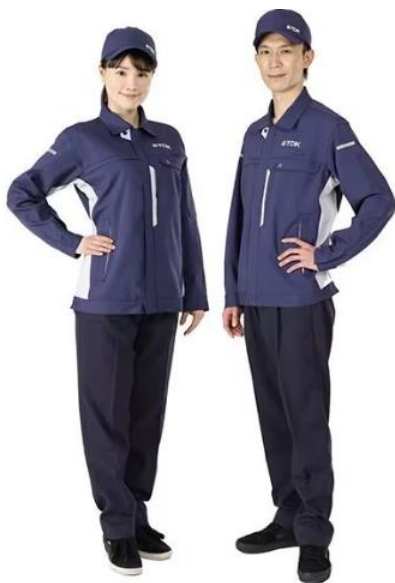
Obrázek 21 Uniformy společnosti TDK (IT Media 2023)

Společnost TDK, která se zabývá výrobou elektronických součástek, představila v dubnu roku 2023 nové genderově neutrální pracovní uniformy (IT Media 2023). Navrhla je tak, aby respektovaly genderovou rozmanitost, odpovídaly dobře, zároveň aby byly bezpečné, funkční a kladly důraz na jednoduchost (IT Media 2023). Zaměstnanci dříve nosili uniformy, které se v designu lišily pro muže a ženy, ale na obrázku č. 21 lze vidět, že nové pracovní uniformy jsou navrženy jednotně pro všechny zaměstnance.