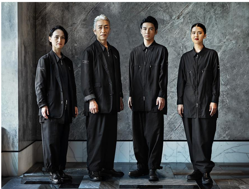
Obrázek 23 Genderless uniformy hotelu Mesm (Mesm 2024)

Společnost JINS, která se specializuje na výrobu inovativních a lehkých brýlí, zavedla nové genderově neutrální uniformy pro své zaměstnance již v roce 2022 (Fashion snap 2022). Dříve zaměstnanci nosili uniformy, které byly oddělené pro muže a ženy, proto nově zavedené uniformy společnost vytvářela s ohledem na zajištění větší genderové rozmanitosti. Jak je vidět na obrázku č. 24 uniformy společnosti JINS mají jednotný design, přičemž se skládají z košile v několika velikostech, která je ve 4 barvách, a to tedy námořnická modrá, modrá, olivová a šedá, z nichž si zaměstnanci mohou vybrat sami. Spodní část je v černé barvě, ale zaměstnanci si volí sami, jestli chtějí nosit kalhoty nebo sukni.