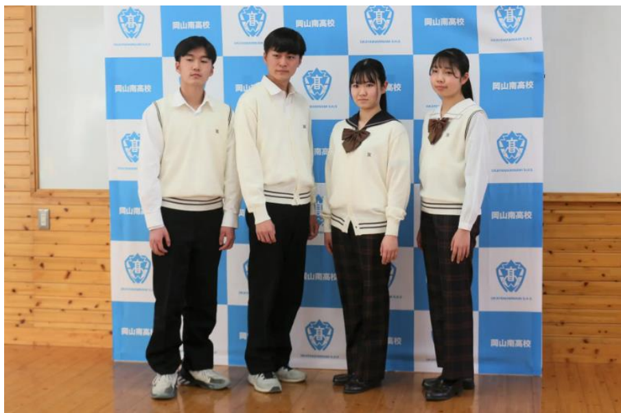
Obrázek 14 Uniformy školy Okajama Minami (PR Times 2023)

Dalším příkladem odlišného designu dívčích kalhot jsou ty, které na jaře roku 2023 zavedla vyšší střední škola Okajama Minami, na kterých spolupracovala s výrobní společností Kanko (PR Times 2023). Podle obrázku č 5 lze vidět, že na rozdíl od těch chlapeckých nejsou až tak volné a liší se také vzorem i barvou. Jako další část uniformy mají studenti na výběr z vesty nebo kardiganu, které mají stejné barvy i střihy.