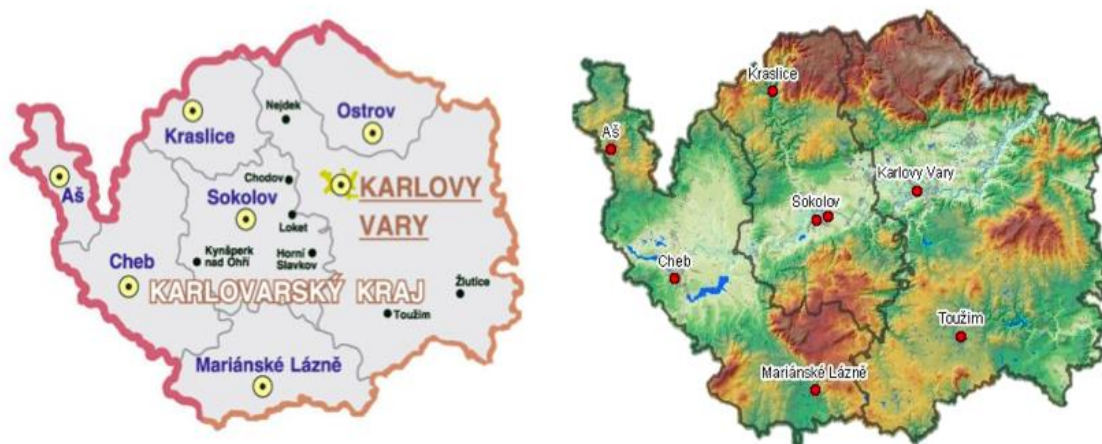
Obrázek 2: Karlovarský kraj