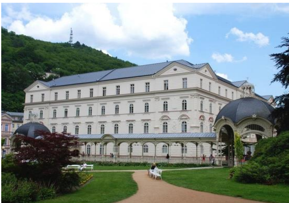
Obrázek 4: Vojenská lázeňská léčebna – Lázeňský hotel Sadový Pramen