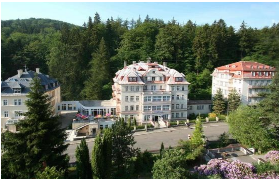
Obrázek 3: Lázeňská léčebna Mánes