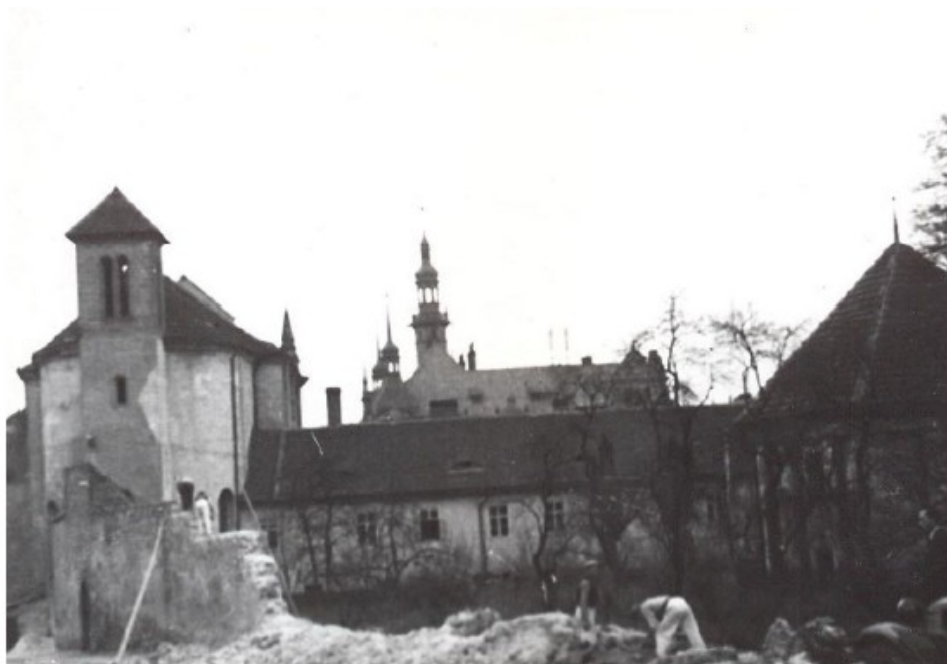
Obrázek 5: Částečně zbořená klášterní zeď v roce 1939.

Podle článku z dvacátého devátého dubna roku 1938 byla pokácena alej vedle klášterní zdi v dnešní ulici 5. května. Údajným důvodem bylo zvětšení plochy veřejného prostranství. Klášter se v rámci této situace vzdal části zahrady ve prospěch města, aby ulice mohla být rozšířena. Na místě vykáčených lip měly být vysazeny jehlancové břízy. Ulice však nemohla být rozšířena rovnoměrně kvůli kostelu na jedné straně a nově opravenému domu na straně druhé. 102