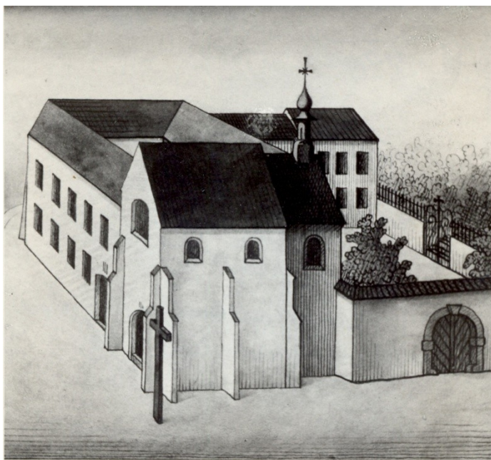
Obrázek 1: Kresba K. Kinského dle plánu františkánských kostelů české provenience z roku 1737. Muzeum Českého ráje v Turnově, inventární číslo A - FT161.

V katalogu knihovny pocházejícím z roku 1678 bylo evidováno 525 svazků, rozdělených do třidvaceti oborů. Většinu svazků tvořila kázání nebo díla napomáhající rekatolizaci. V zastoupení nechyběly ani knihy zkonfiskované jako nevyhovující. Mezi používané jazyky patřily latina, němčina a čeština. Během požáru roku 1707 se podařilo převážnou část knih zachránit. Některé z nich byly poškozeny ohněm, například jako pamětní kniha konventu, v níž byla uprostřed propálena díra. Po této události fundátor věnoval všechny potřebné liturgické knihy a tři chórové breviáře v hodnotě čítající sto zlatých. Největší nákup knih proběhl v roce 1714, pořízeny byly kazatelské knihy a více svazkové foliové Bullarium Romanum.