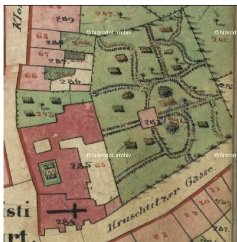
Obrázek 2: Výřez indikační skici stabilního katastru, 1843.

Menší opravy kláštera, vymalování konventu a natření knihovny proběhlo také v roce 1843. Na stabilním katastru vypracovaném v roce 1843 můžeme vidět v zahradě altán z nespalného materiálu. Také nám tento dokument ukazuje půdorys kláštera. 88