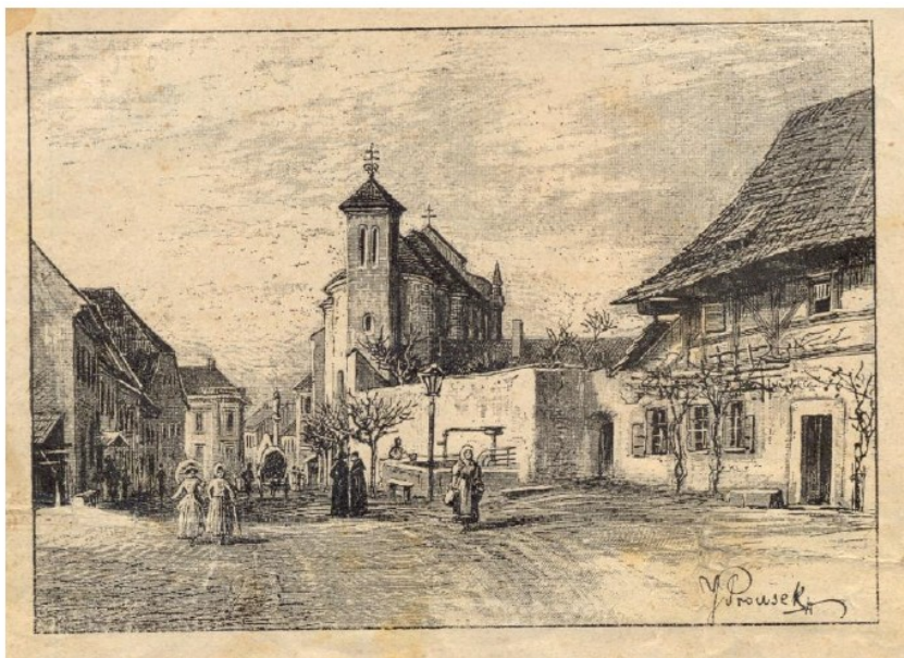
Obrázek 3: Pohled na kostel a klášterní zeď z východní strany, kresba J. Prouska z roku 1880 Muzeum Českého ráje v Turnově, inventární číslo A-FT 160a.