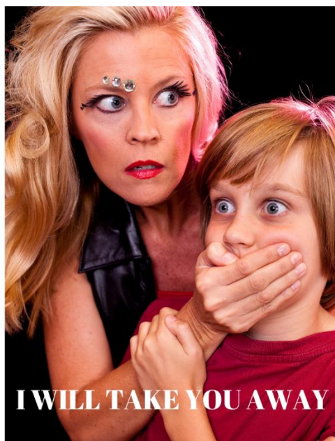
Obrázek 7 Sociální pracovnice bere děti z rodin