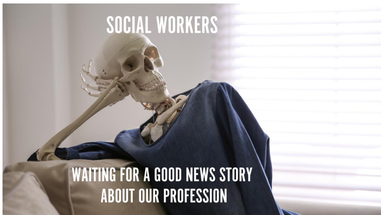
Obrázek 8 Sociální pracovníci a jejich profese