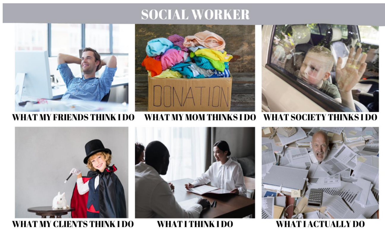
Obrázek 5 Vnímaní profese sociálního pracovníka

Příloha 1: Příklady zábavných a stereotypních obrázků o sociální práci (vlastní zpracování)