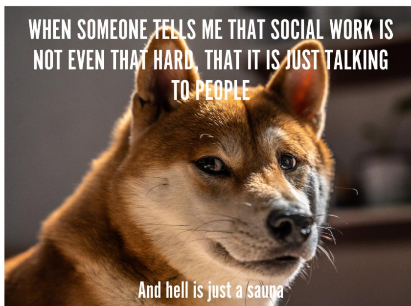
Obrázek 6 Vnímaní sociální práce (vlastní zpracování)